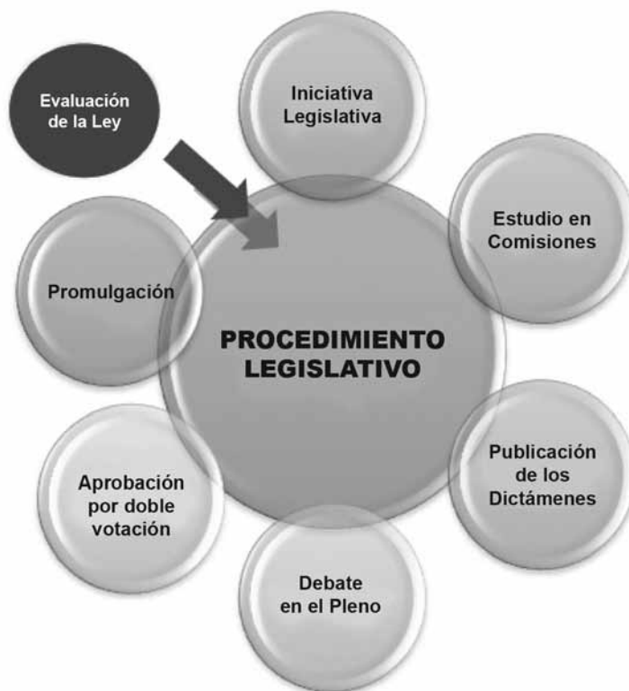
GRÁFICO 1. Etapas del procedimiento legislativo