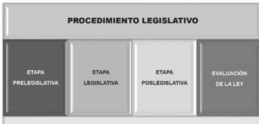
GRÁFICO 2. Macro etapas del procedimiento legislativo