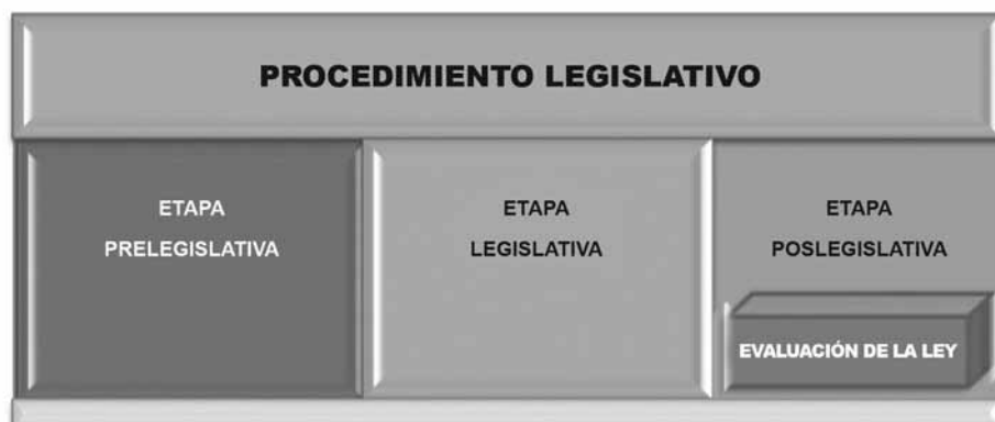
GRÁFICO 3. La evaluación de la ley dentro de la etapa postlegislativa

La segunda opción que consistiría en insertarlo dentro de la etapa postlegislativa, implica una modificación reglamentaria sustancial. Podría graficarse de la siguiente manera: