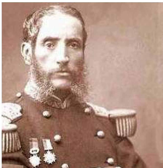
Gran Mariscal Andrés Avelino Cáceres