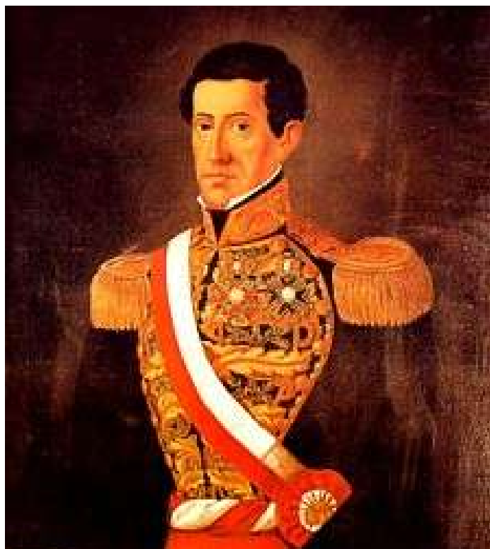
Gran Mariscal Agustín Gamarra Mesía