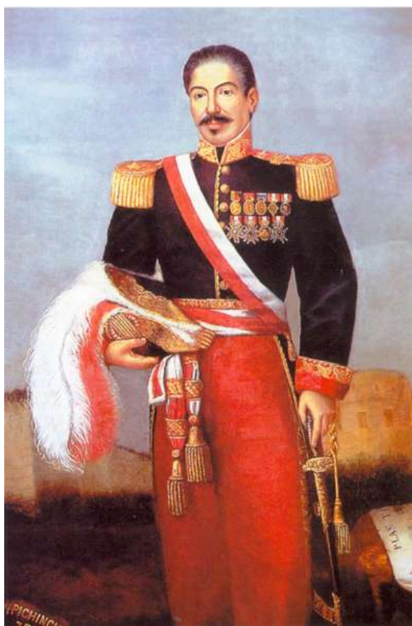
Gran Mariscal Miguel de San Román y Meza