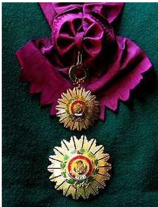
Orden del Sol del Perú