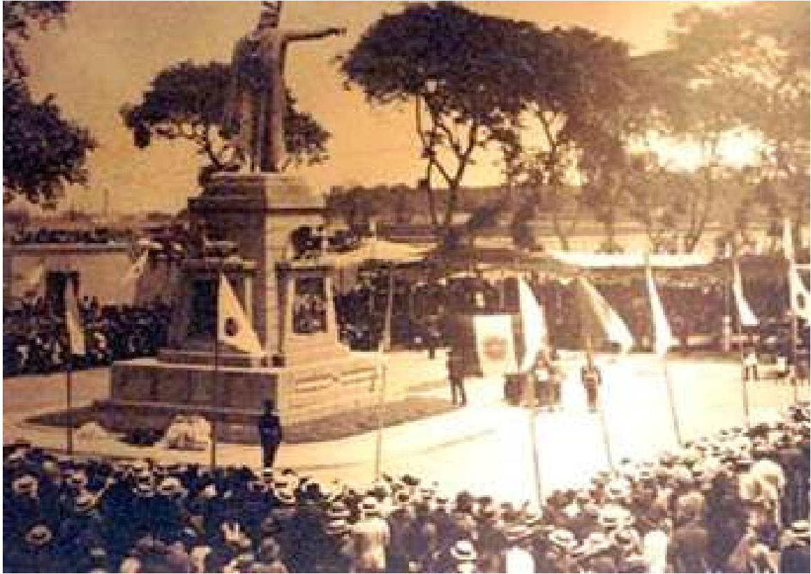
Inauguración del monumento a Manco Cápac (1926).