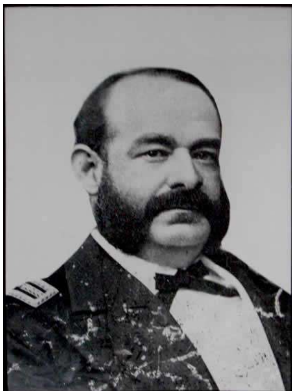
Gran Almirante del Perú Miguel Grau Seminario