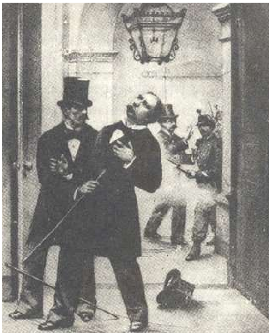
Asesinato de Manuel Pardo y Lavalle, Presidente del Senado Nacional.