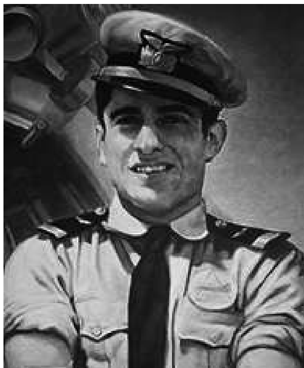
Gran General del Aire FAP José Abelardo Quiñones Gonzales