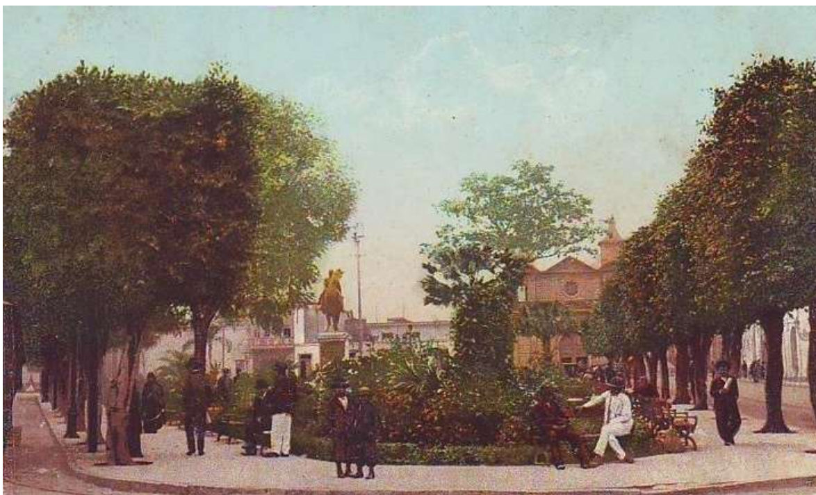
Plaza de la Constitución (antes Plaza de la Inquisición).