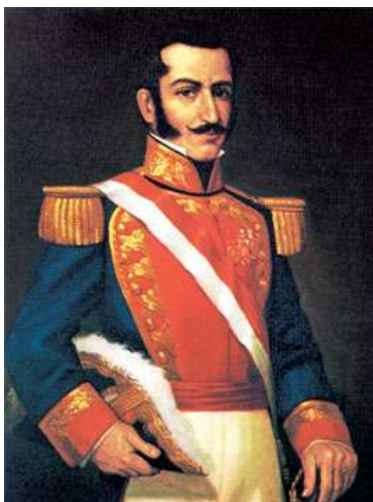
Felipe Santiago Salaverry