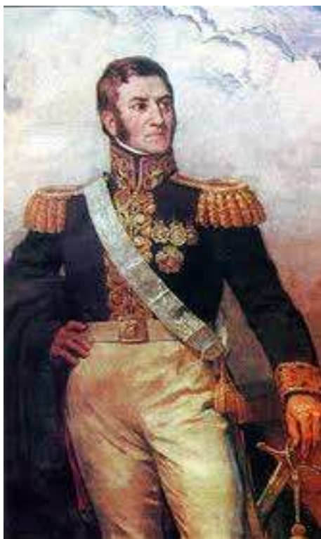
General José de San Martín Matorras Fundador de la libertad del Perú