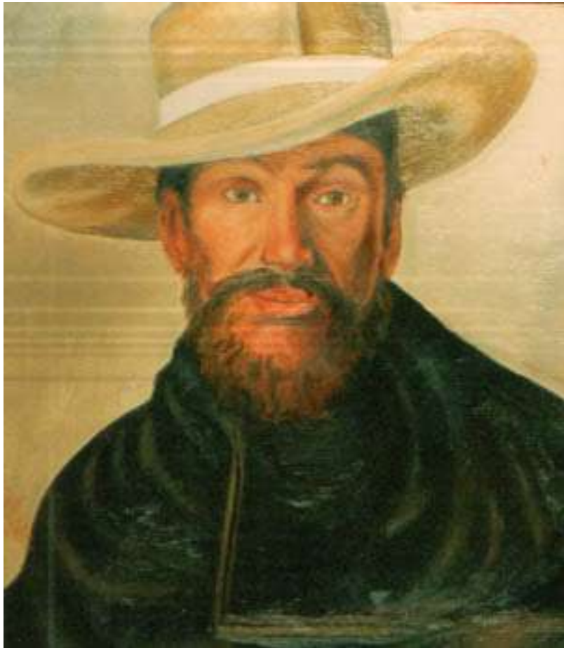
José Faustino Sánchez Carrión