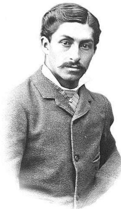
Daniel Alcides Carrión