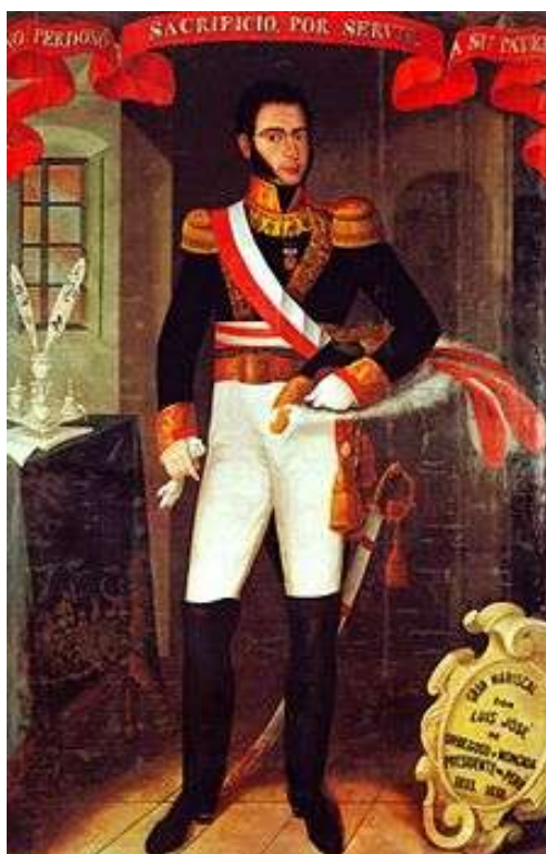
Gran Mariscal Luis José de Orbegoso y Moncada Galindo