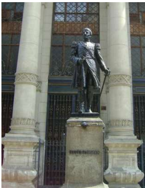
Monumento al Gran Mariscal Ramón Castilla Marquesado