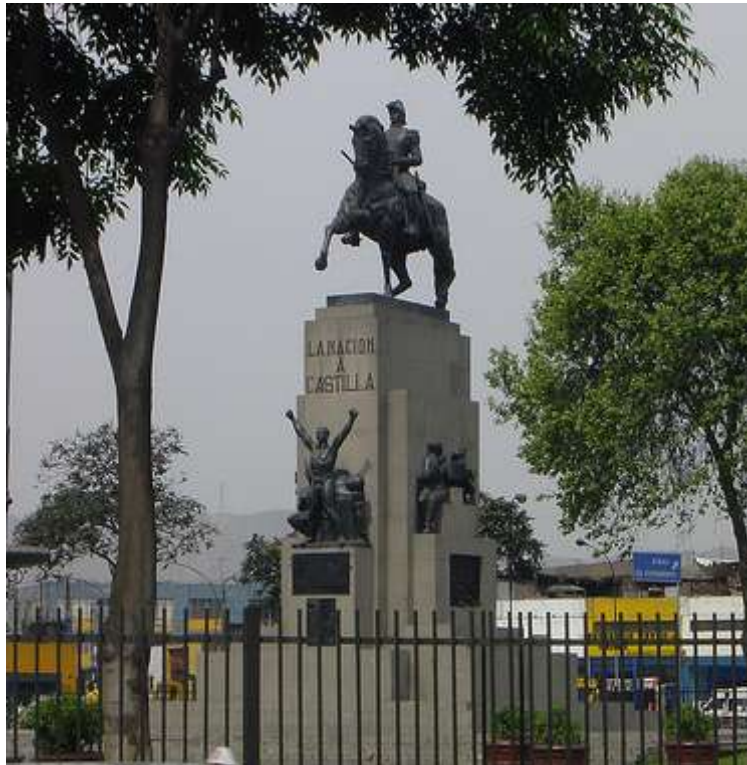
Monumento al Gran Mariscal Ramón Castilla Marquésado,