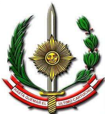
Ejército del Perú