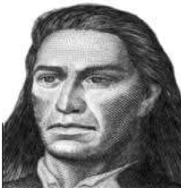
Túpac Amaru II