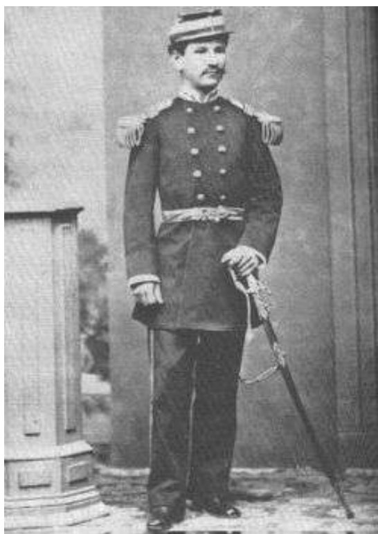
Coronel Alfonso Ugarte y Vernal