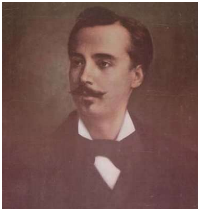
Coronel Leoncio Prado Gutiérrez