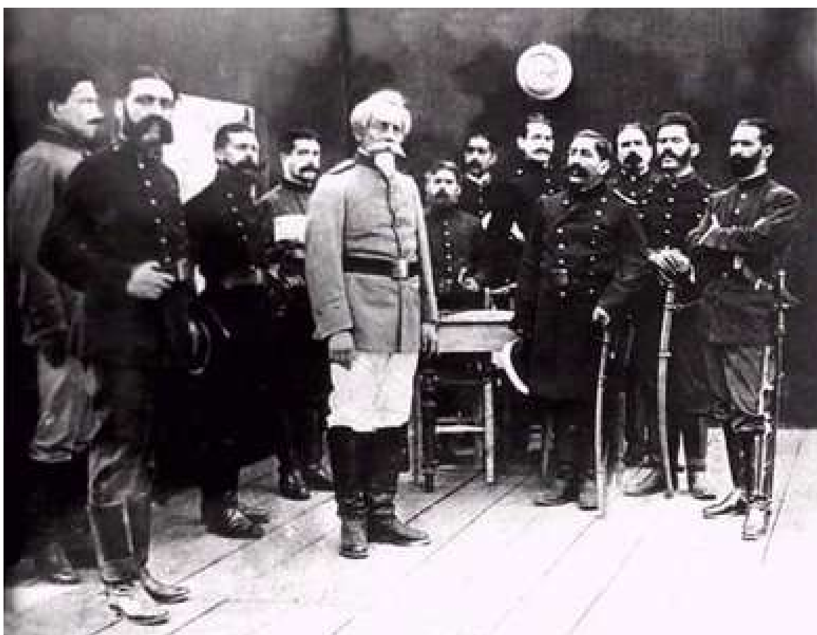
Gran Mariscal Francisco Bolognesi Cervantes y sus