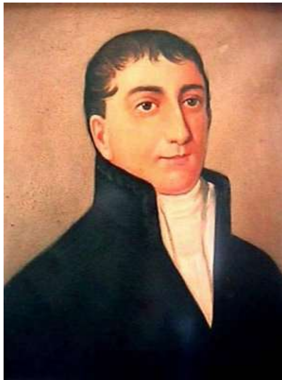
Hipólito Unánue Miembro del primer Congreso Constituyente del Perú

“Impresionado por la contemplación de los edificios monumentales dejados por los Incas y de los extraños paisajes que la naturaleza ofrecía ante su vista, el Virrey Francisco de Toledo escribió a Felipe II sobre «la conveniencia de formar en la recámara real un museo de curiosidades y producciones naturales indianas». Pero puede presumirse que entonces no se cristalizó en hechos este discreto interés por las «curiosidades» del antiguo Perú, pues sólo con el advenimiento de los Borbones se halla una providencia enderezada a lograr la recolección sistemática de «todas las cosas singulares» que hablasen de lo «extraordinario» de la naturaleza americana: «Que los virreyes, gobernadores, corregidores y otros, cualesquiera que sean las personas, recojan todas las cosas singulares de piedras, animales, plantas, yerbas y frutos de cualquier género que no sea común, sino extraordinario o por su especie o por su tamaño, y lo remitan con explicación de los nombres de las referidas cosas con nota de las propiedades de cada una y de sus usos, con distinción de las ciertas y dudosas» (real cédula de 4-VIII-1712) 2 ”.