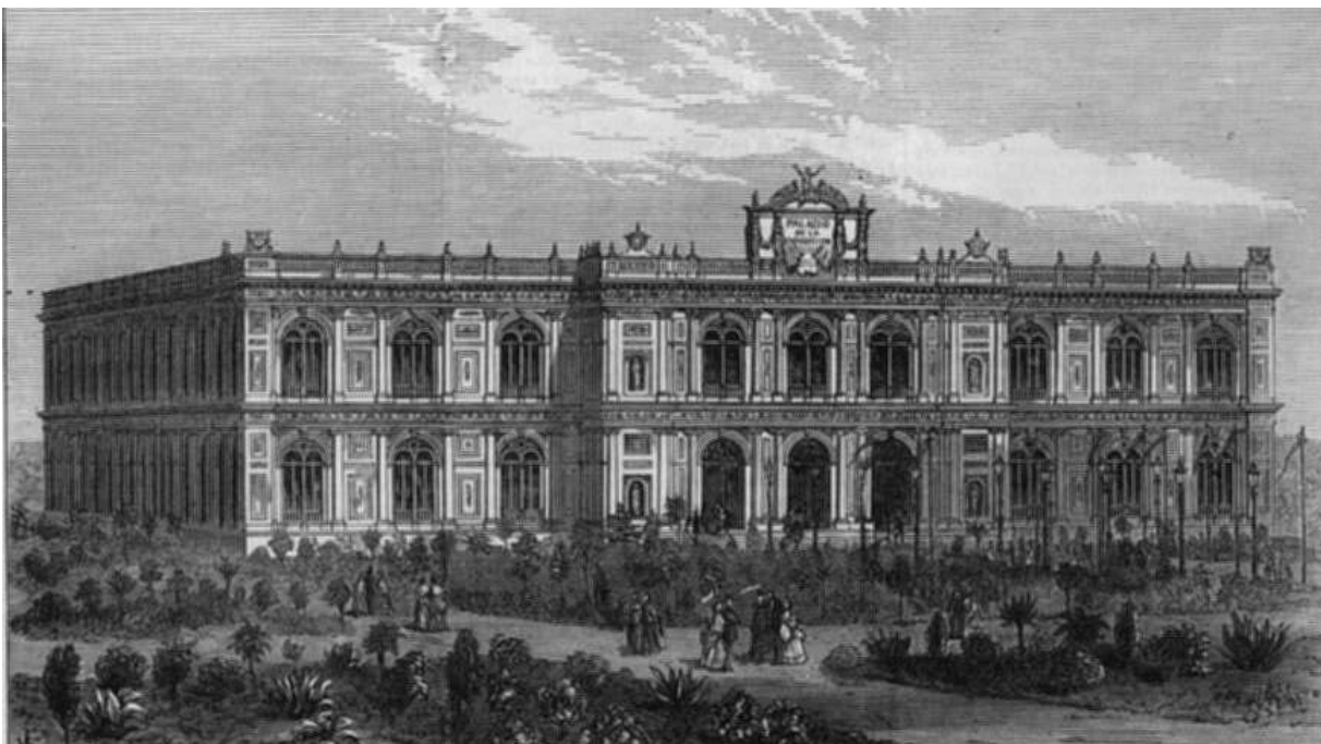
Museo Nacional (1872-1881). Actual Museo de Arte de Lima.

falleció el 19 de mayo de 1857; realizándose sus funerales el 21 en el Sagrario 8 .