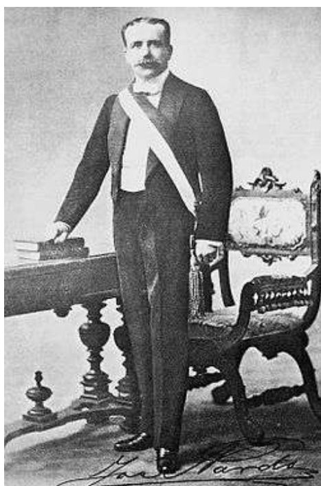
José Pardo y Barreda, Presidente de la República. El 6 de mayo de 1905 estableció el Museo de Historia Nacional

Poco tiempo después, todo lo que se había logrado durante más de medio siglo de trabajos fue saqueado por las tropas chilenas durante la ocupación de Lima. En esta forma tan dramática el Perú perdió su Museo Nacional pues las colecciones que lo constituían fueron saqueadas y enviadas a Chile por las tropas invasoras 11 .