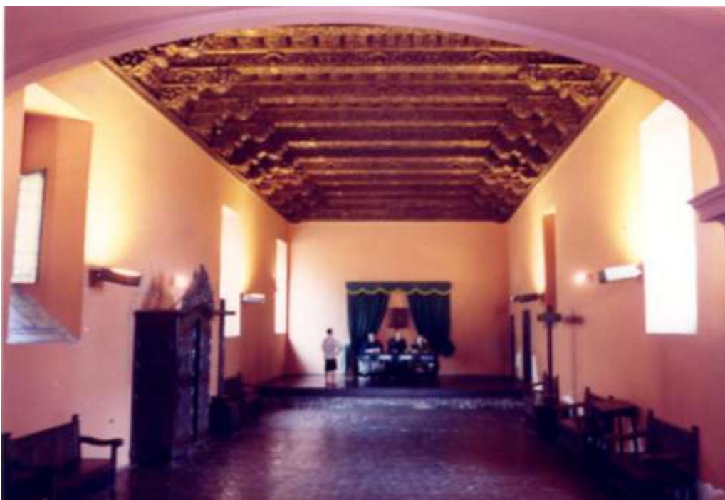
Sala principal del Museo Nacional (1826-1836). Durante la colonia había sido Sala de Audiencias de la Inquisición y, luego del traslado del Museo, fue Sala de Sesiones del Senado Nacional.