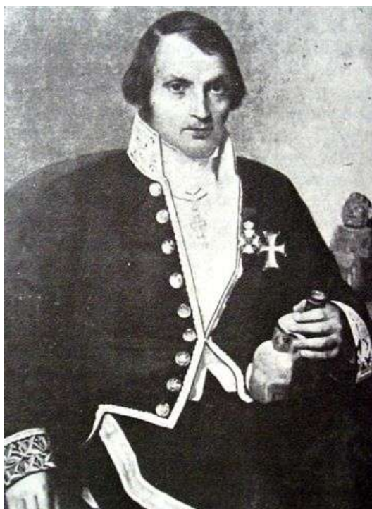
Mariano de Rivero y Ustáriz, primer Director del Museo Nacional (1826) y Diputado por Caylloma (1832-1836)

“Creído necesario al logro de sus honrosos designios establecer el Museo, proyectado en el año de 1822, para proporcionar a la juventud, que se dedique al estudio sublime de la naturaleza, colecciones escogidas que la instruyan en las propiedades de los seres orgánicos e inorgánicos”.