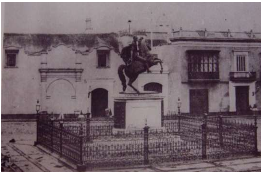
Museo Nacional (1826-1836). Actualmente es la sede del Museo del Congreso y de la Inquisición.

El Museo Nacional fue establecido por Hipólito Unánue, a través de un decreto del 2 de diciembre de 1825, el que dispuso que dos salones de la Inquisición se dedicasen «a un museo de pinturas» y las habitaciones del centro con las demás piezas del patio principal las destinó para vivienda del «director que fuere de este ramo». Asimismo, el edificio principal lo dedicó a la realización de conciertos de música. Por otra parte, el mismo decreto cedió a la Sociedad Filarmónica, «para los objetos de su instituto», la capilla y otros ambientes del local de la Inquisición.