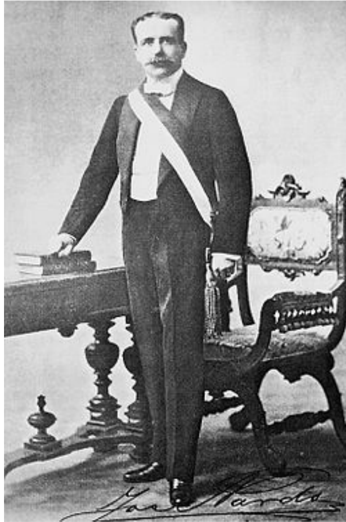
José Pardo y Barreda, Presidente de la República. El 5 de mayo de 1906 estableció el Museo de Historia Nacional

Dado el personal que compone el Instituto, hay que esperar que la nueva institución corresponderá a los propósitos que la han inspirado y que será un estímulo eficaz para el desarrollo de los estudios históricos y, en general, para la cultura del país”.