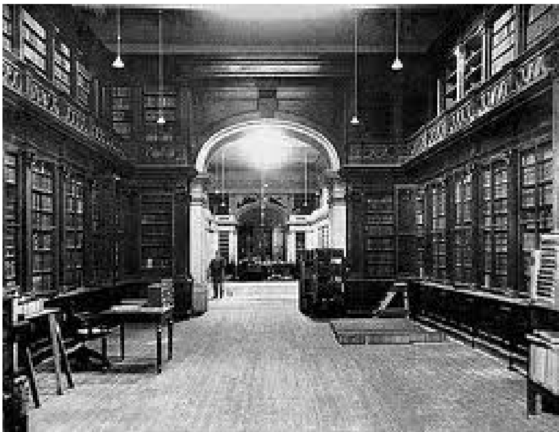
Museo Nacional (1839-1872). Durante estos años funcionaba en algunas salas del antiguo local de la Biblioteca Nacional.

de apoyo económico impidió que el cambio de local condujera a mejoras en el Museo. Por dicha razón, Antonio Gutiérrez de La Fuente, el 16 de abril de 1839, ordenó que fuese trasladado al local de la Biblioteca Nacional. El 19 del mismo mes La Fuente dispuso que el Colegio de Educandas se trasladase al local del Espíritu Santo, limitando el funcionamiento del Museo a la segunda planta de dicho inmueble hasta que se hiciese su mencionado traslado al local de la Biblioteca Nacional. Por otra parte, también dispuso que la renta producida por el alquiler de la Capilla de la Inquisición se destinase al mantenimiento del Museo.