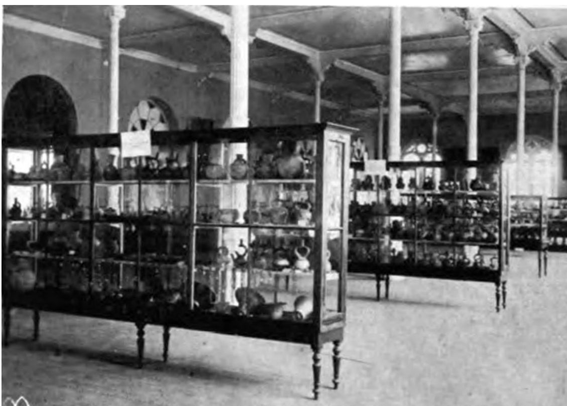
Sección Arqueológica del Museo de Historia Nacional en el Palacio de la Exposición (1906) 13

“El Museo está formado de tres secciones: una arqueológica, en que se reúnen los restos prehistóricos del país; una de los indios y las tribus salvajes, en que se recogen los útiles, armas, etc., de los indios de la montaña del país y llegarán a ser representadas también las costumbres y técnicas de los indios contemporáneos de la sierra; y sección de la Colonia y la República en que se conservan los recuerdos de las grandes épocas de la historia nacional, los de los hombres prominentes que han tomado parte en formarla y otros, que pueden ilustrar el desarrollo psicológico y artístico en los periodos modernos del país”.