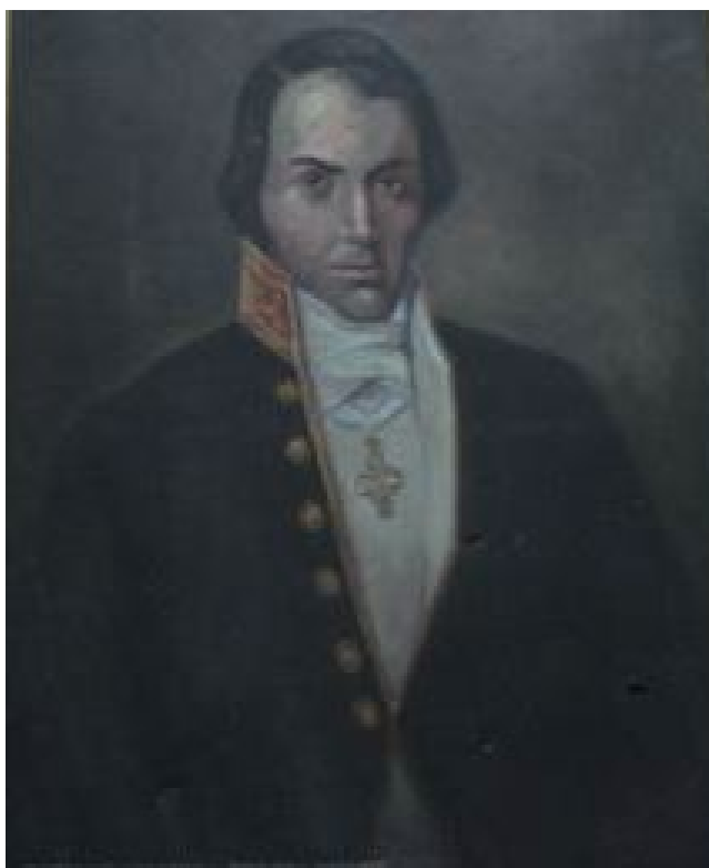
Mariano de Rivero y Ustáriz Primer Director del Museo Nacional (1826) y Diputado por Caylloma (1832-1836)

municipalidades y párrocos, en la que les informaba que el Consejo de Gobierno había...