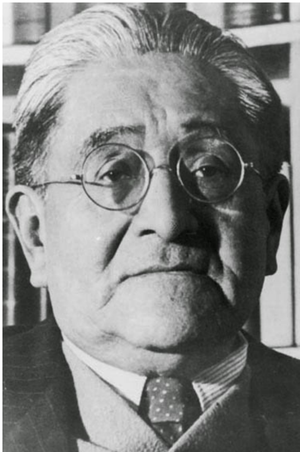
Julio César Tello Rojas

Libertadores: la Quinta de los Libertadores (Magdalena Vieja), la casa de Huaura en que vivió el general San Martín, la casa de Pativilca en que vivió el Libertador Bolívar; Museos de la República: el actual Museo Nacional de la República y el Museo Leoncio Prado de Huánuco.