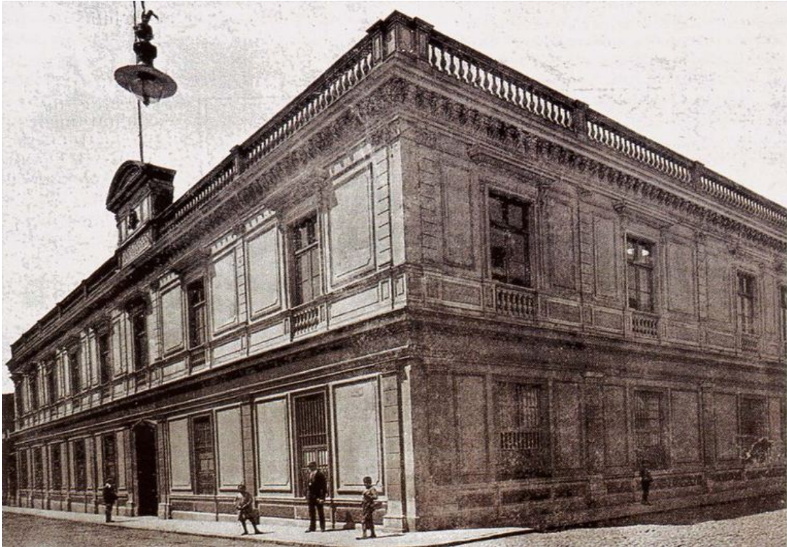
Museo Nacional (1836-1839). Durante la colonia en este lugar funcionaba el Hospital del Espíritu Santo; luego tuvo diversos usos, el último de ellos Escuela Nacional de Ingenieros.