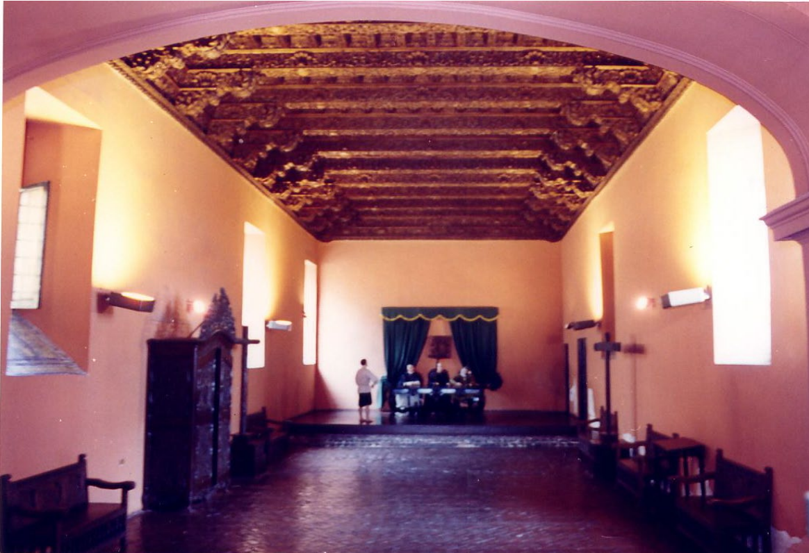
Sala principal del Museo Nacional (1826-1836). Durante la colonia había servido como Sala de Audiencias del Tribunal de la Inquisición y, luego del traslado del Museo, de Sala de Sesiones del Senado Nacional.