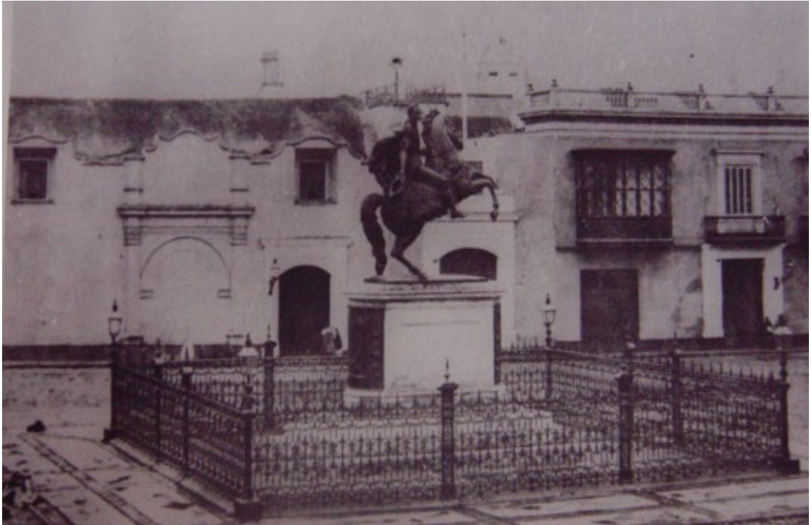
Museo Nacional (1826-1836). En el inmueble funcionó el Tribunal de la Inquisición durante el virreinato y, luego del traslado del Museo, sirvió de sede al Senado Nacional. Actual Museo del Congreso y de la Inquisición.