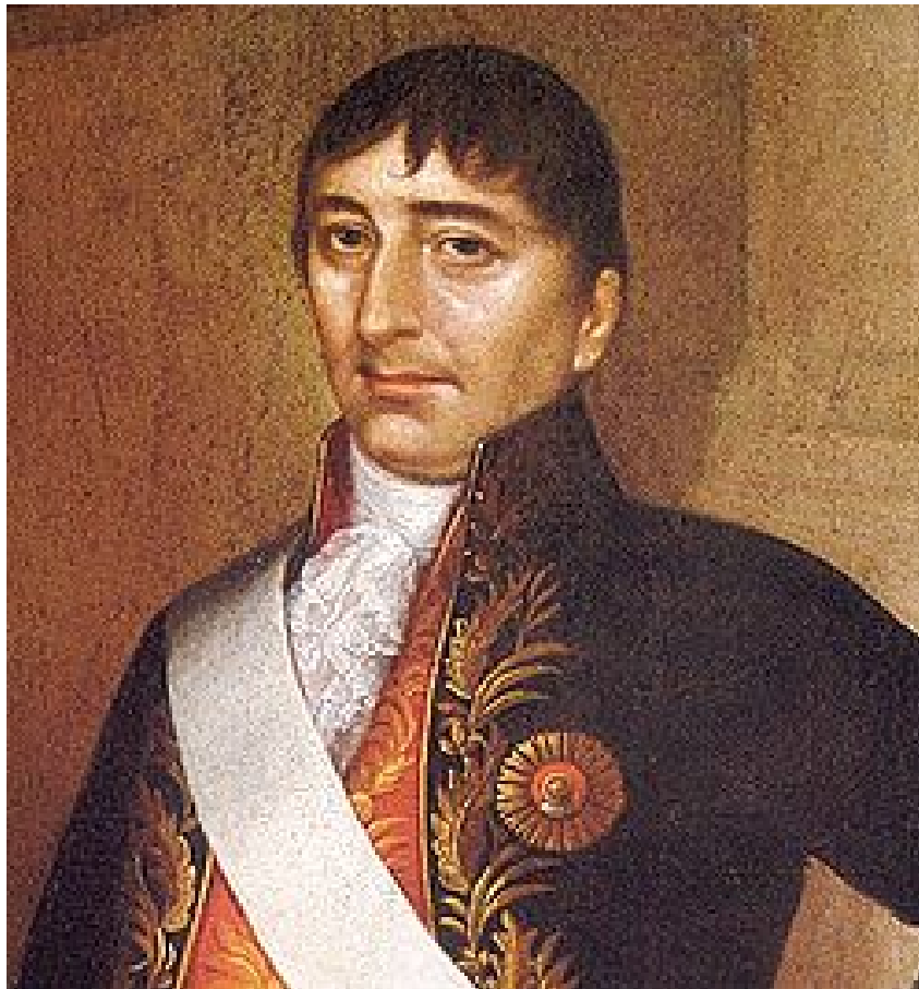
Hipólito Unanue Miembro del primer Congreso Constituyente del Perú

explicación de los nombres de las referidas cosas con nota de las propiedades de cada una y de sus usos, con distinción de las ciertas y dudosas» (real cédula de 4-VIII-1712) 2 .