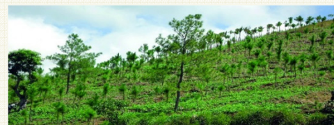
FORESTACION Y REFORESTACION