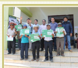
TITULACION DE TIERRAS