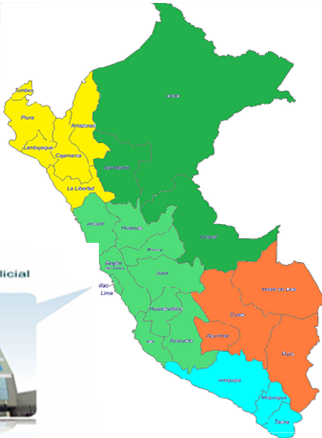
Tribunal Supremo Militar Policial Sede: Lima