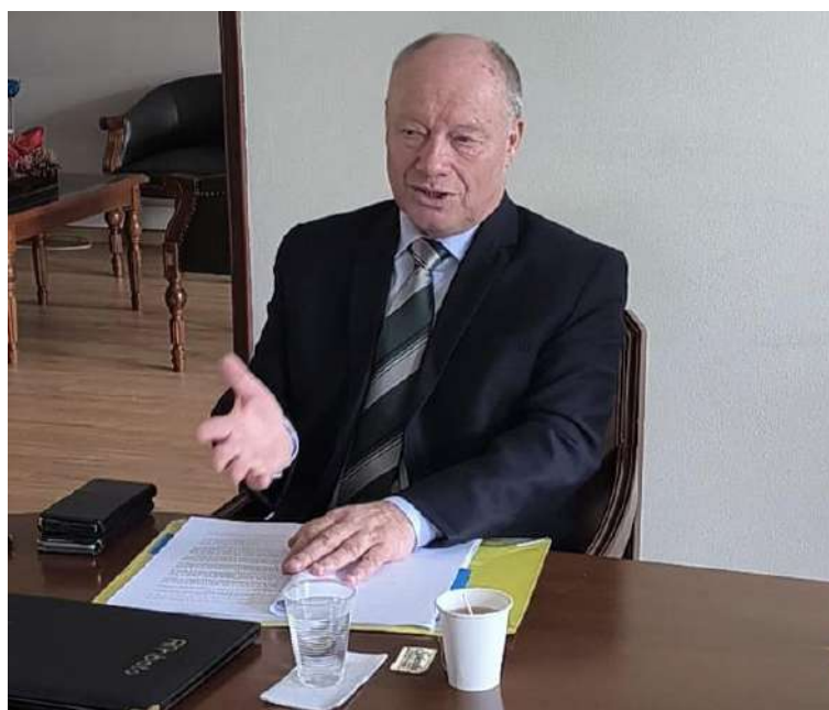
Imagen: Comisión Quinta “De Derechos Humanos, Desarrollo Social y Participación Ciudadana” (25.02.2026)

Por mi parte, precisé las dificultades que supone emitir recomendaciones en materia de generación y uso de datos, considerando que los Estados miembros del Parlamento Andino no son, en primera instancia, quienes gestionan y administran dichos datos, función que recae principalmente en empresas privadas.