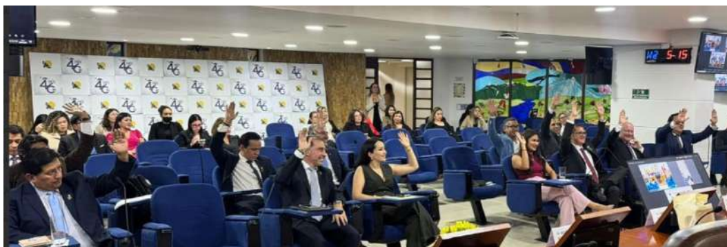
Imagen: Votación del Proyecto de Presupuesto Anual Institucional para la vigencia 2026

En ese sentido, se informó que el monto proyectado asciende a 7.514 millones de pesos colombianos, lo que representa cerca de 2 millones de dólares. Además, señaló que este presupuesto ya fue aprobado por el Congreso de Colombia en las comisiones económicas conjuntas y que se espera que, una vez instalado nuevamente el Congreso colombiano, se realicen las transferencias correspondientes a las cuentas del Parlamento Andino, lo que permitirá garantizar el flujo de caja y la continuidad de las actividades institucionales. El proyecto fue aprobado por unanimidad.