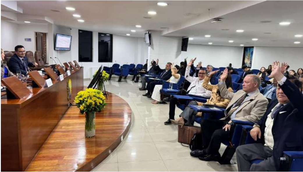
Imagen: Votación del proyecto de pronunciamiento para declarar al Ramal Ferroviario Talca–Constitución como patrimonio cultural de la región andina.

Esta actividad responde a la Actividad Estratégica 1.1. Asistencia de los parlamentarios andinos del Perú a sesiones de plenarias mesa directiva comisiones y otros, del Plan de Gestión julio 2021 – julio 2026 de la Oficina de la Representación Parlamentaria del Perú ante el Parlamento Andino.