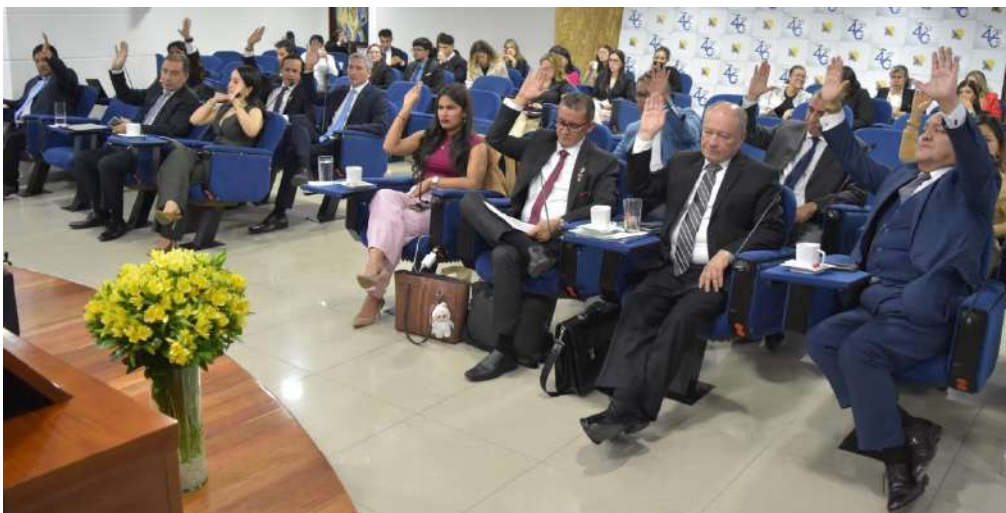
Imagen: Votación de los informes de comisiones permanentes (26.02.2026)