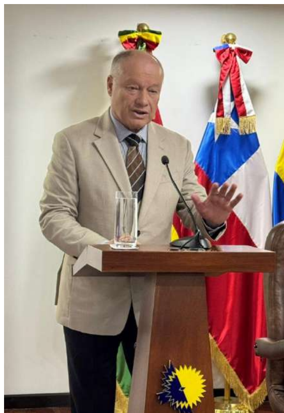
Imagen: Presentación y debate de la propuesta de Norma Comunitaria sobre Salud Mental (27.02.2026)

En ese contexto, destacué que los Estados deben anticiparse a estos desafíos, promoviendo marcos normativos que permitan abordar la salud mental de manera integral, no solo desde una perspectiva clínica, sino también considerando sus dimensiones sociales, económicas y culturales.