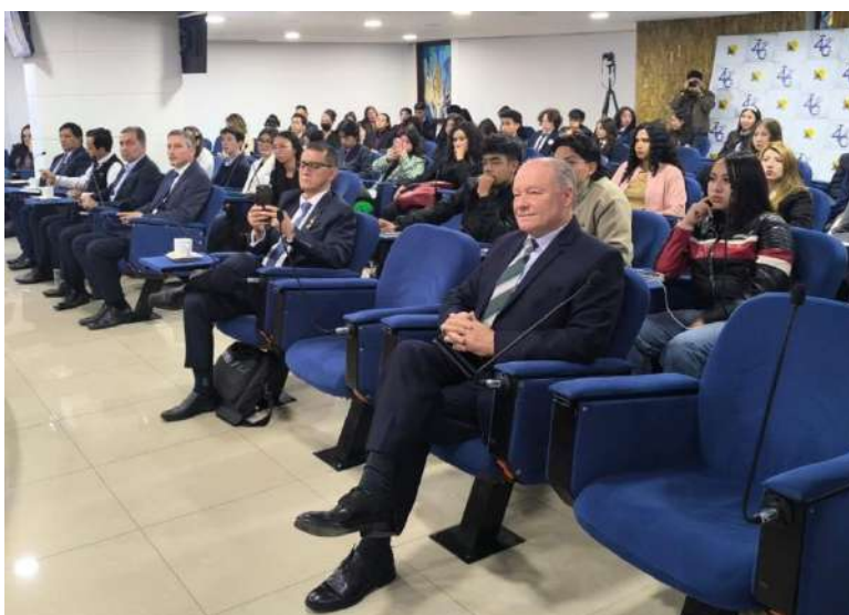
Imagen: Lanzamiento Escuela Andina de Debate (25.02.2023)