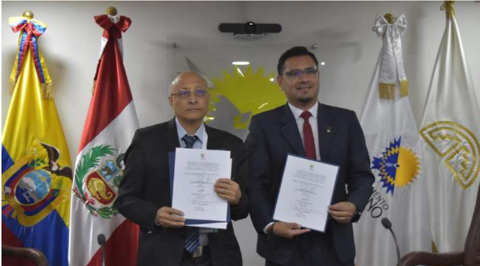
Imagen: suscripción de la Carta de Adhesión del municipio de San Juan de Pasto (Colombia) a la Red Andina de Autoridades Territoriales (26.02.2026)

La adhesión de Pasto fortalece la Red Andina de Autoridades Territoriales como espacio de articulación entre gobiernos locales, permitiendo intercambiar buenas prácticas en desarrollo cultural, gestión territorial, turismo sostenible y cooperación descentralizada. Este tipo de incorporaciones refuerza la dimensión territorial de la integración andina, acercando el Parlamento a las dinámicas locales y promoviendo una integración con impacto directo en la ciudadanía.