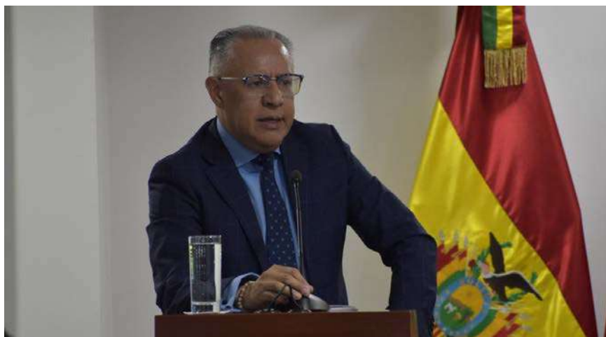
Imagen: Plan de Gestión Institucional del Parlamento Andino para el año 2026 (26.02.2026)