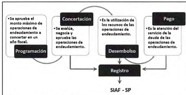
Figura N° 1 Procesos del Endeudamiento Público