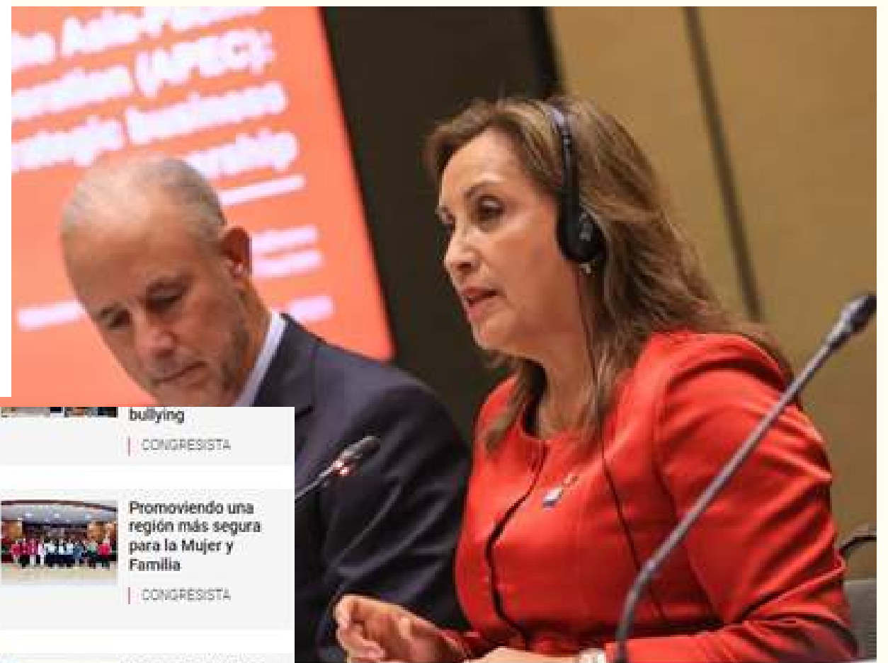
5 legisladores de diversas bancadas.