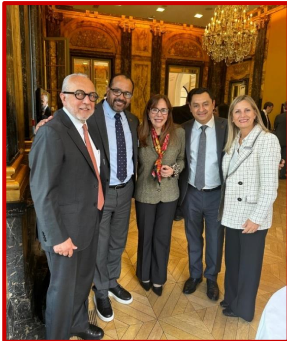
La congresista María del Carmen Alva Prieto con la delegación de México

publicación científica, patentes, desarrollo empresarial o en seguridad, entre otras actividades; pero que jamás distorsione la verdad de los hechos ni la historia de nuestros pueblos”.