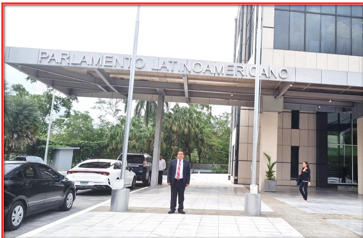
Congresista Alfredo Pariona, Presidente de la Comisión Especial de Seguimiento Parlamentario al Acuerdo de la Alianza del Pacífico del Congreso de República del Perú, en la sede del Parlamento Latinoamericano y Caribeño, Ciudad de Panamá