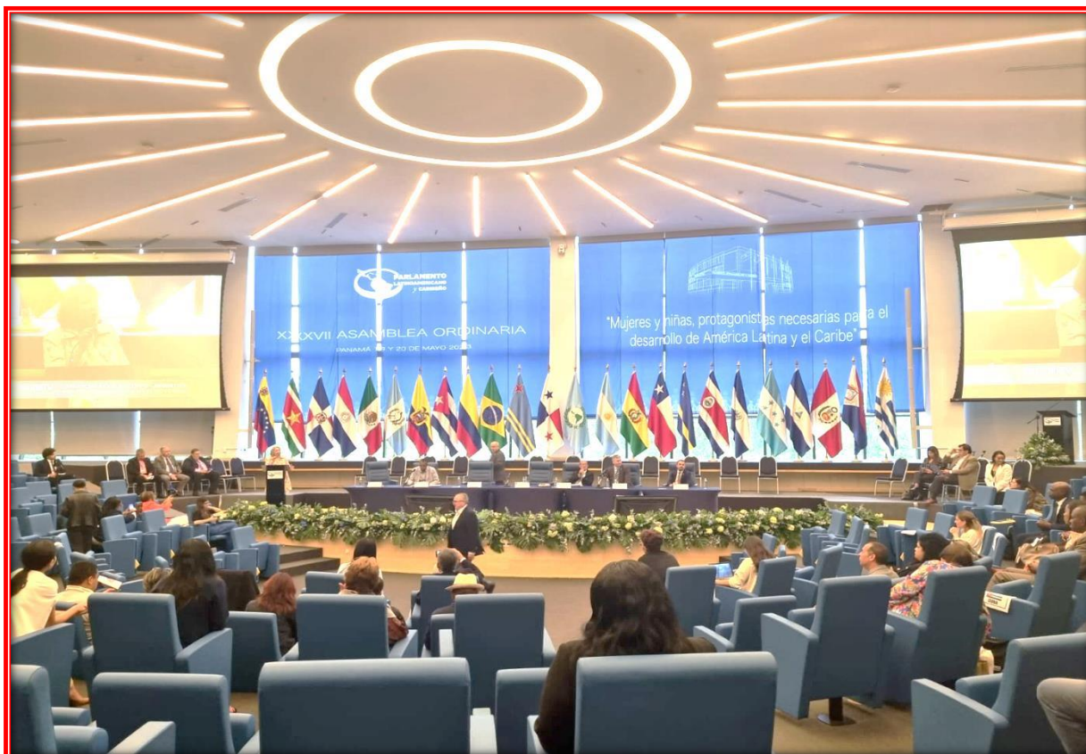
Inauguración de la Cumbre de Parlamentos Regionales de Integración realizado en la sede del Parlamento Latinoamericano y Caribeño, ciudad de Panamá