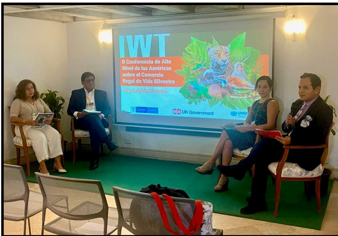
SIDE EVENT Promoción del tráfico de vida silvestre como crimen organizado en Perú: lecciones aprendidas trabajando con el Congreso Peruano, Fiscales Ambientales y la sociedad civil.