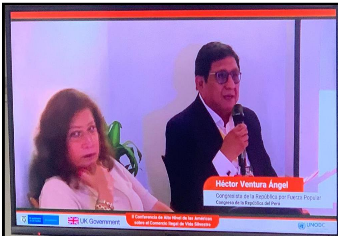
Exponiendo mi proyecto de ley N° 463 – Proyecto de Ley que modifica el artículo 3 de la Ley 30077, Ley contra el Crimen Organizado.