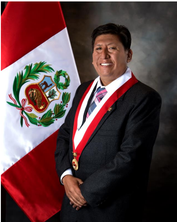
WALDEMAR JOSÉ CERRÓN ROJAS CONGRESISTA DE LA REPÚBLICA