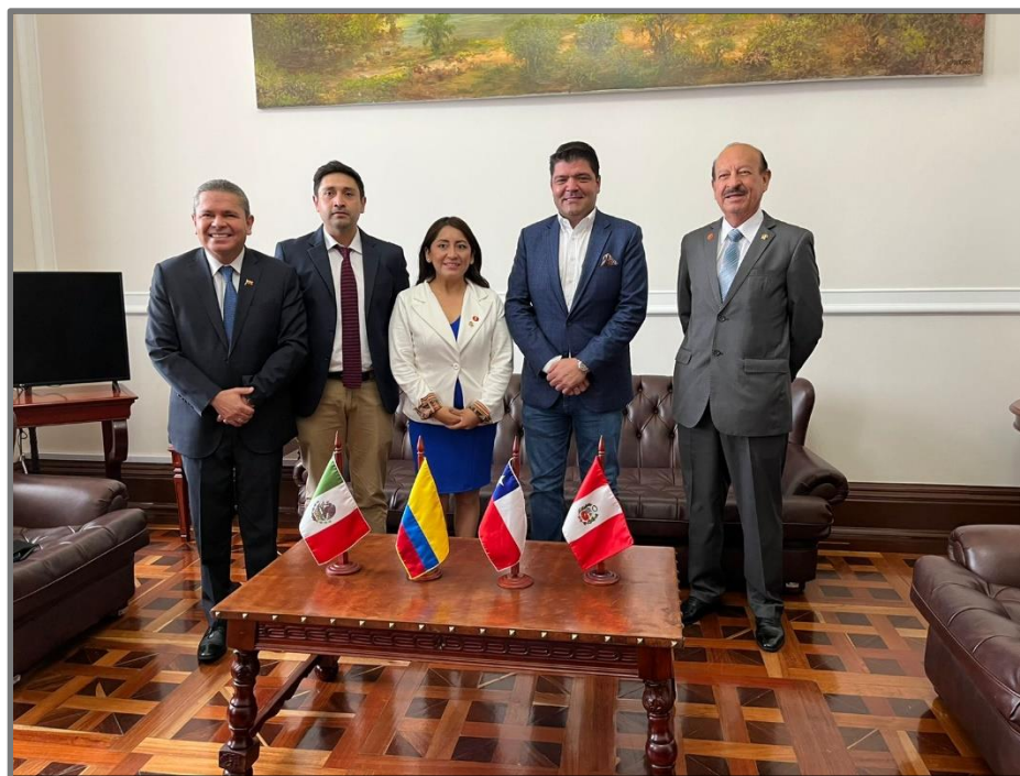
Reunión con el presidente del Congreso de la República de Colombia Juan Diego Gómez.