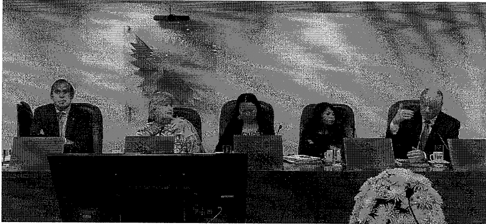
Imagen 8: Durante mi intervención en el debate del proyecto de Marco Normativo sobre Áreas Protegidas Naturales Andinas (30.06.2023)