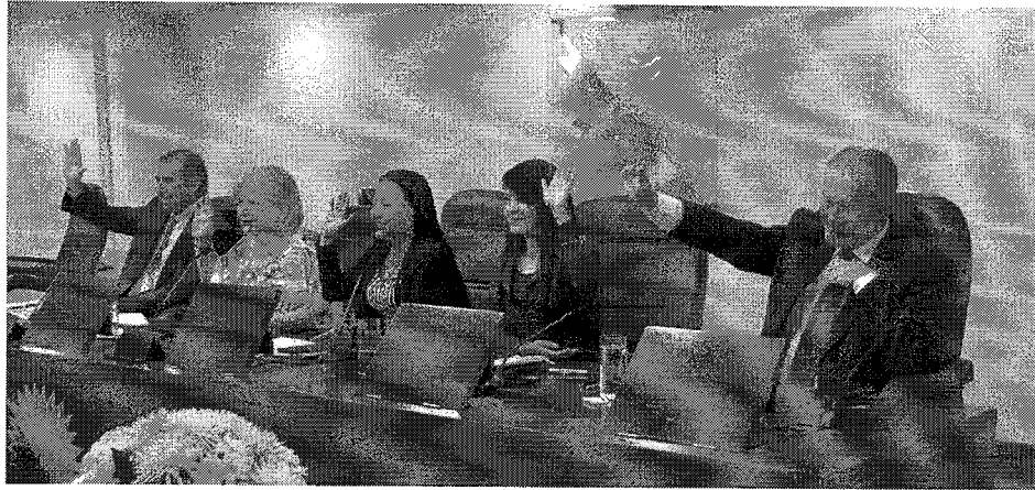
Imagen 7: Votación de la Propuesta de Norma Comunitaria sobre Mecanismos de Protección de los Derechos Sociolaborales para las Trabajadoras(es) del Servicio Doméstico o del Hogar en los Países Andinos (30.06.2023)

y a ser tomados en cuenta en los diálogos tripartitos sobre las políticas que les competen.