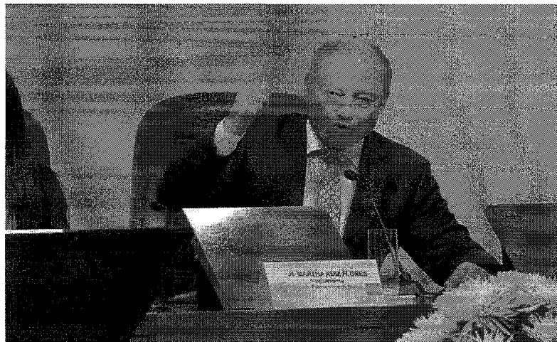
Imagen 2: Mi intervención en la Sesión Plenaria del 29 de junio, durante el debate de la propuesta de Declaración Foro Regional de Migraciones para América Latina y el Caribe

Por mi parte, señalé que es necesario abordar las causas que originan este fenómeno migratorio. Asimismo, sostuve que se debe de defender a todos, tanto migrantes y población nacional; siendo necesario repensar los derechos humanos de aquellas personas indignas y criminales que nos están atacando duramente en todos los países de la región. Alguien inhumano, que llama a una familia para aterrorizarla y extorsionarla, y no la deja trabajar ni progresar, no puede tener los mismos derechos humanos que una persona honesta y de bien.