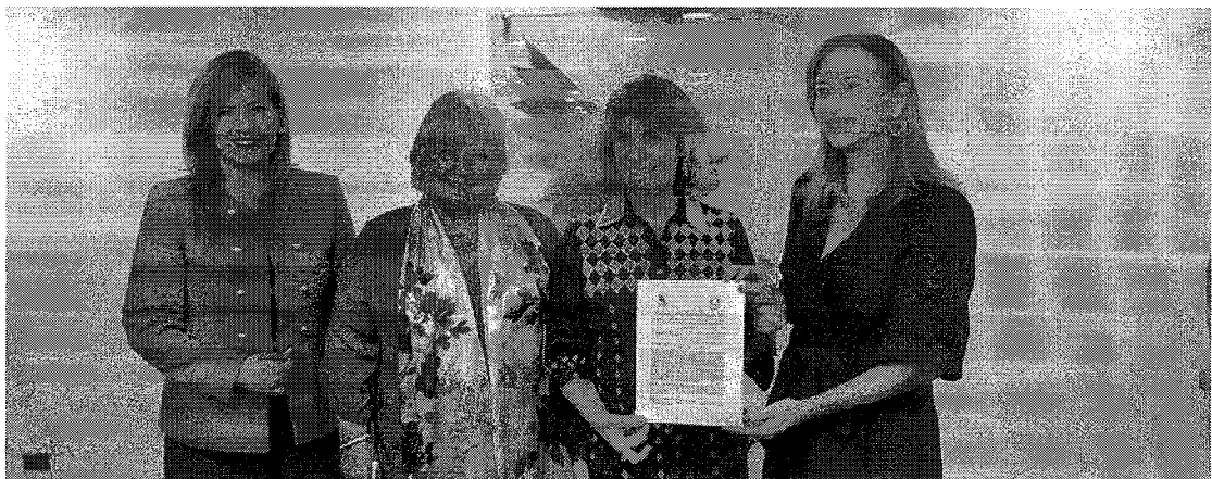
Imagen 4: Entrega de la Declaración Foro Regional de Migraciones para América Latina y el Caribe

Esta Declaración tiene como fin contribuir con propuestas que sirvan de insumos para la reunión preparatoria de la "Cumbre Latinoamericana y Caribeña de Migraciones", a realizarse próximamente en México.