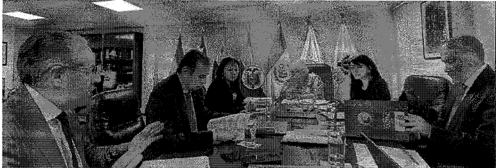
Imagen 5: Sesión de la Mesa Directiva del 30 de junio del 2023

Autoridades Territoriales que se llevará a cabo el 24 y 25 de agosto en la ciudad de Bogotá, y reunirá a los alcaldes de las principales ciudades de los Estados Miembros del Parlamento Andino. Asimismo, se aprobaron los cambios presentados por la delegación peruana en relación con su Reglamento Interno y Plan de Gestión Institucional.