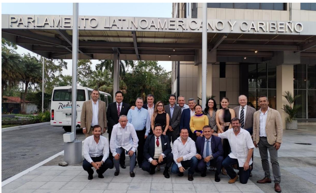
Sesión Plenaria: Clausura (31/01/2025)

No habiendo más por debatir, se dio por terminada esta sesión.