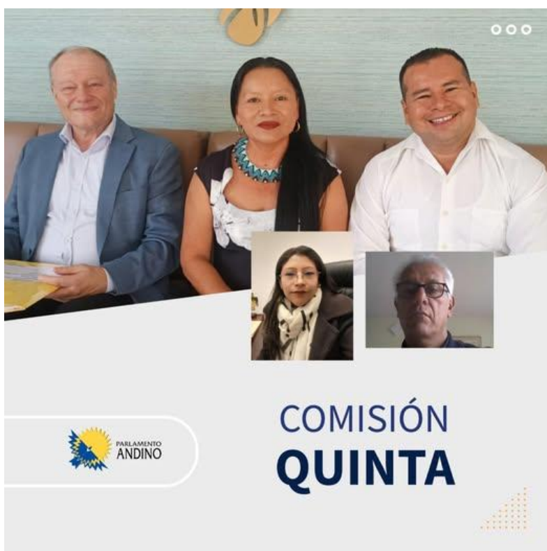
Sesión de la Comisión Quinta (28/01/2025)

Tras la verificación del quórum, se dio lectura al orden del día; asimismo, se tomó conocimiento del acta anterior, correspondiente al mes de noviembre, la cual fue votada y aprobada por unanimidad.