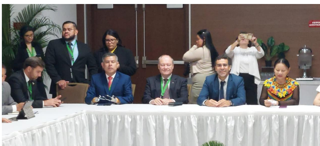
Foro Económico CAF 2025: Diálogo informal con CAF y PARLATINO (30/01/2025)