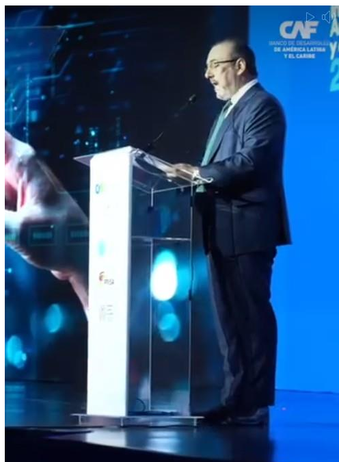
Foro Económico CAF 2025: Sergio Díaz-Granados, presidente ejecutivo de CAF (29/01/2025)