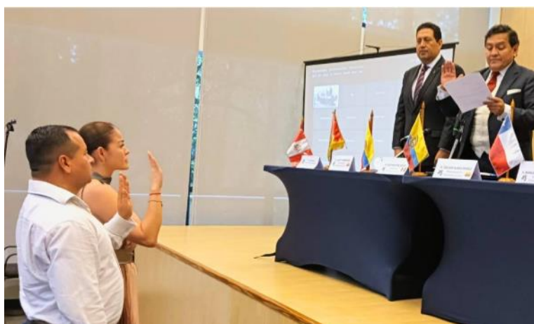
Sesión Plenaria: Juramentación de parlamentarios (31/01/2025)