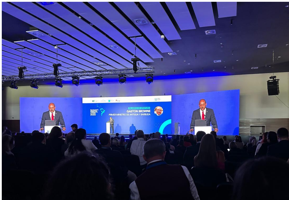
Foro Económico CAF 2025: Gastón Browne, primer ministro de Barbuda y Antigua (30/01/2025)

En su intervención, Browne señaló la tecnología y la innovación, así como la formación del capital humano, como las claves para el desarrollo sostenible en su país. En la actualidad Antigua y Barbuda es la primera isla del Caribe que cuenta con un 100% de sus actividades basadas en energía sostenible, por lo que el primer ministro identificó las iniciativas de su país respecto al cambio climático.