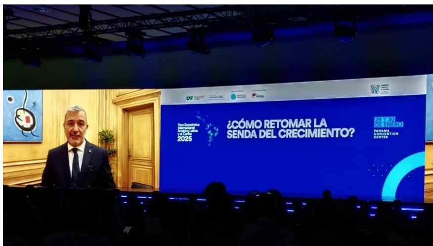
Foro Económico CAF 2025: Jaume Collboni, alcalde de Barcelona (30/01/2025)

El alcalde de Barcelona puntualizó en su intervención que el progreso solo avanza con una actitud esperanzadora, remarcando la importancia de la industria cultural, la cual en su ciudad se enriquece con los aportes de los grandes autores latinoamericanos. Se refirió a la actualidad como tiempos de la cooperación y del comercio , en base a intereses compartidos y el respeto. Antes de finalizar remarcó que la institucionalidad es la base del crecimiento económico.