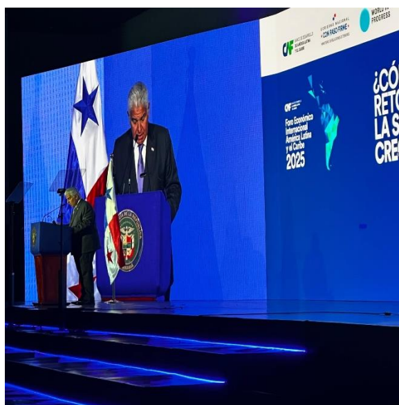
Foro Económico CAF 2025: José Mulino, presidente de Panamá (29/01/2025)

En su intervención el presidente de Panamá, resaltó que el Banco de Desarrollo de América Latina y El Caribe CAF se ha transformado en una herramienta principal para que las ideas salgan del papel y se hagan realidad en nuestros países. Mulino expresó que los financiamientos que se gestionen deben estar en la línea de la eficiencia, facilidad de servicios y disminución de la burocracia; así como en favor de la tecnología y la infraestructura productiva.