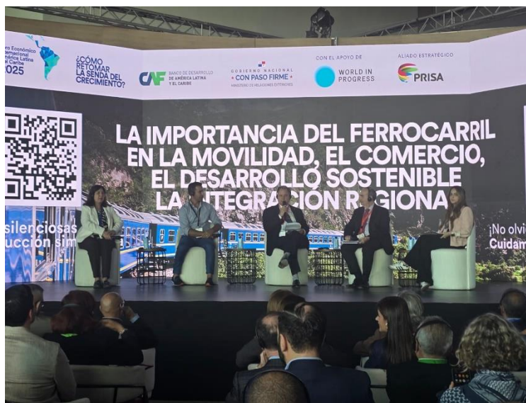
Foro Económico CAF 2025: Sesión “La importancia del ferrocarril en la movilidad, el comercio, el desarrollo sostenible y la integración regional” (30/01/2025)