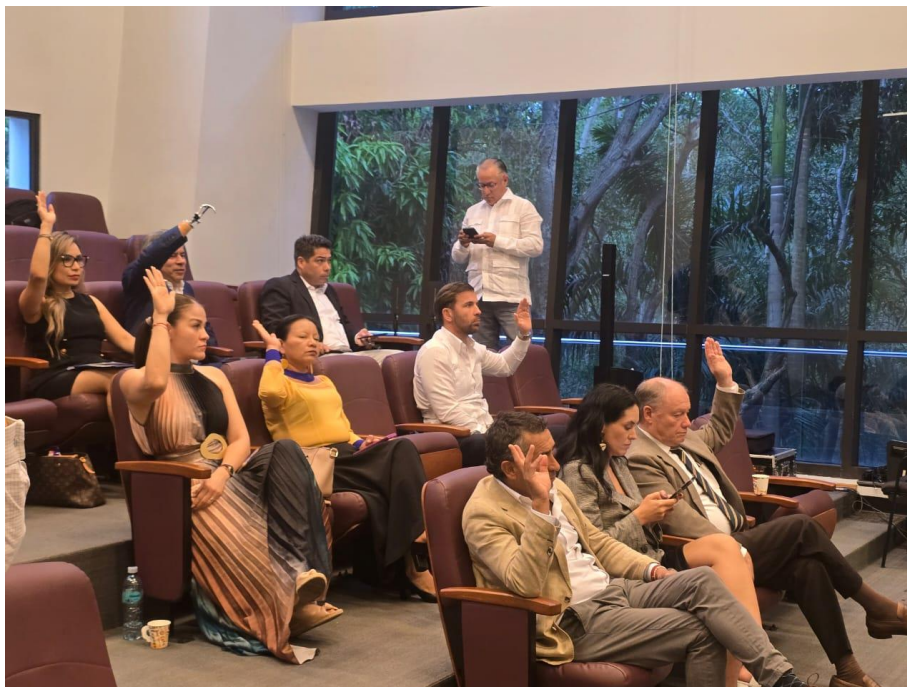
Sesión Plenaria: Votación (31/01/2025)

actualización del Marco Normativo para la Seguridad Alimentaria con calidad nutricional y respeto a las políticas de soberanía alimentaria de los Estados Miembros del Parlamento Andino.