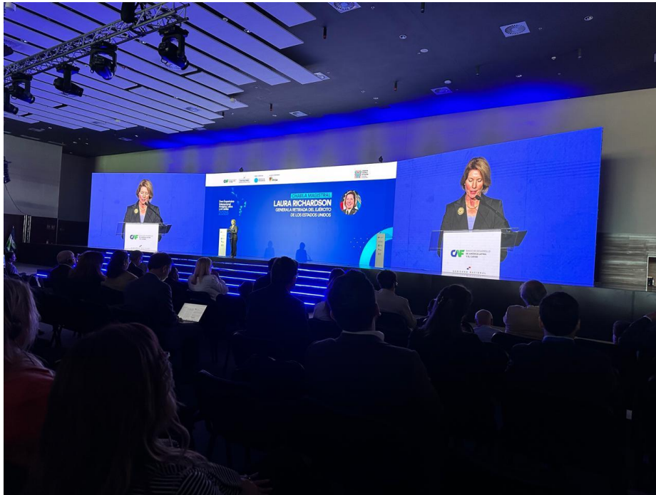
Foro Económico CAF 2025: Laura Richardson, Generala en retiro del ejército de los EEUU (30/01/2025)