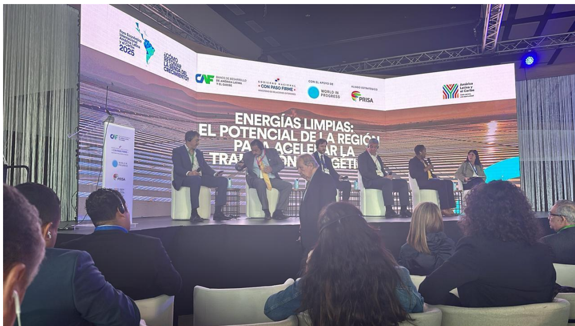
Foro Económico CAF 2025: Sesión “Energías limpias, el potencial de la región para acelerar la transición energética” (29/01/2025)