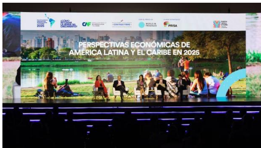
Foro Económico CAF 2025: Panel “Perspectivas económicas de América Latina y el Caribe en 2025” (29/01/2025)

En el panel se acordó que la presente conferencia no debía ser un tema coyuntural, sino que por el contrario, se trataba de una cita con el objetivo de abordar aspectos estructurales de nuestro desarrollo regional.