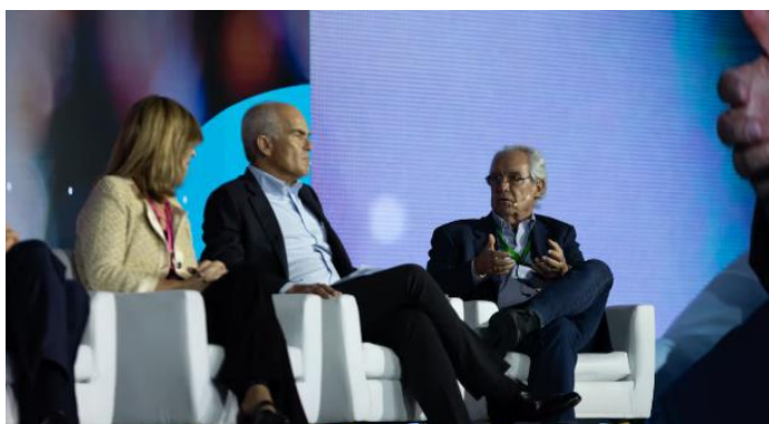
Foro Económico CAF 2025: Panel “Cómo retomar la senda de crecimiento en un escenario de coyuntura desafiante?” (29/01/2025)

-Los panelistas coincidieron en que Latinoamérica es muy grande y sus problemas están “sobre diagnosticados” , cada país es una realidad diferente, pero hay que ponernos en acción frente a la inseguridad.