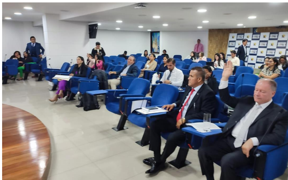
Imagen 12: Votación de los Instrumentos de pronunciamiento (01.03.2024)