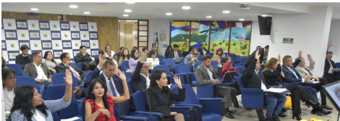
Imagen 6: Votación de la propuesta de reforma al Reglamento general del Parlamento Andino (29.02.2024).

Ambas modificaciones fueron sometidas a votación aprobándose por unanimidad.