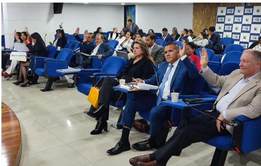
Imagen 5: Votación del informe de ejecución presupuestal de la vigencia 2023, y del proyecto del presupuesto 2024 para el Parlamento Andino (29.02.2024).

Luego de la presentación del proyecto de presupuesto anual institucional para el 2024, este fue sometido a votación aprobándose por unanimidad.