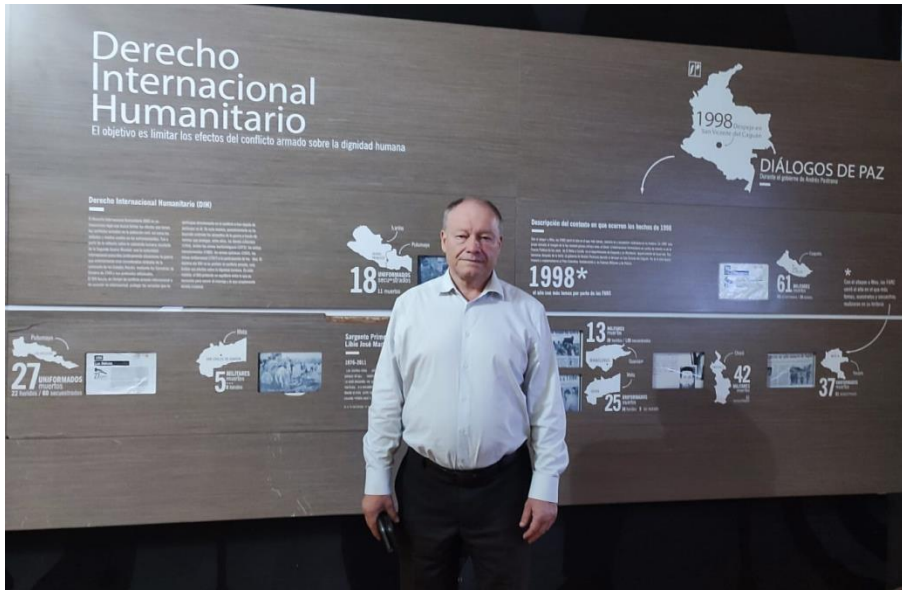
Imagen 16: Visitamos sala a “La memoria y la dignidad Sargento Primero Libio José Martínez Estrada” (02.03.2024)

En ese sentido, visitamos sala a “La memoria y la dignidad Sargento Primero Libio José Martínez Estrada”, del Museo de las Fuerzas Militares - Candelaria. En donde, por medio de plataformas y herramientas digitales, se ilustra la crudeza del conflicto armado que vivió este país, además de mostrar la narrativa de la historia de este desastroso evento y dimensionar la gravedad de la situación. Del mismo modo, este recinto expone la importancia del DIH en el conflicto armado como un mecanismo para alcanzar la paz.