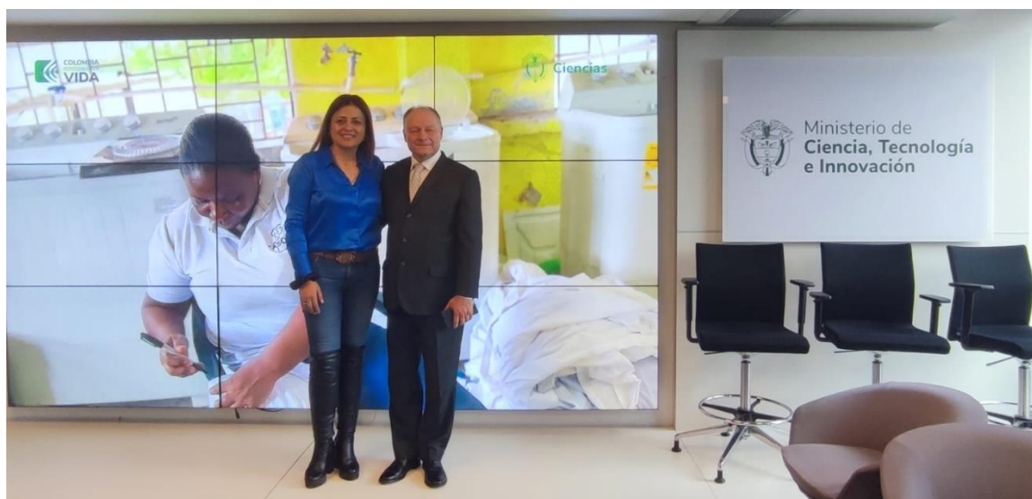
Imagen 13: Reunión con la Dirección de Desarrollo Tecnológico e Innovación del Ministerio de Ciencia, Tecnología e Innovación— Colombia (01.03.2024)

En este punto recalqué que el objetivo en común es que la aplicación de la inteligencia artificial llegue a todos nuestros territorios, que dejemos de verla con temor y más bien se entienda como un concepto que no es reservado, pero sobre el que a la vez debemos tener cuidado.