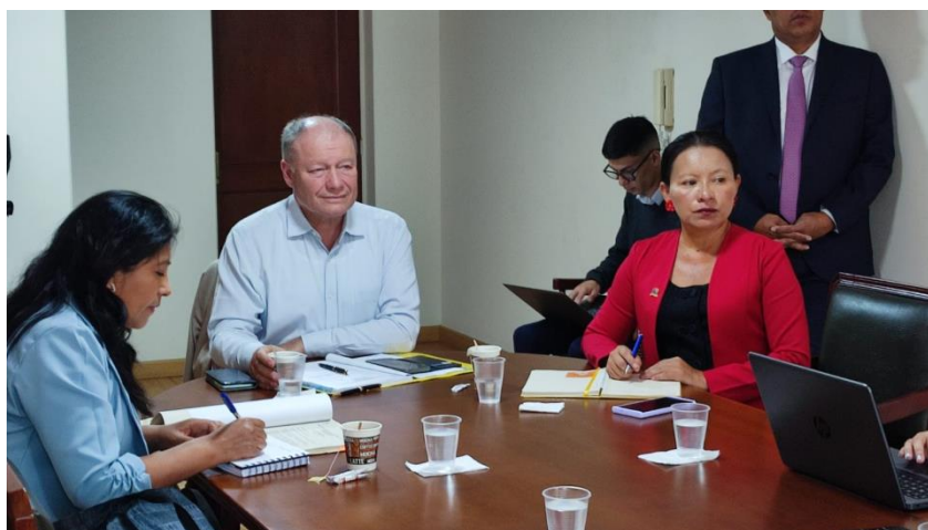
Imagen 1: Sesión de la Comisión Quinta (29.02.2024)

Tras la verificación del quórum, se dio lectura al orden del día; asimismo, se tomó conocimiento del acta anterior, la cual fue votada y aprobada por unanimidad.