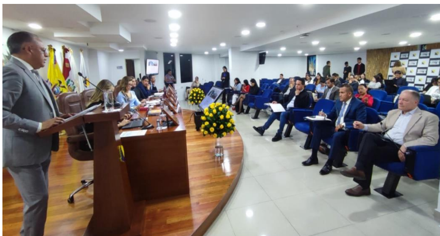
Imagen 4: Presentación del informe de ejecución presupuestal de la vigencia 2023, y del proyecto del presupuesto 2024 (29.02.2024)