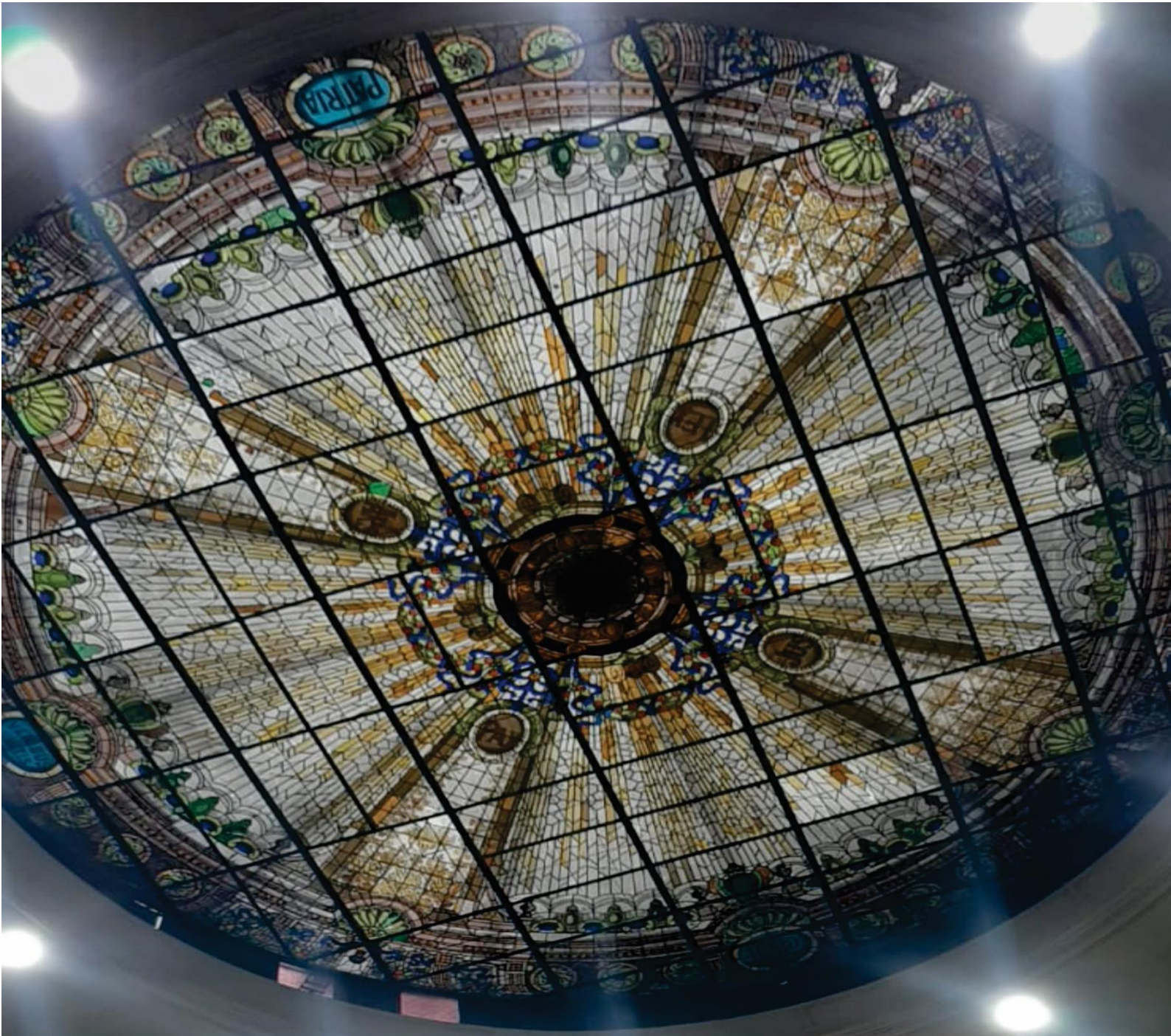
Vitral del Hemiciclo del Congreso de la República.