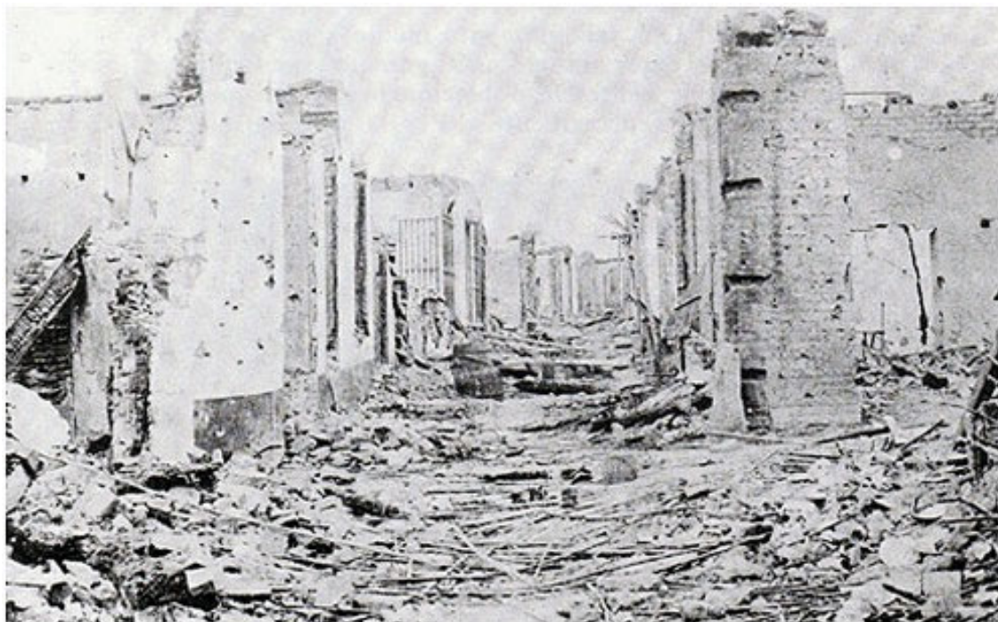
Chorrillos después de la ocupación chilena 9

San Juan y Miraflores (13-15/1/1881). Luego Piérola se trasladó a la sierra, donde convocó una Asamblea Nacional, que sesionó en Ayacucho, la que lo proclamó Presidente Provisorio (29/7/1881). La pérdida de apoyo y los pronunciamientos militares lo llevaron a dimitir en noviembre, viajando a Europa.