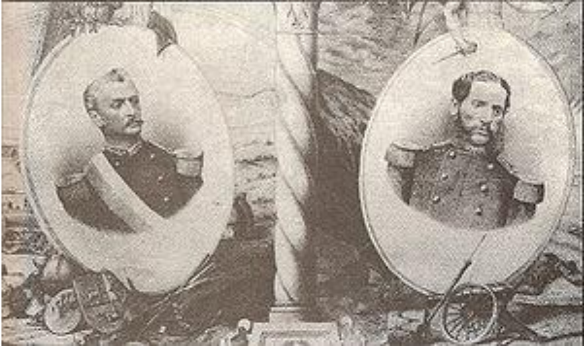
El general Miguel Iglesias y el mariscal Andrés Avelino Cáceres 20

El 27 de agosto de 1884 Cáceres atacó infructuosamente la ciudad de Lima, luego de lo cual se replegó al interior del país, donde reorganizó sus huestes. Para combatirlo Iglesias envió en su seguimiento tropas leales a su gobierno. Cáceres las atrajo a los alrededores de Jauja, dejándolas aisladas, mientras él se dirigió nuevamente a la capital. Iglesias se vio literalmente cercado y debilitado por el descontento popular contra su gobierno, lo que lo llevó a renunciar el 3 de diciembre de 1885 y partir al exilio. En la misma fecha el doctor Manuel Antonio Arenas fue nombrado Presidente del Consejo de Ministros, Ministro de Relaciones Exteriores y Encargado del Poder Ejecutivo. El 5 de diciembre promulgó un decreto que ordenó “Se relegan al olvido las disensiones políticas que desgraciadamente han pesado sobre la República hasta el establecimiento del actual gobierno”. El 6 de diciembre el gobierno convocó a elecciones generales, en las que resultó victorioso Cáceres.