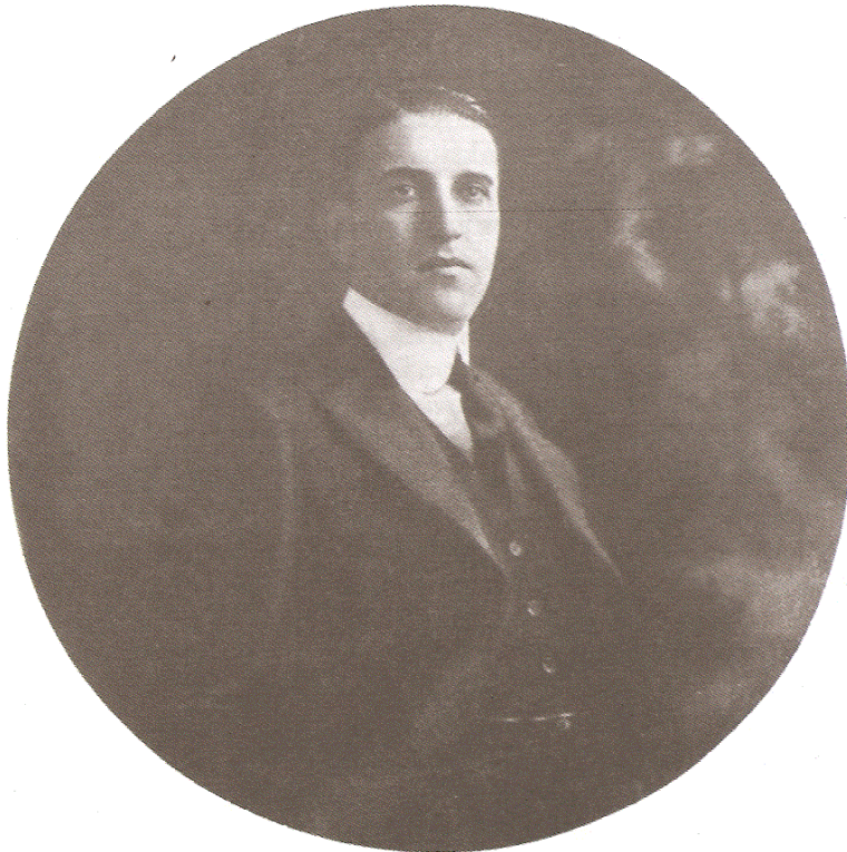
Ingeniero Héctor Boza, Primer Vicepresidente de la República (1950-1956) y Presidente de la Cámara de Senadores (1950, 1951, 1954 y 1955)

Héctor Julio Boza, fue Primer Vicepresidente de la República (1950-1956) y cuatro veces Presidente de la Cámara de Senadores (1950, 1951, 1954 y 1955). Héctor nació en Lima el 12 de diciembre de 1888. Cursó sus estudios primarios y secundarios en el Colegio José Granda y en el Instituto de Lima. Ingresó a la Escuela de Ingenieros (actual Universidad Nacional de Ingeniería). En 1907 viajó a los Estados Unidos para continuar su preparación profesional en la Escuela de Minas de Misuri, donde se graduó de bachiller en Ciencias (1911). Además, estudió ingeniería civil en la Universidad de Illinois y obtuvo el título de ingeniero de minas en la Universidad de Wisconsin (1916). Se especializó en asuntos mineros y metalúrgicos. Trabajó en diversas empresas de Estados Unidos y