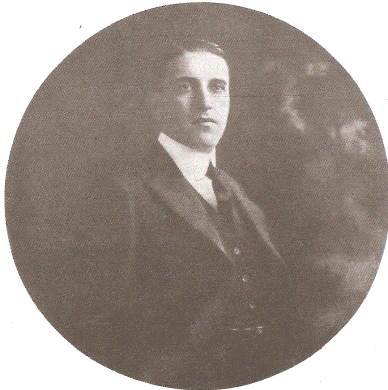
Ingeniero Héctor Boza, Primer Vicepresidente de la República (1950-1956) y Presidente de la Cámara de Senadores (1950, 1951, 1954 y 1955)

Héctor Julio Boza, fue Primer Vicepresidente de la República (1950-1956) y cuatro veces Presidente de la Cámara de Senadores (1950, 1951, 1954 y 1955). Héctor nació en Lima el 12 de diciembre de 1888. Cursó sus estudios primarios y secundarios en el Colegio José Granda y en el Instituto de Lima. Ingresó a la Escuela de Ingenieros (actual Universidad Nacional de Ingeniería). En 1907 viajó a los Estados Unidos para continuar su preparación profesional en la Escuela de Minas de Misuri, donde se graduó de bachiller en Ciencias (1911). Además, estudió ingeniería civil en la Universidad de Illinois y obtuvo el título de ingeniero de minas en la Universidad de Wisconsin (1916). Se especializó en asuntos mineros y metalúrgicos. Trabajó en diversas empresas de Estados Unidos y