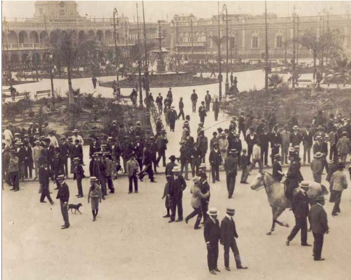
Plaza Mayor de Lima durante los sucesos del 29 de mayo de 1909