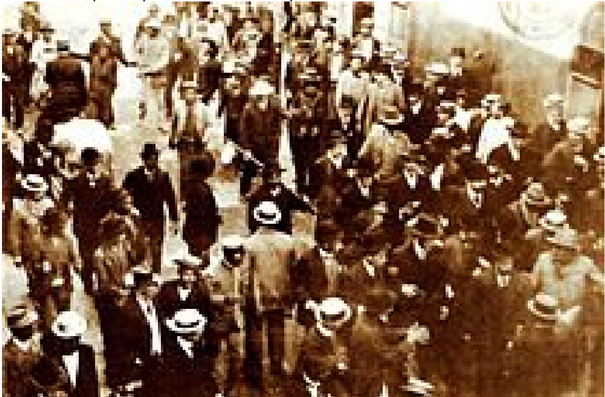
Manifestantes durante los sucesos del 29 de mayo de 1909 12

por David Flores, atacó la puerta principal, que daba a la Plaza Mayor, siendo rechazados, por lo que se unieron a los que se hallaban en la Intendencia.