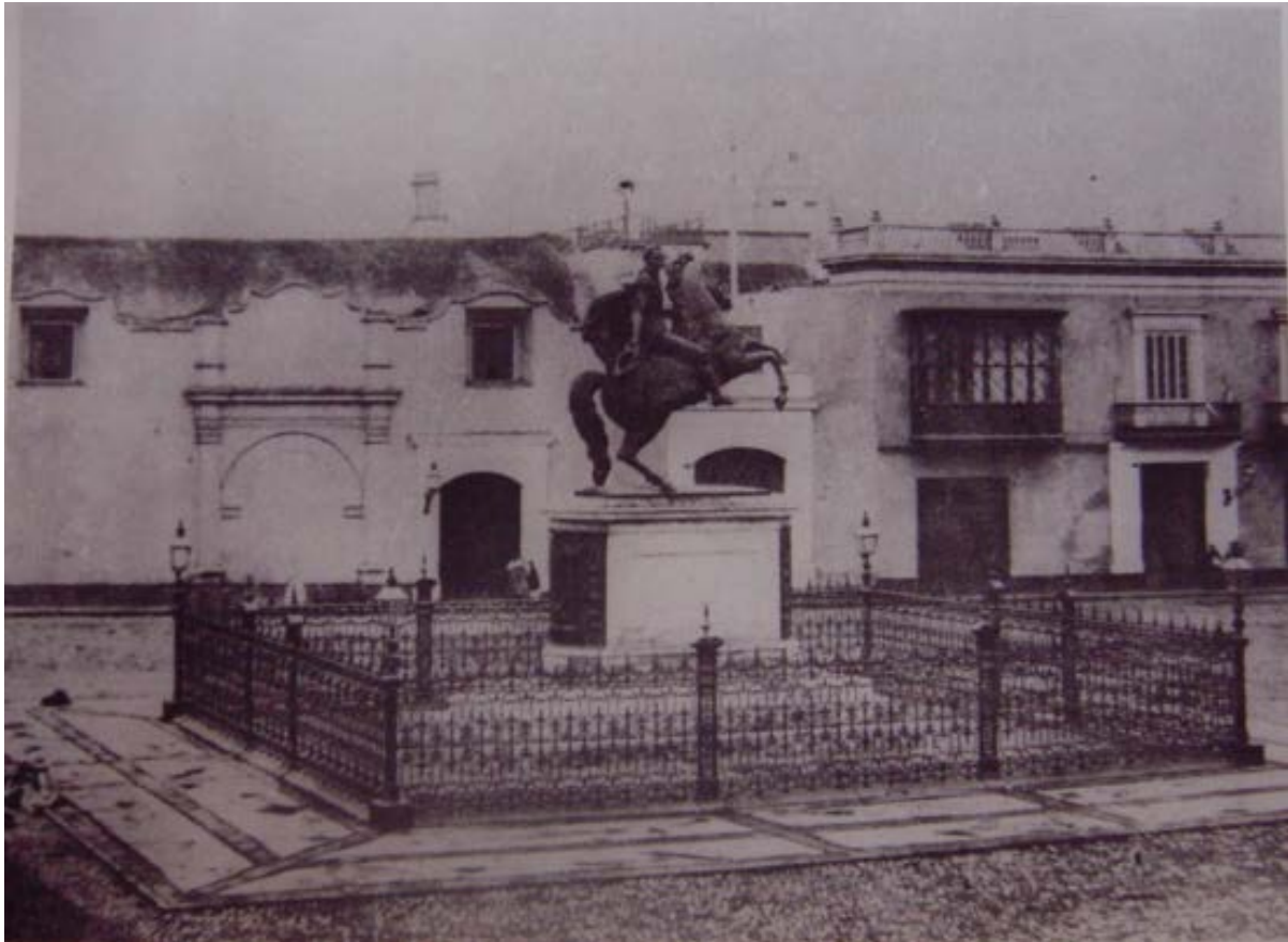
Antigo Museo Nacional (1826-1836), actual Museo del Congreso y de la Inquisición