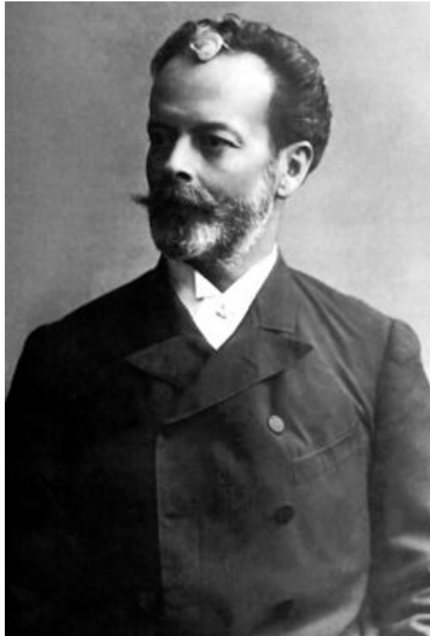
Nicolás de Piérola 8

siguieron juntos después de su muerte pues ambos fallecieron en el mismo año. El 23 de enero de 1857, don Nicolás de Piérola y Flores, «murió de fatiga en la villa de Chorrillos». Su cadáver «se exequió con Cruz alta» en la Iglesia de San Francisco de Lima y se le sepultó en el Cementerio General. Apenas le sobrevivió su esposa, doña Teresa Villena, que falleció el 19 de mayo de 1857, realizándose sus funerales el 21 en El Sagrario 7 .