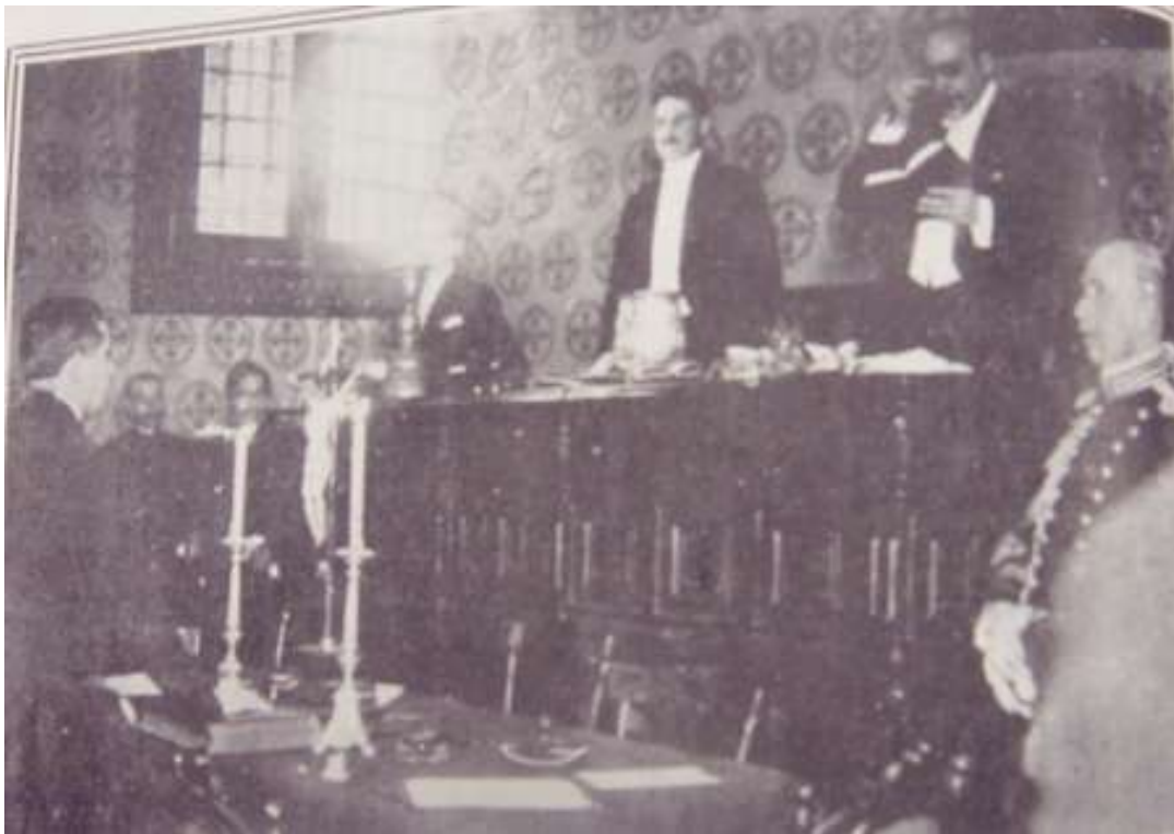
Juramentación del doctor Antonio Miró Quesada como Presidente del Senado Nacional 13

Considero importuno, innecesario e inconstitucional el plan de disolver el Congreso y de dejar expuesta a la nación, por plazo indefinido, a las vicisitudes, siempre peligrosas, de un gobierno de hecho. Juzgo, por lo mismo, de mi deber, como Presidente del Senado, invitar a los ciudadanos que hoy dirigen la República a recapacitar serenamente sobre la gravedad de la actitud que piensan asumir, sin que exista necesidad alguna fundada que pueda excusarla”.