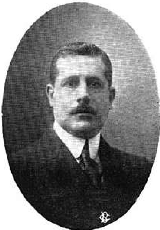
Antonio Miró Quesada de la Guerra 6

En 1905 asumió la conducción del diario El Comercio , dirigido por su padre durante tres décadas. Curiosamente él también lo dirigiría por igual tiempo. En sus páginas plasmaría en tinta y papel millares de artículos que desarrollaron sus ideas sobre la realidad nacional e internacional.