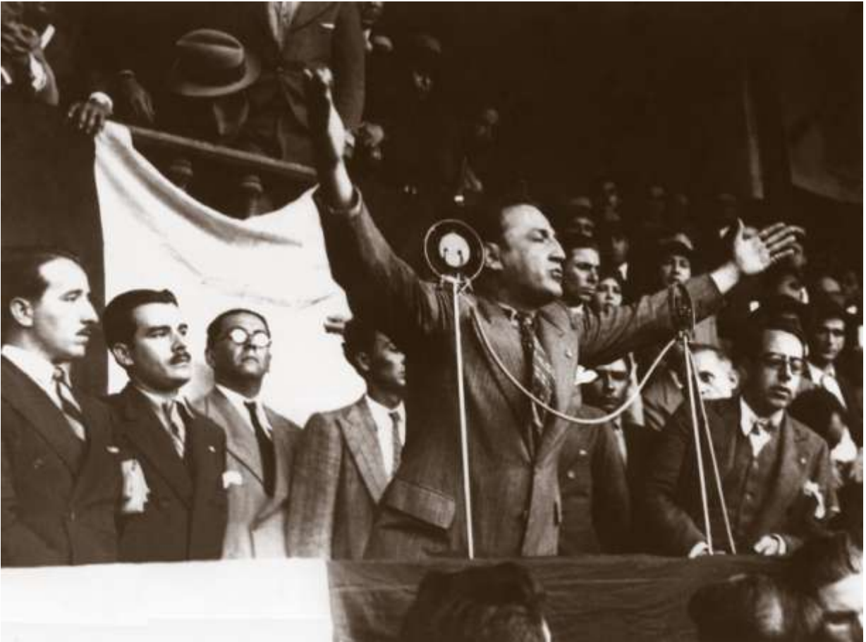
Víctor Raúl Haya de la Torre

En la misma fecha, en Trujillo, Víctor Raúl Haya de la Torre anunciaba el inicio de una nueva época dolorosa que debía llevar al Partido Aprista al poder: