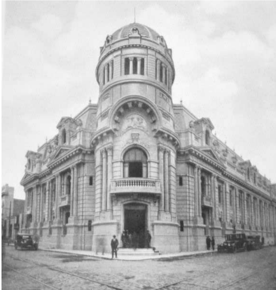
Local del diario El Comercio 3

Antonio Miró Quesada se inició en las actividades políticas como regidor de la Municipalidad de Lima. En 1901, integrando las listas del Partido Civil, fue elegido Diputado por el Callao, cargo para el que fue reelegido (1907):