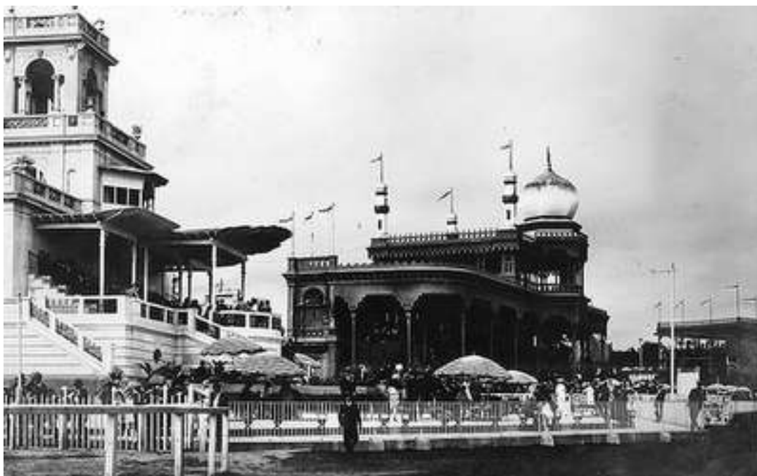
Hipódromo de Santa Beatriz (actual Campo de Marte)

El 6 de mayo Haya de la Torre fue apresado y conducido a la Prefectura y luego al Panóptico. La acción revolucionaria del APRA contra el régimen de Sánchez Cerro continuó con numerosas revueltas y hechos de armas, tales como: la rebelión de los marineros, el 7 de mayo de 1932; la revolución de Trujillo, el 7 de julio de 1932; la de Huaraz, el 13 de julio de 1932; las revoluciones de Cajamarca, el 13 de julio de 1932 y el 11 de marzo de 1933, entre otras. En estas acciones se produjeron numerosas muertes y cuantiosos daños materiales.