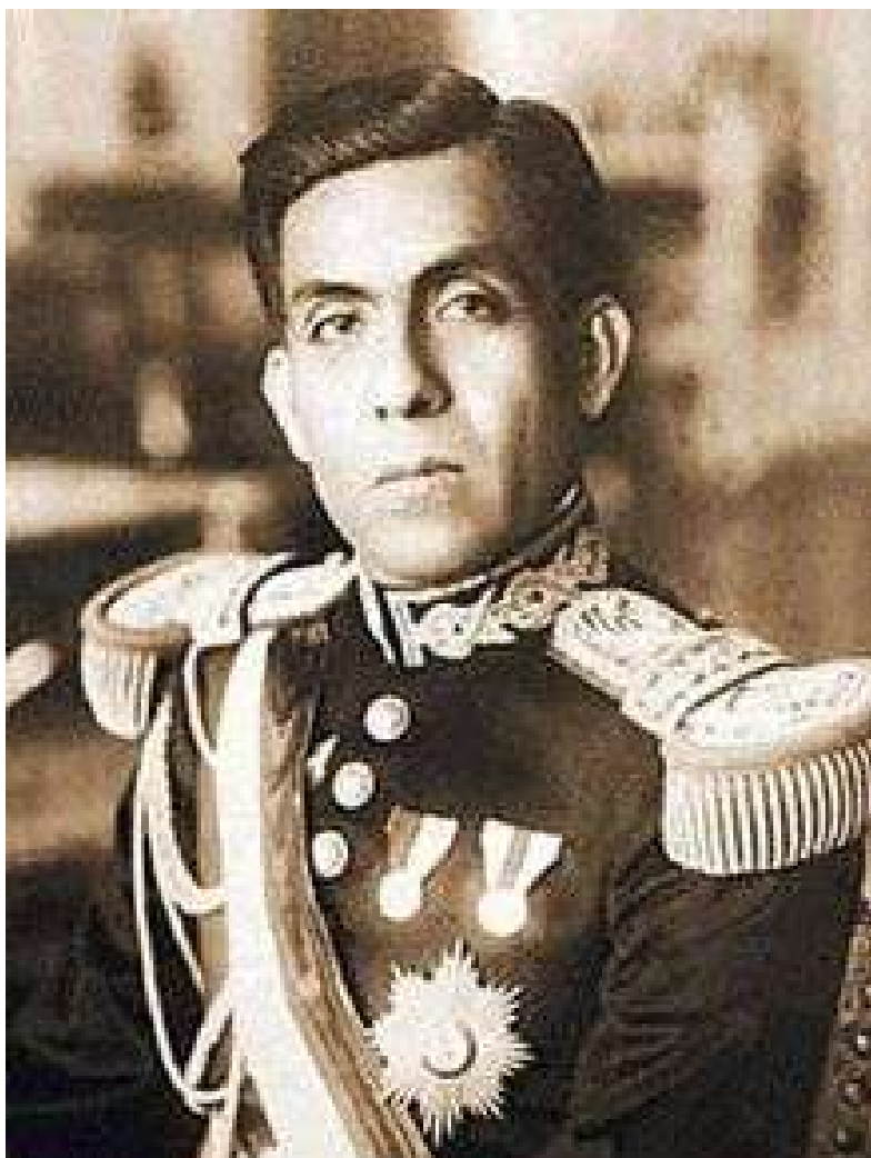
Luis Miguel Sánchez Cerro, Presidente de la República (1931-1933)

...“El complot «comunista» ha sido un bluf de Leguía y el mercenario Miró Quesada, agentes del imperialismo yanqui. La persecución ha sido dirigida contra el APRA 16 ” ...