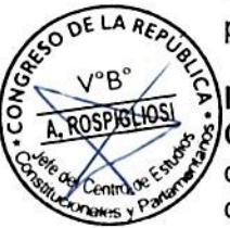
María del Carmen Alva Prieto Presidenta Congreso de la República