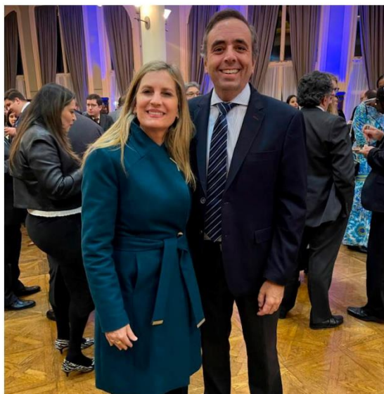
La vicepresidenta de República Oriental del Uruguay y presidenta de la Asamblea General de Uruguay, Beatriz Argimón, la presidenta del PARLATINO, Silvia Giacoppo y el presidente de la Cámara de Diputados, Sebastián Andújar

Ahora bien, la apertura oficial de la Segunda Cumbre Mundial de las Comisiones de Futuro, tuvo lugar el 25 de septiembre en la Cámara de Representantes del Palacio Legislativo de Uruguay. En este evento, se enfatizó el papel fundamental de los Parlamentos en la configuración del porvenir en un mundo dinámico y de rápida evolución. Se contó con la participación de importantes figuras como el presidente de la República Oriental del Uruguay, don Luis Lacalle Pou, la presidenta de la Asamblea General de Uruguay, doña Beatriz Argimón, el presidente de la Cámara de Diputados de Uruguay, don Sebastián Andújar, y Duarte Pacheco, quien preside la Unión Interparlamentaria – UIP.