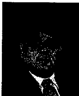
Freddy Sarmiento Betancourt Presidente Partido Fuerza Popular