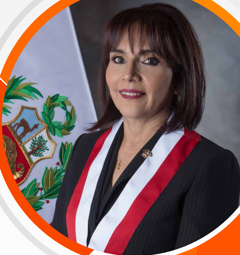
Carmen Patricia Juárez Gallegos Congresista de la República