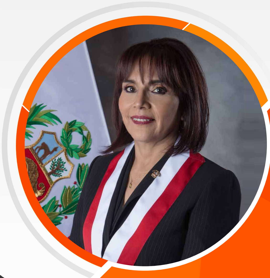
Carmen Patricia Juárez Gallegos Congresista de la República