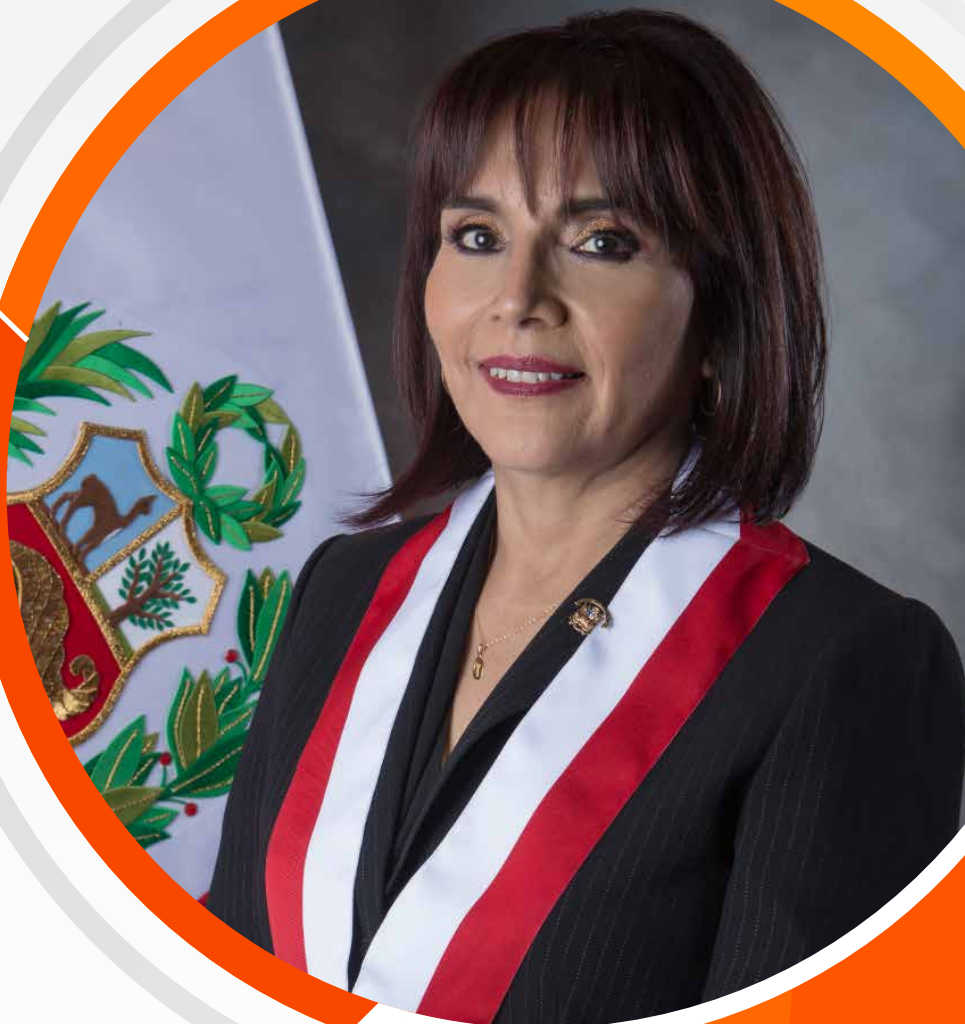
Carmen Patricia Juárez Gallegos Congresista de la República