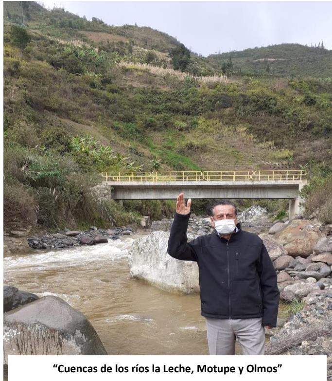
"Cuencas de los ríos la Leche, Motupe y Olmos"

Dentro de la semana de representación el congresista visitó las cabeceras de cuenca de los ríos La Leche, Motupe y Olmos, ingresando por la carretera que conduce al distrito de Incahuasi, pasando por Uyurpampa, Maryhuaca, cruce Totoras, Atunloma, Mamagpampa, llegando hasta la ciudad de Cañaris y saliendo o regresando por la carretera que conduce a la provincia de Jaén.