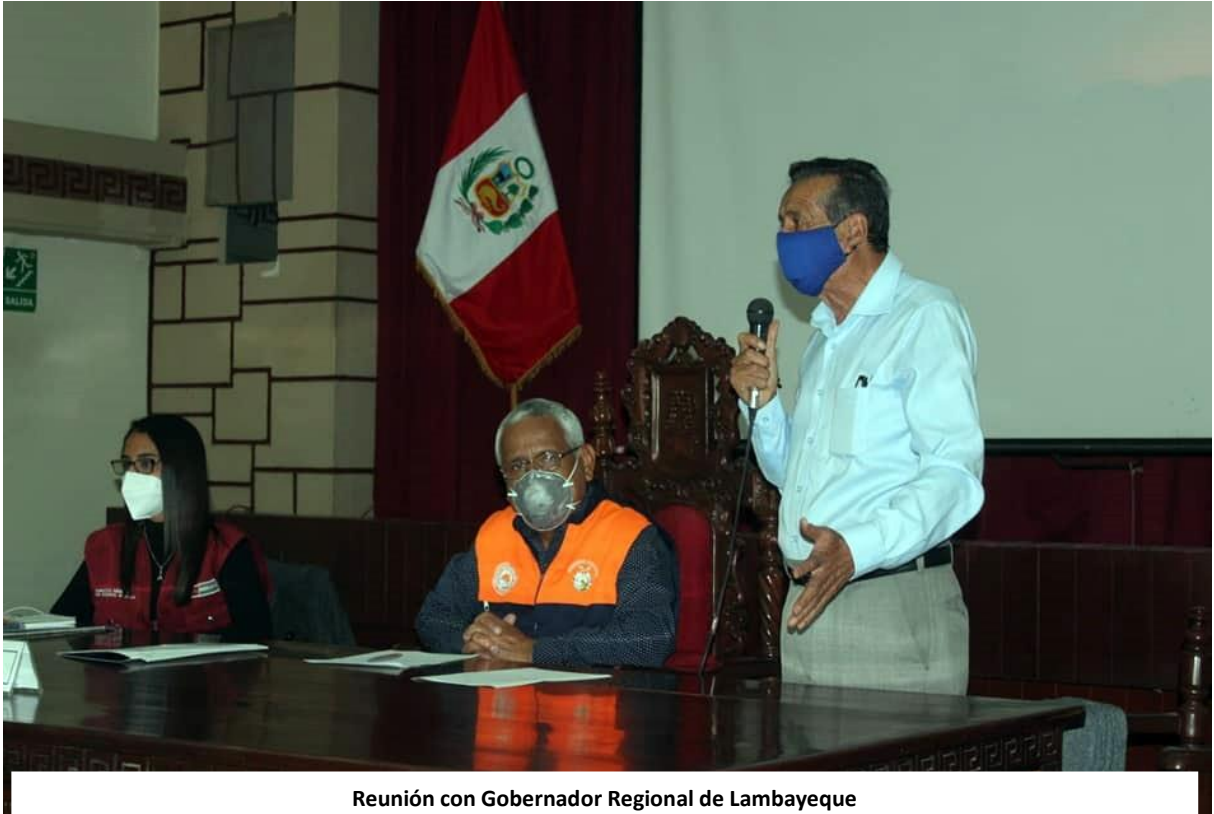
Reunión con Gobernador Regional de Lambayeque