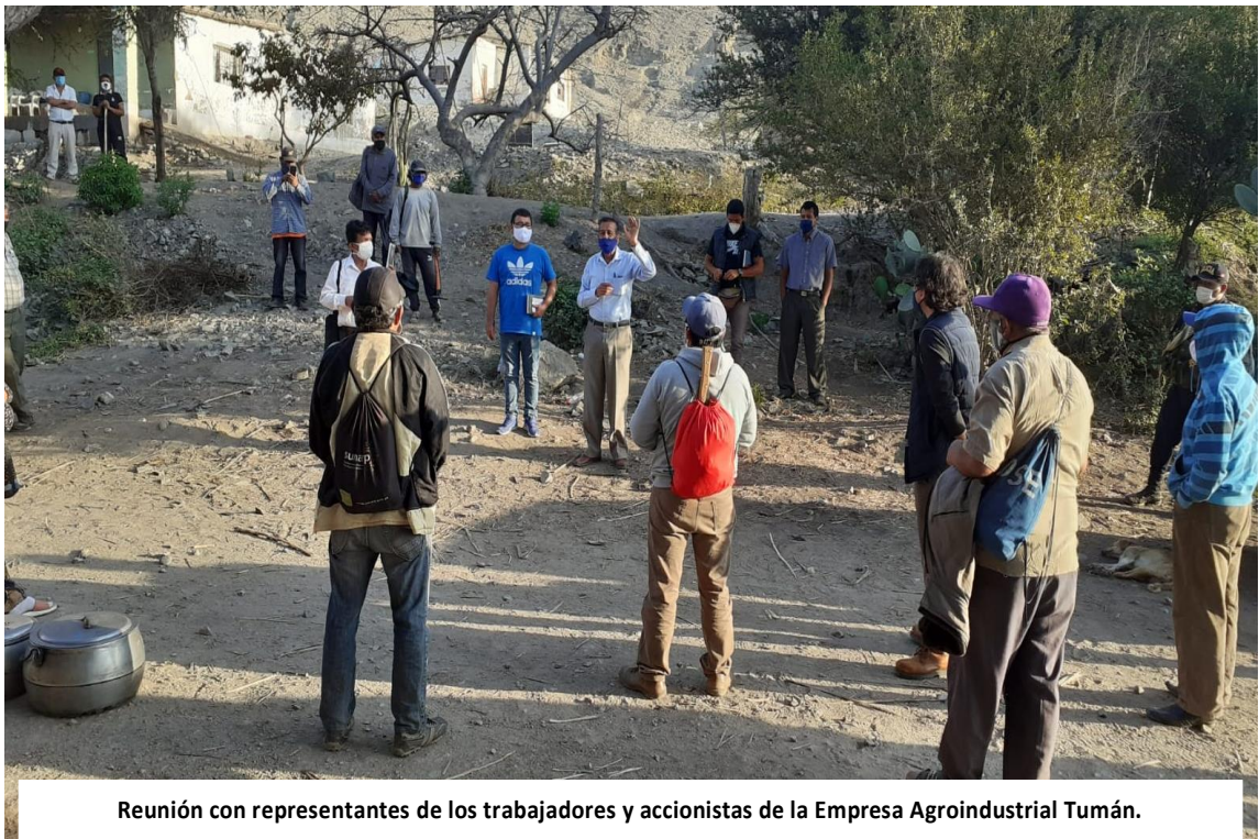
Reunión con representantes de los trabajadores y accionistas de la Empresa Agroindustrial Tumán.