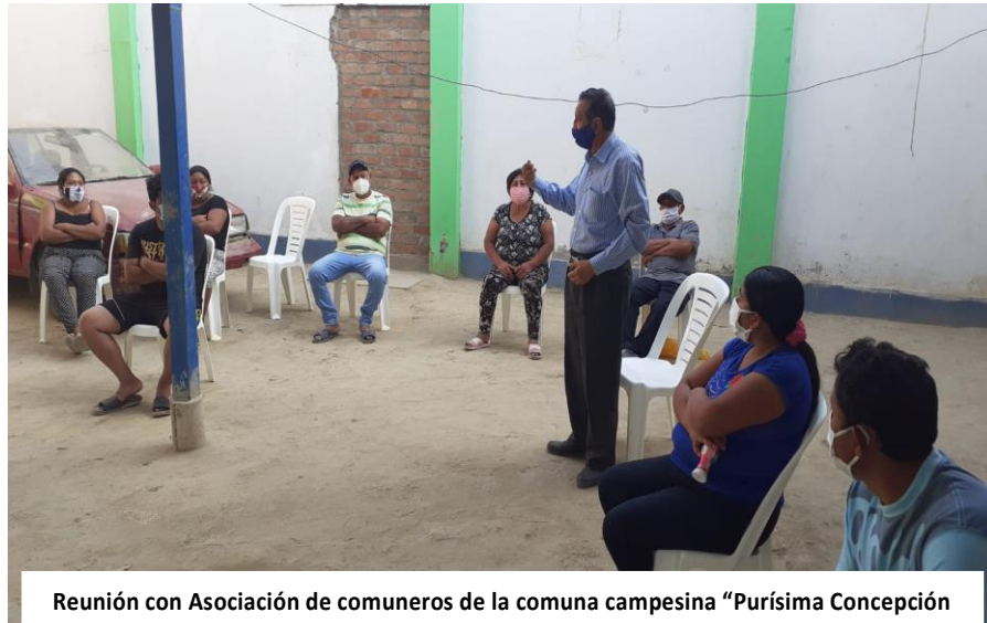
Reunión con Asociación de comuneros de la comuna campesina "Purísima Concepción de Jayanca"