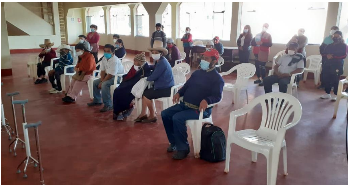
Entrega de sillas de ruedas, bastones y andadores en la Municipalidad Provincial de Chota