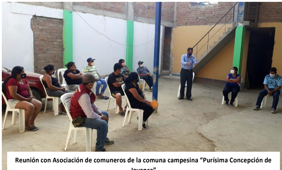
Reunión con Asociación de comuneros de la comuna campesina "Purísima Concepción de Jayanca"