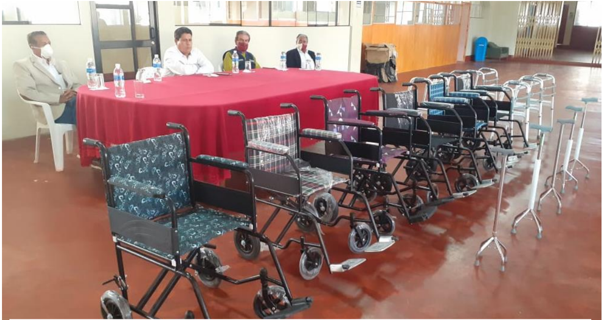
Entrega de sillas de ruedas, bastones y andadores en la Municipalidad Provincial de Chota