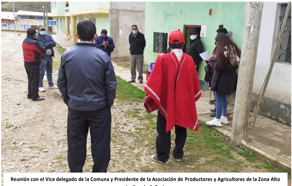
Reunión con el Vice delegado de la Comuna y Presidente de la Asociación de Productores y Agricultores de la Zona Alto Andina de Cañarís

Se conversó con el presidente de la Asociación de Productores y Agricultores de la Zona Alto Andina de Cañarís, con quien se abordó sobre la intensificación y mejora de las vías de ingreso a la comuna y evaluar la viabilidad de declarar con carácter de urgencia la construcción de carreteras en la zona, gestionar la creación de un puesto de Salud en la comunidad, gestionar la mejora en el uso del recurso hídrico, vital para la agricultura y ganadería de la comunidad, gestionar la creación de canales de irrigación, utilizando la mano de obra de la comuna a fin de generar trabajo a los pobladores y sobre la creación de canales de irrigación, asimismo se recepciono un pedido para gestionar la construcción de un canal de irrigación que nace en la corriente Ojo de Agua, del rio Lindero (delimitación natural entre Incahuasi y Cañarís), que permitirá irrigar 150 hectáreas de producción agrícola y pastizales.