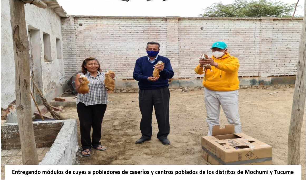
Entregando módulos de cuyes a pobladores de caseríos y centros poblados de los distritos de Mochumi y Tucume