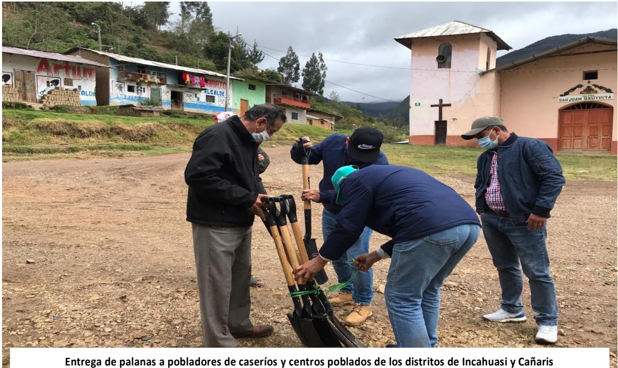
Entrega de palanas a pobladores de caseríos y centros poblados de los distritos de Incahuasi y Cañaris

El congresista Rolando Campos Villalobos en el marco de su semana de representación, el día 23 de setiembre realizó la entrega de palanas a los pobladores de los caseríos de los distritos de Incahuasi y Cañaris.