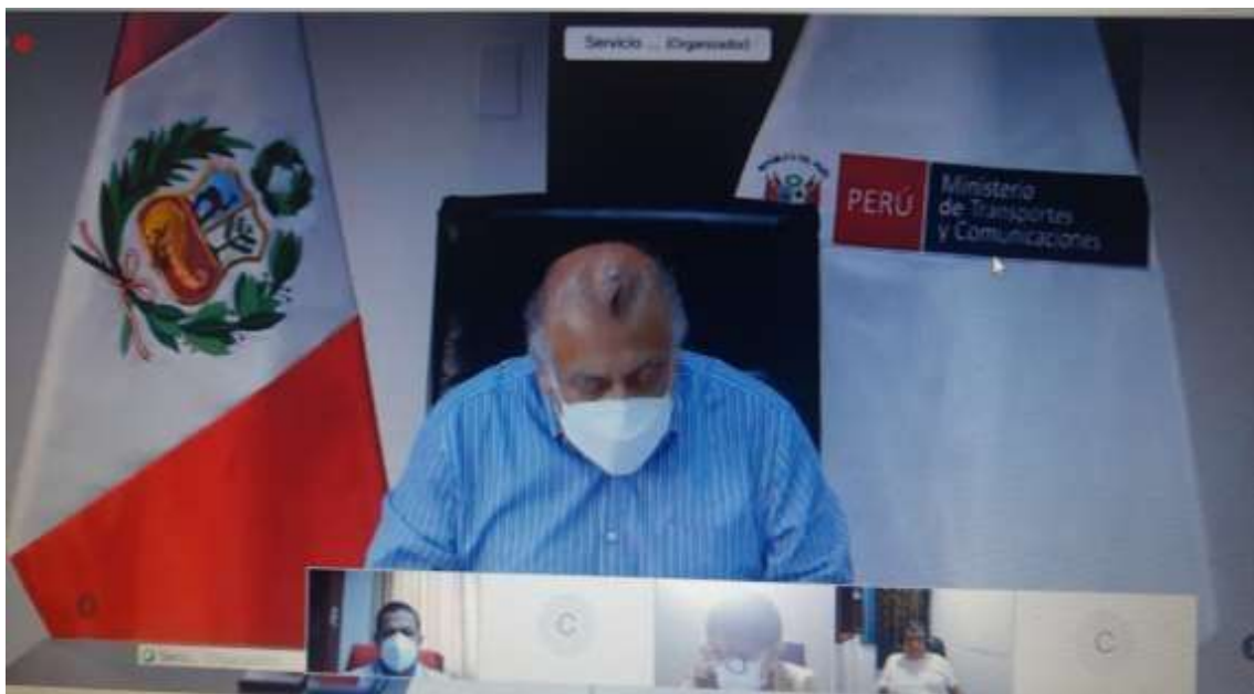
Reunión Virtual con el Ministro de Transportes, Gobernador Regional y congresistas de la Región Lambayeque.

De igual manera, señaló que la ejecución de la obra del aeropuerto de Chiclayo se viene ejecutando en primera y segunda fase dado que se viene elaborando el expediente para la ampliación y modernización que la convertirá en uno de los aeropuertos más importantes del norte del país. Finalmente, manifestó que existen varios proyectos de puentes en ejecución para este año 2021, comprometiéndose a alcanzar el listado de proyectos de la región Lambayeque.