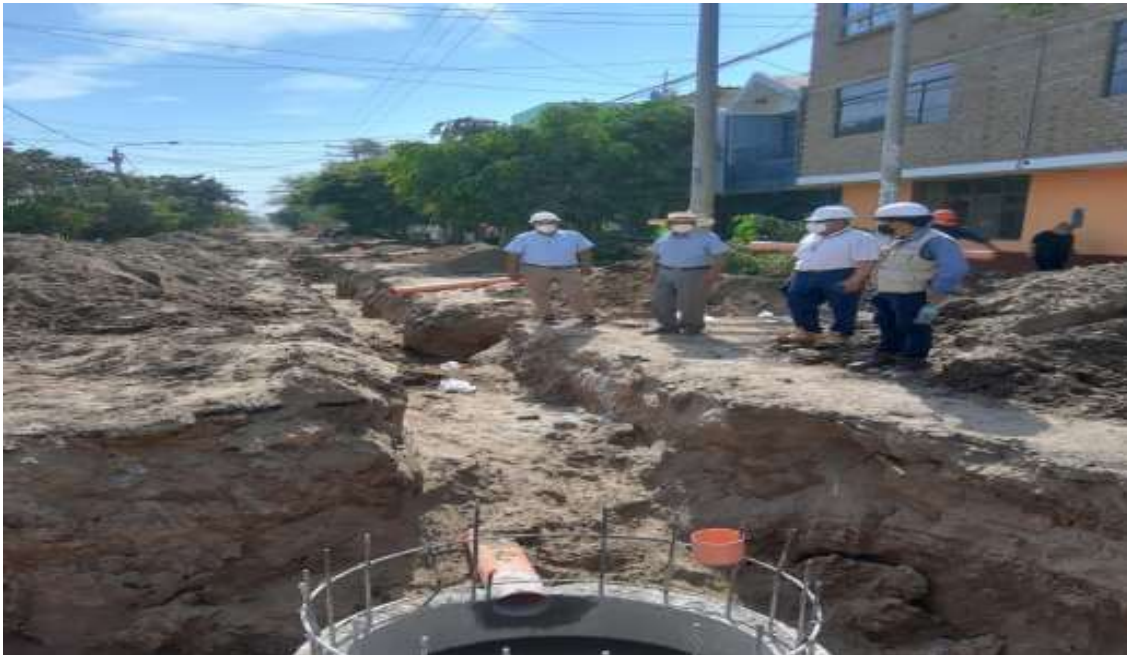
Recorrido por la Obra “Mejoramiento del Servicio de Agua Potable y Alcantarillado en la Calles del Pueblo Joven Santa Rosa del distrito de Lambayeque”

El parlamentario recorrió el Pueblo Joven Santa Rosa para supervisar el avance la obra de Saneamiento del Pueblo Joven Santa Rosa. Esta obra tiene un plazo de ejecución de 180 días calendario, con una inversión de S/.6,441,465.25 nuevos soles y está a cargo de la Autoridad para la Reconstrucción con Cambios (ARCC).