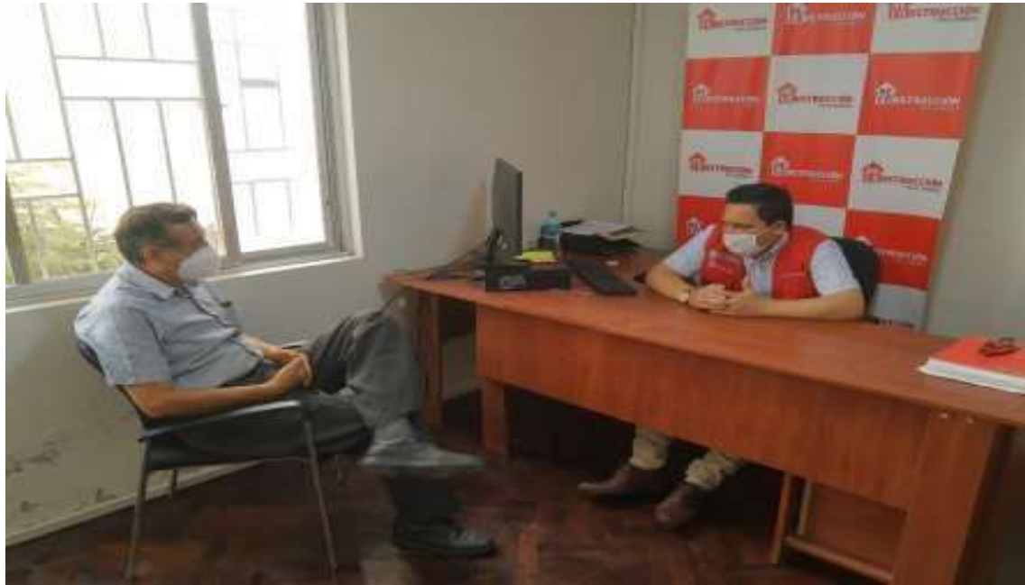
Reunión con el Jefe Regional de la Autoridad de Reconstrucción Con Cambios – Lambayeque.