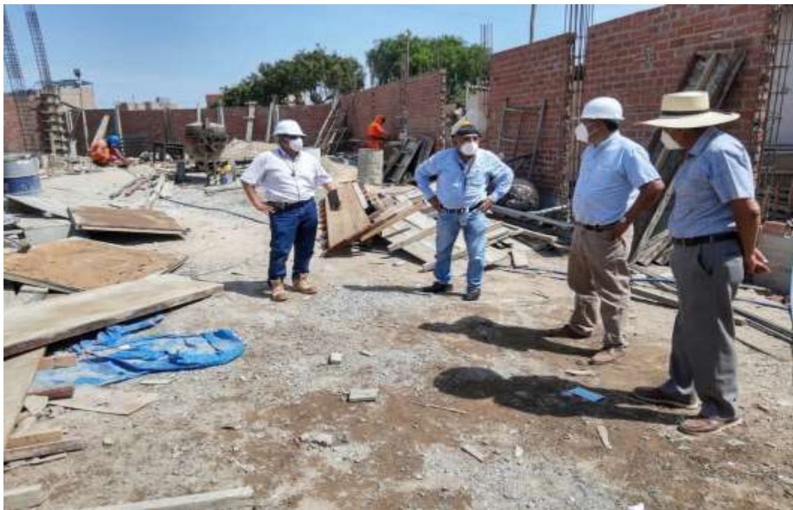
Supervisión a la obra “Mejoramiento del Servicio de Educación Inicial en la I.E N°474- La Tina del distrito de Lambayeque.

La obra “Mejoramiento del Servicio de Educación Inicial en la I.E N°474- La Tina del distrito de Lambayeque, provincia de Lambayeque”, con código CUI 2459073. Tiene un plazo de ejecución de 150 días calendario y está a cargo de la Autoridad para la Reconstrucción con Cambios (ARCC) con una inversión de S/.1'932,328.20 nuevos soles. Esta obra permitirá mejorar las condiciones básicas del servicio educativo a niños y niñas del nivel inicial.