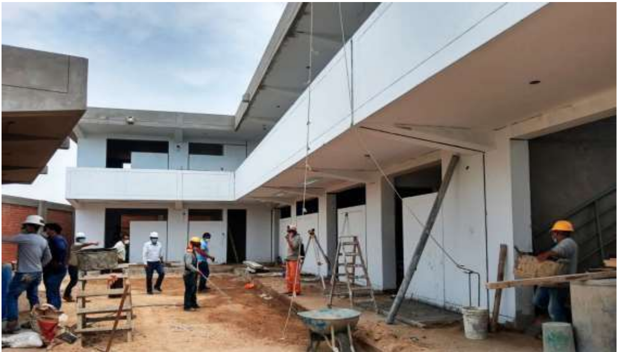
Recorrido por la obra de la I.E. N°10136-Maravillas - distrito de Mochumi

El parlamentario el día 26 también realizó una visita a la I.E 10136 - Maravillas, el cual se encuentra en proceso de reconstrucción, esta obra tiene como finalidad atender adecuadamente a la población estudiantil con la prestación de servicios educativos , explicado por limitados recursos con los que se cuenta actualmente; así como, los cambios de procedimientos y la construcción de infraestructura que permita satisfacer las necesidades de los estudiantes contando con las condiciones normativas y confort para una seguridad comprometida con el desarrollo y una mejora de los niveles de educación de la población del área de influencia directa del distrito de Mochumí, de la provincia de Lambayeque, región Lambayeque, planteando la construcción de una nueva infraestructura.