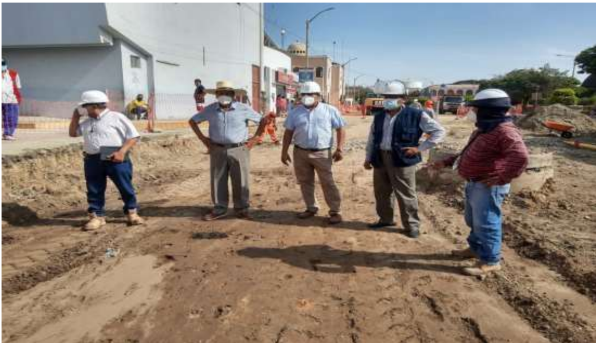
Supervisión de la obra "Reparación de pistas y veredas en la avenida Huamachuco de Lambayeque.

Asimismo, el parlamentario el día 24 de febrero realizó una visita a los avances la obra de "Reparación de pistas y veredas en la avenida Huamachuco de Lambayeque, con la incorporación del plan de vigilancia, prevención y control del Covid 19", con código CUI 2455025, la cual tiene un presupuesto de inversión que asciende a la suma de 4 millones 356 mil soles, con un plazo de ejecución de 120 días calendarios, y será ejecutada por el "Consortio Vial Huamachuco" y supervisado por el "Consortio S&M Consultores". La reconstrucción de esta importante vía de la "Ciudad Evocadora", no solo permitirá mayor transitabilidad para los habitantes y turistas que frecuentan la ciudad de Lambayeque, si no también contribuirá al embellecimiento de la zona y en consecuencia un mejor panorama para nuestros visitantes.