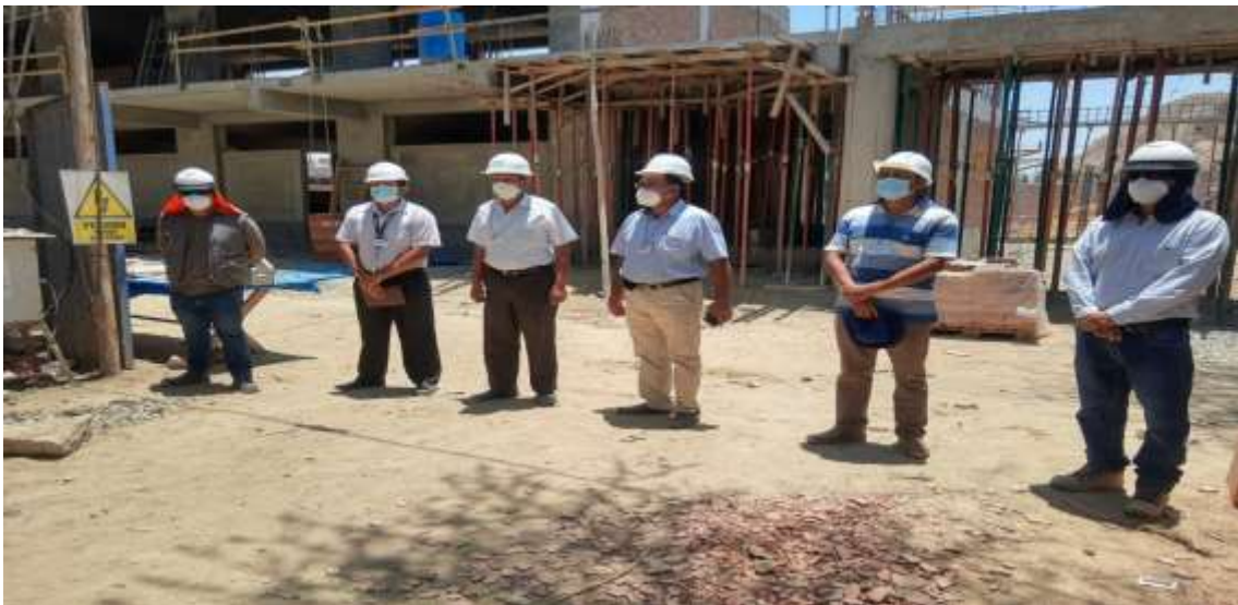
Visita la I.E N°10225- Sagrado Corazón de Jesús, distrito de Túcume, provincia de Lambayeque, departamento de Lambayeque.

El parlamentario el día 26 también realizó un recorrido por el distrito de Túcume, donde junto al alcalde y autoridad de ARCC visitaron la I.E N°10225- Sagrado Corazón de Jesús, distrito de Túcume, provincia de Lambayeque, departamento de Lambayeque, esta I.E se encuentra en un proceso de Rehabilitación de la infraestructura para el servicio de educación primaria con código CUI 2469866, con una inversión de S/.7,753,226.08 nuevos soles, que fueron gestionados por la Autoridad para la Reconstrucción con Cambios (ARCC); la reconstrucción de esta I.E permitirá mejorar el servicio educativo que reciben los niños de este distrito, con una nueva infraestructura.