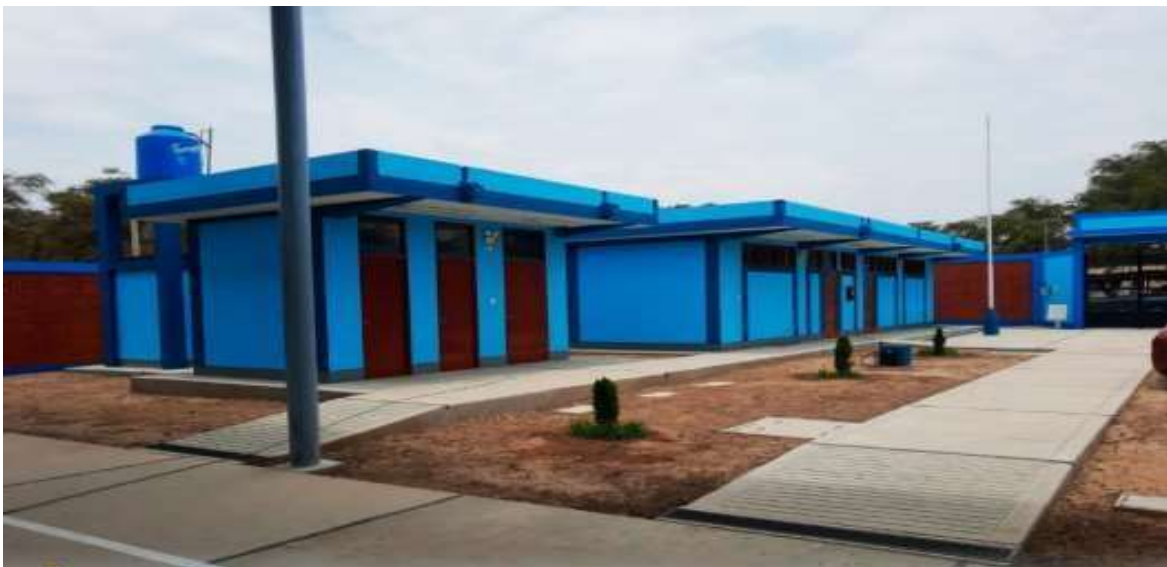
Recorrido por la obra de reconstrucción de las I.E. N° 10137 en Mochumí caserío La Pava.