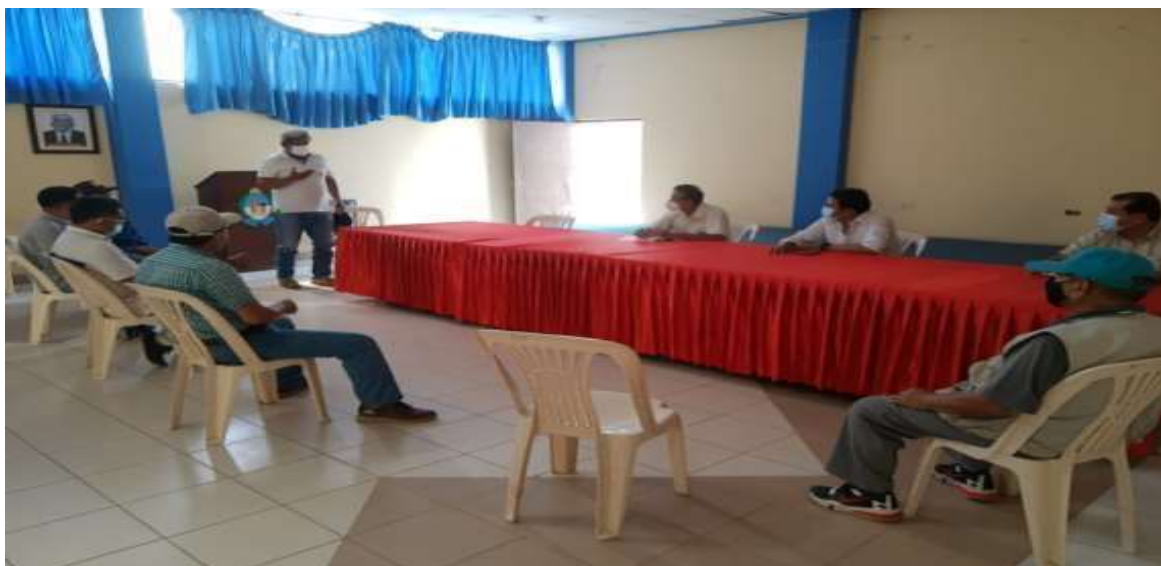
Reunión con el alcalde de la Municipalidad Distrital de Mochumi