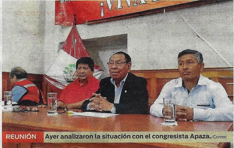
REUNIÓN Ayer analizaron la situación con el congresista Apaza.

Además que, de los trabajadores que sí están laborando, la