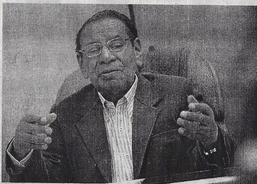
● JUSTINIANO APAZA, congresista.

"El SIT es una réplica del modelo Transmilenio mal adecuada a la realidad de Arequipa. Está formulado como monopolio y hasta ahora no se conoce el valor del pasaje, su base de datos está desactualizada (data del 2005) y con serios errores. No tiene soporte ni seguridad financiera, tiene muchas observaciones en el diseño de la infraestructura, de la cual en 10 años solo se ha ejecutado menos del 20% de aproximadamente 700 millones de presupuesto", en-