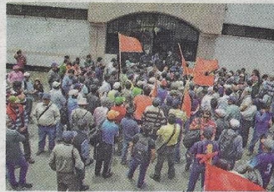
Obreros de la región se encuentran desempleados.