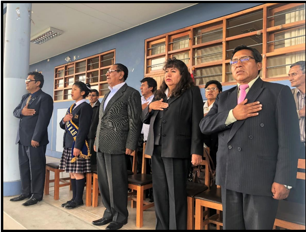
Computadoras e instrumentos para la banda de música del colegio Víctor Andrés Belaúnde fueron entregados por el congresista Justiniano Apaza