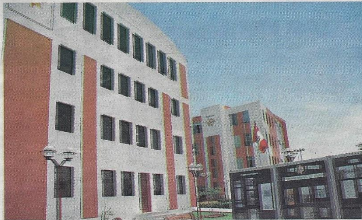
Presupuesto para Gobierno Regional de Arequipa se incrementó solo en 1% con respecto al 2018.

Ante tal situación, el congresista Justiniano Apaza cuestionó que el gobierno del presidente Martín Vizcarra, a través del MEF, no destine los 230 millones de soles adicionales que solicitó la gobernadora Yamila