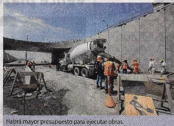
Habrà mayor presupuesto para ejecutar obras.

"Si su capacidad de ejecución de la actual gestión no permitió un gasto aceptable, entonces en los ministerios evaluarán dar las siguientes transferencias. En este momento, el PIA solo es un