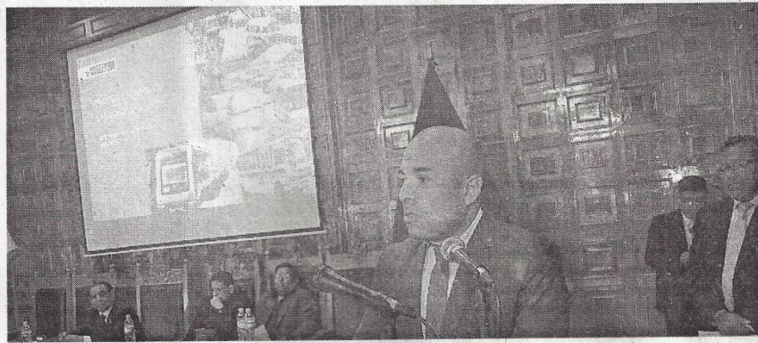
● EN AUDIENCIA pública realizada en el Paraninfo hablaron sobre ventajas del SIT.