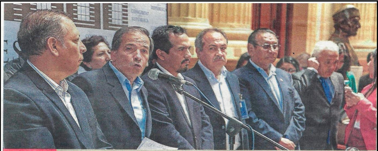
ALINEADOS Arana y su bancada sustentaron pedido que complica a Kuczynski.

EL FRENTE AMPLIO Y NUEVO PERÚ FORMALIZAN SOLICITUDES