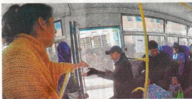
Hasta el 2020 el pasaje costará S/ 1, según técnicos del SIT y MPA.