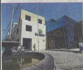
Suspense en Sedapar