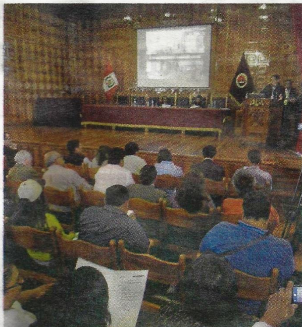
Próxima audiencia no debe pasar de enero.

MALESTAR. Afuera del Parainfo, un grupo de transportistas protestó por la implemen-