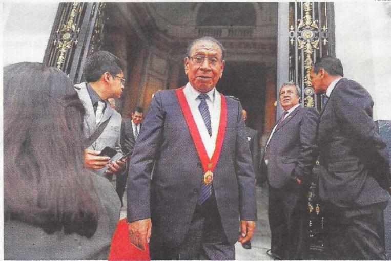
■ HABLO FUERTE. Parlamentario sostiene que no se sabe ni el costo del pasaje que se cobrará.

“No nos aclararon cómo será el funcionamiento de las vías troncales, no se nos informó cuándo estará la infraestructura vial. Se dice que el pasaje sería de un sol en la etapa