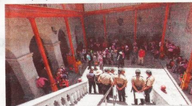
Hubo falta de espacio en el Paraninfo. Pobladores no ingresaron.