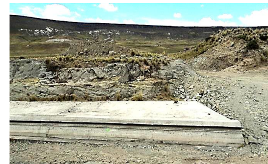
Vista de Plinto en zona donde se unirá con Vertedero