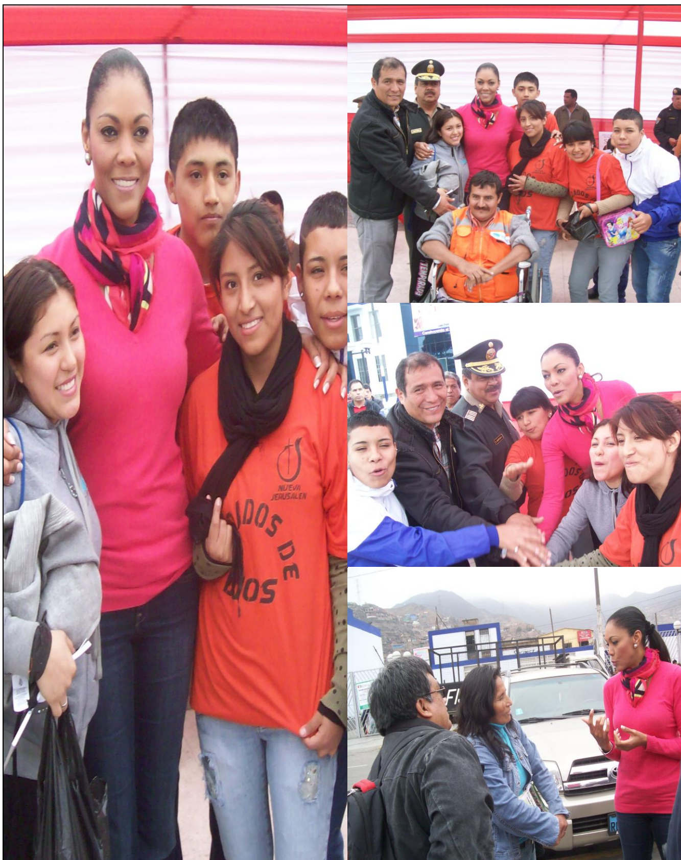
La Congressista Cenaida Uribe compartiendo gratos momentos con los pobladores del distrito de Independencia.