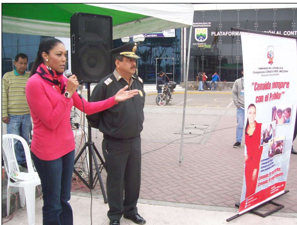
La Congresista Cenaida Uribe saluda a los vecinos del distrito de Independencia que han asistido al Despacho Descentralizado.