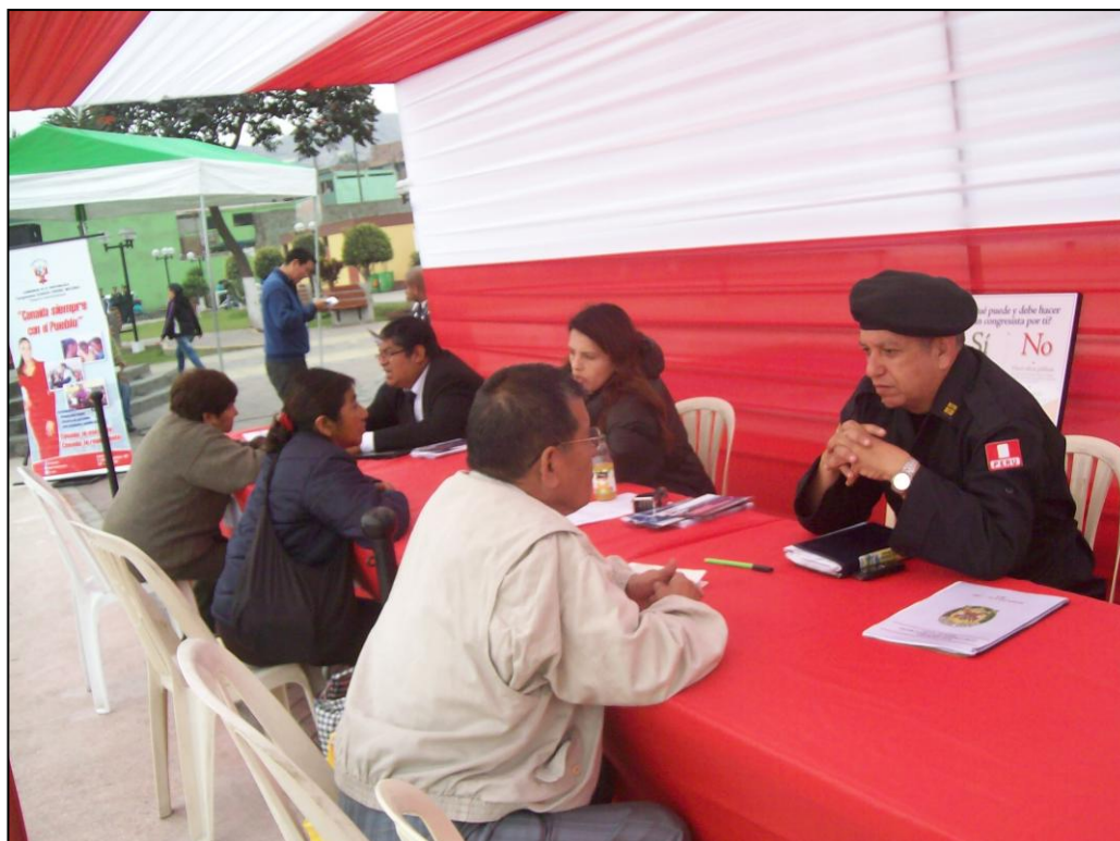
Los asesores de la Congresista Cenaida Uribe, brindando asesoría legal y asesoría de gestión ante entidades públicas. Además se contó con el apoyo de la Comisaría de Independencia que brindo asesoría en temas de Seguridad Ciudadana.