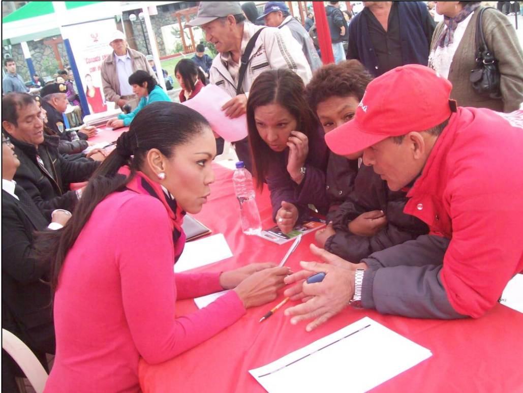
La Congressista Cenaida Uribe escuchando las demandas de los pobladores.