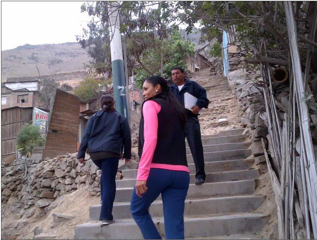
La Congresista Cenaida Uribe, visitando una AA.HH. en el eje zonal de Independencia.