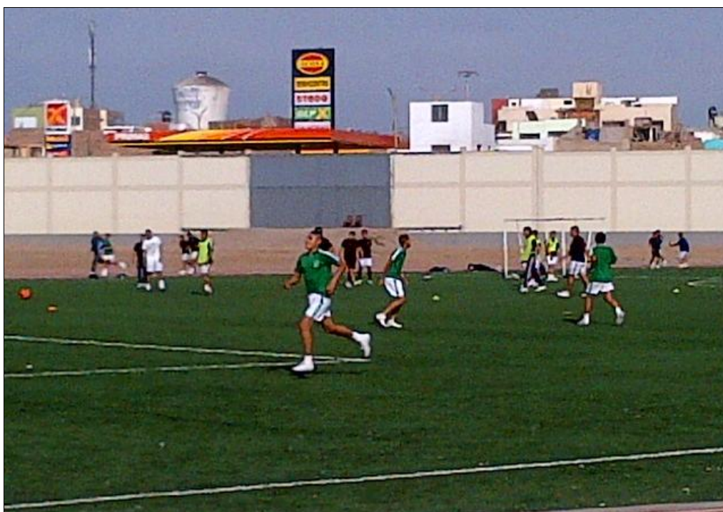
El estadio se encuentra en perfectas condiciones para ser utilizado por los deportistas.