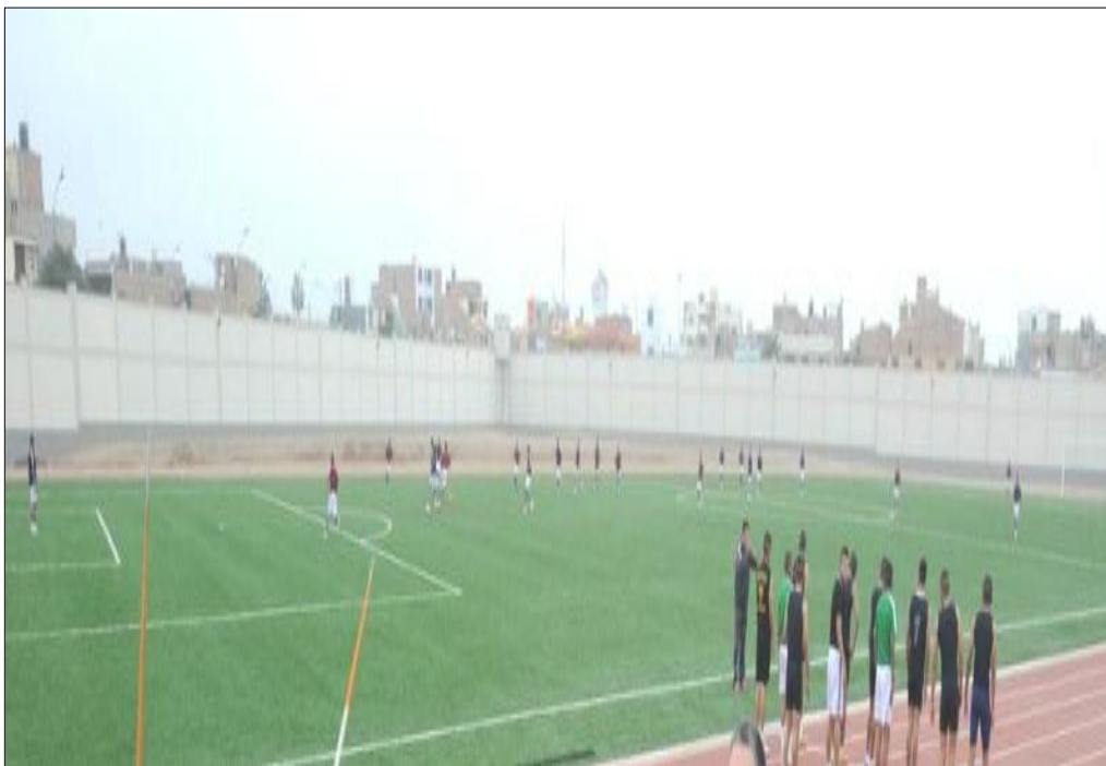
Estadio del Colegio Militar Leoncio Prado