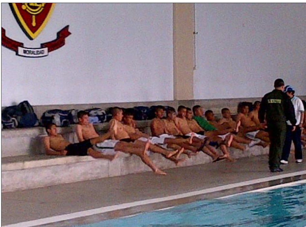
Alumnos de Colegio Militar Leoncio Prado en clases de Natación.