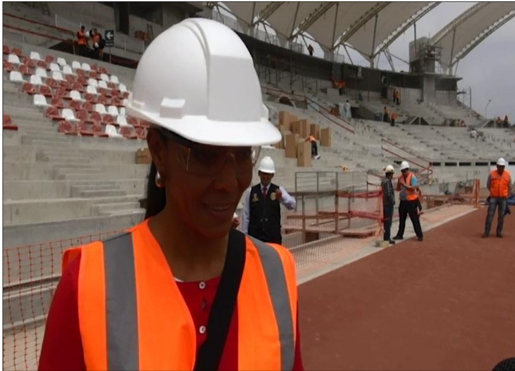
Visita a los avances de la obra del estadio atlético de Chan Chan.