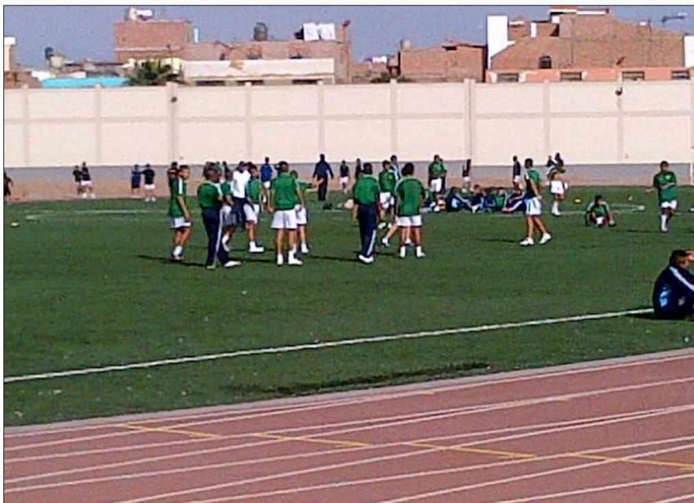
Supervisando el Estadio del Colegio Nacional San José