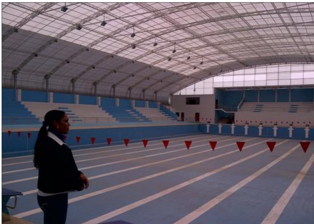
Visitando las obras de infraestructura del Colegio Nacional San José, Chiclayo.