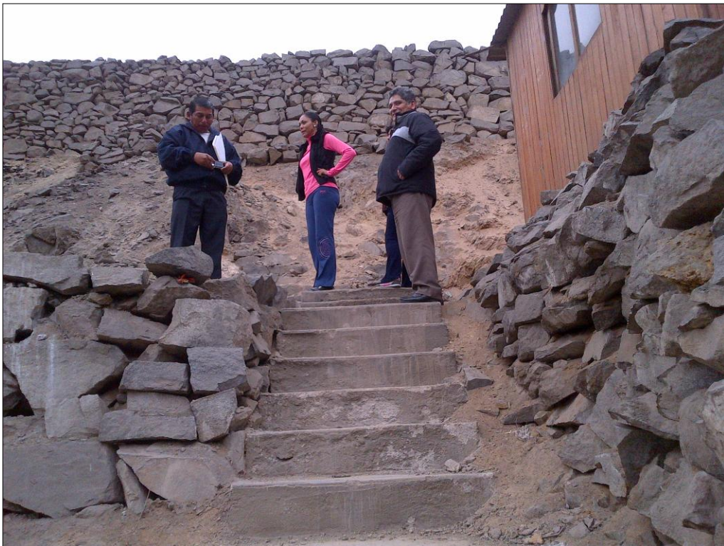
Conversando con los dirigentes viendo la posibilidad de gestionar una loza deportiva para los niños.