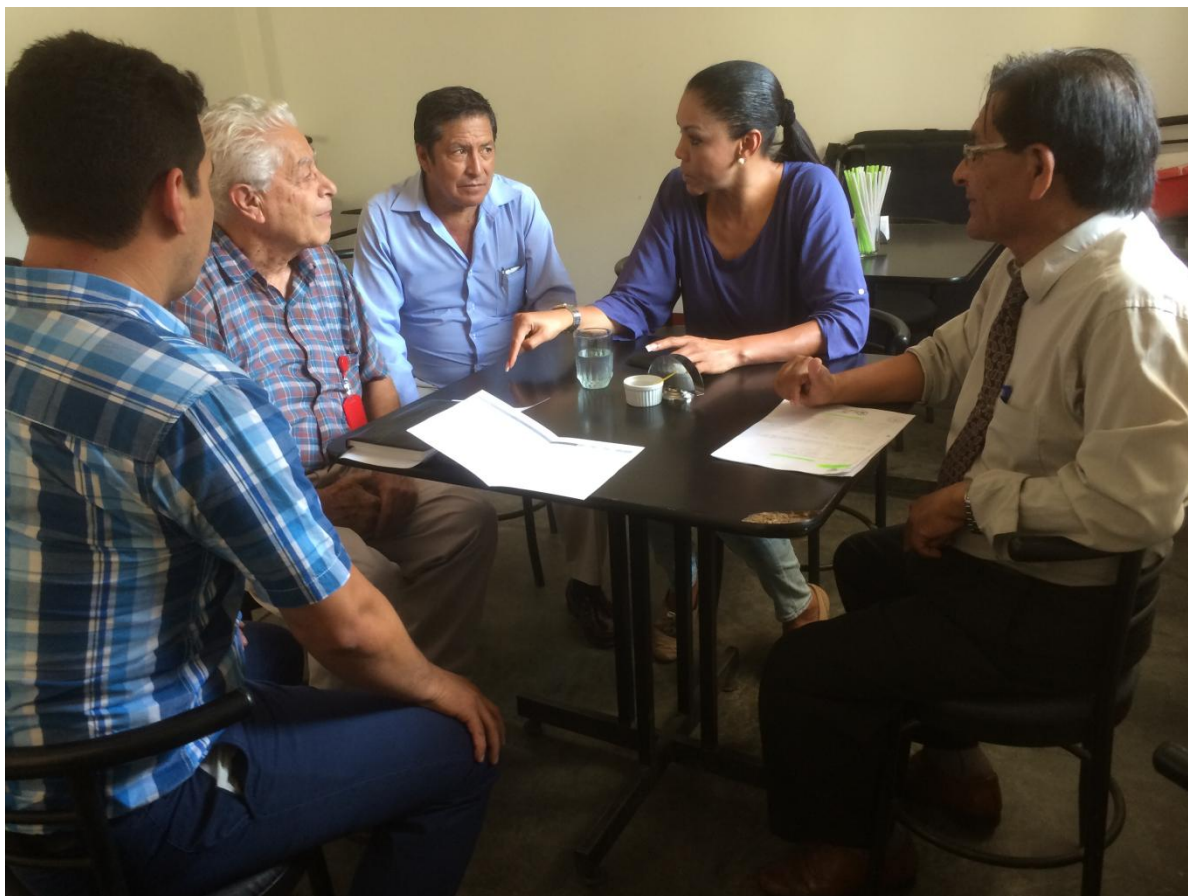
Congresista Uribe y director de la I.E. "Independencia" escuchan compromisos de representantes del Pronied.