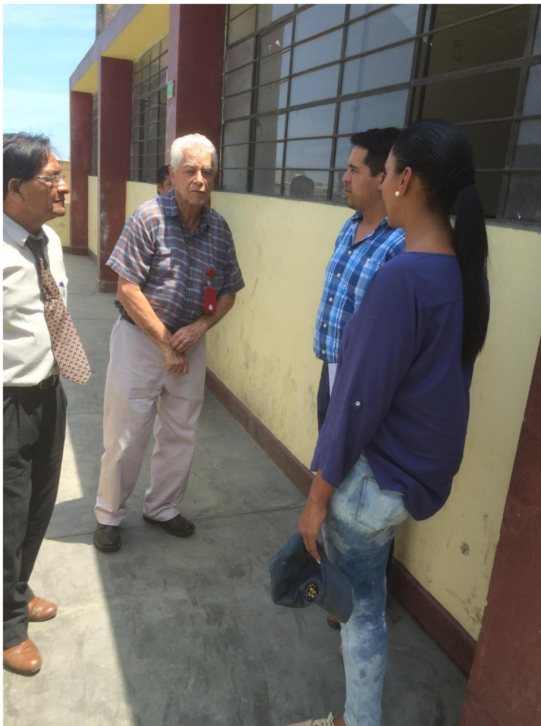
Especialistas del Pronied, director del centro educativo y parlamentaria inician recorrido del colegio.