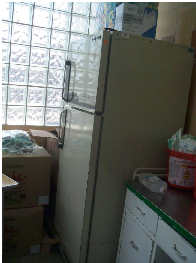
Existe solo una refrigeradora para la Unidad de Quemados