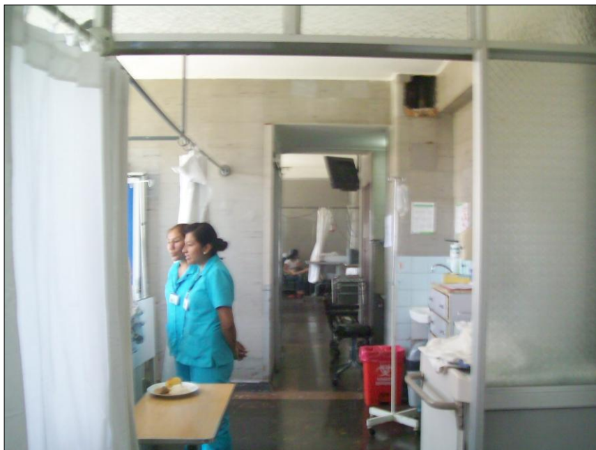
Sala de la Unidad de Cirujía Plástica.