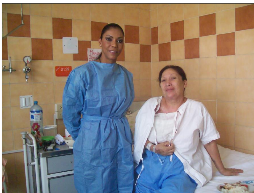
La Congresista Cenaída Uribe recibiendo las quejas de los pacientes de la Unidad de Quemados.