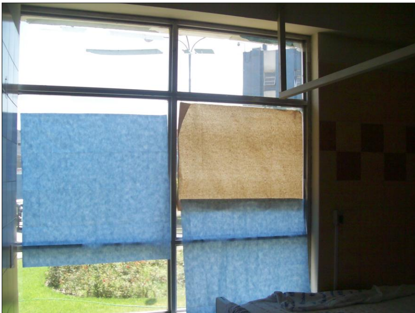
La sala donde los pacientes descansan para recuperarse de sus quemaduras, no tienen cortinas, usan solo papel para protegerlos del sol.