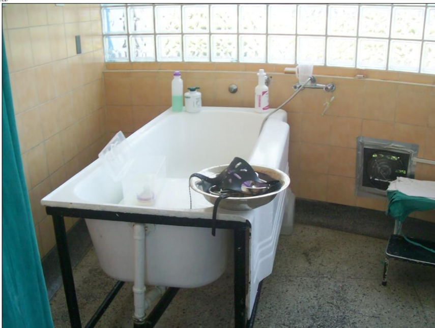
Existe solo una bañera para hombres, mujeres y niños en la Unidad de Quemados.