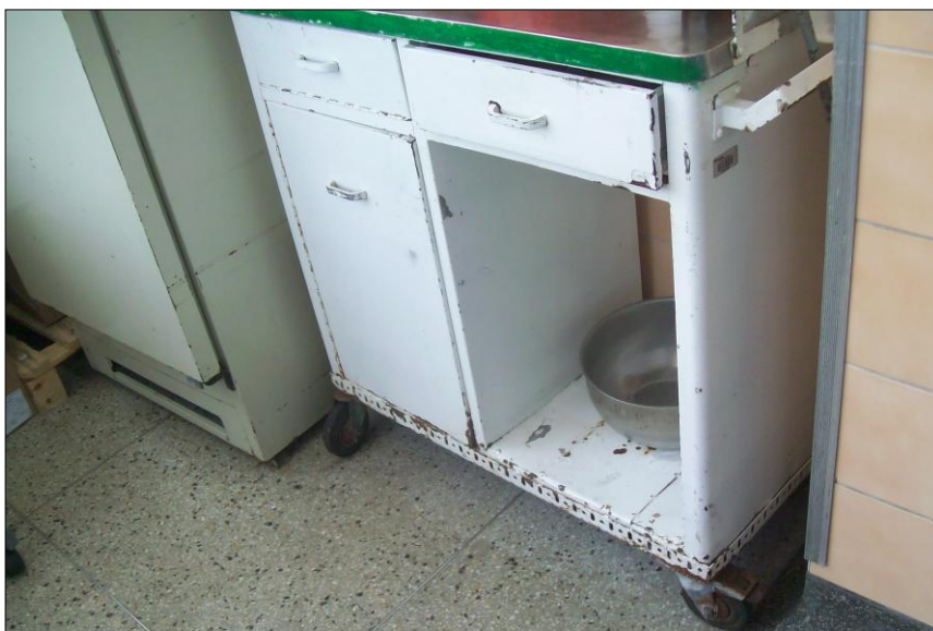
Los muebles de la Unidad de Quemados se encuentran oxidados, siendo un peligro para los pacientes propensos a infecciones.