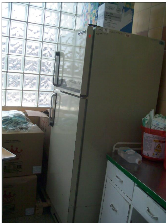
Existe solo una refrigeradora para la Unidad de Quemados