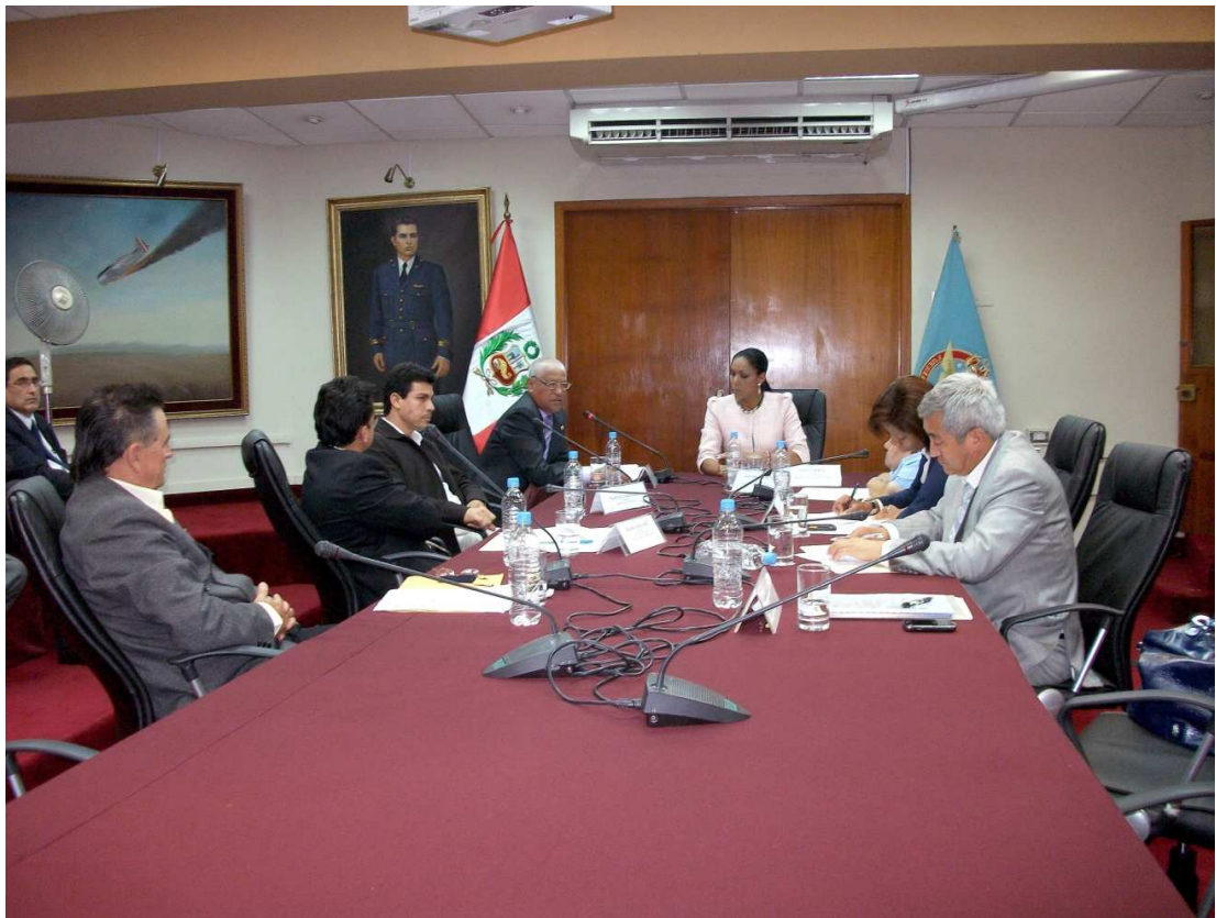
Congresista Uribe dirige el Grupo de Trabajo de Deporte, donde se investiga el caso del Club Deportivo San Marcos.