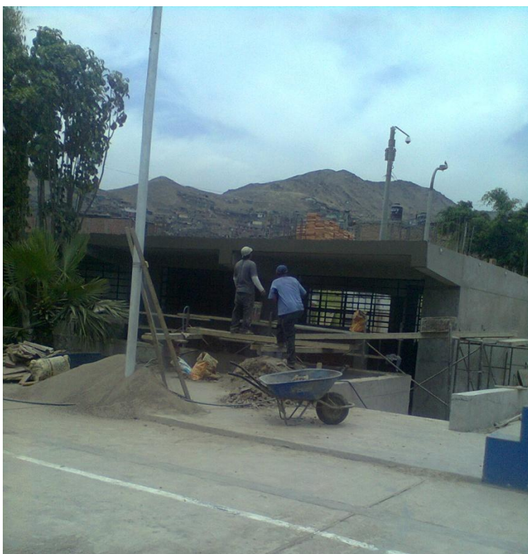
Avances de las obras en el centro educativo de Independencia.