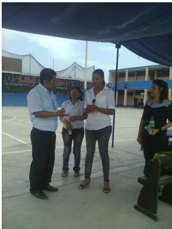
Congresista Uribe coordina con el director del I.E. N° 3050.