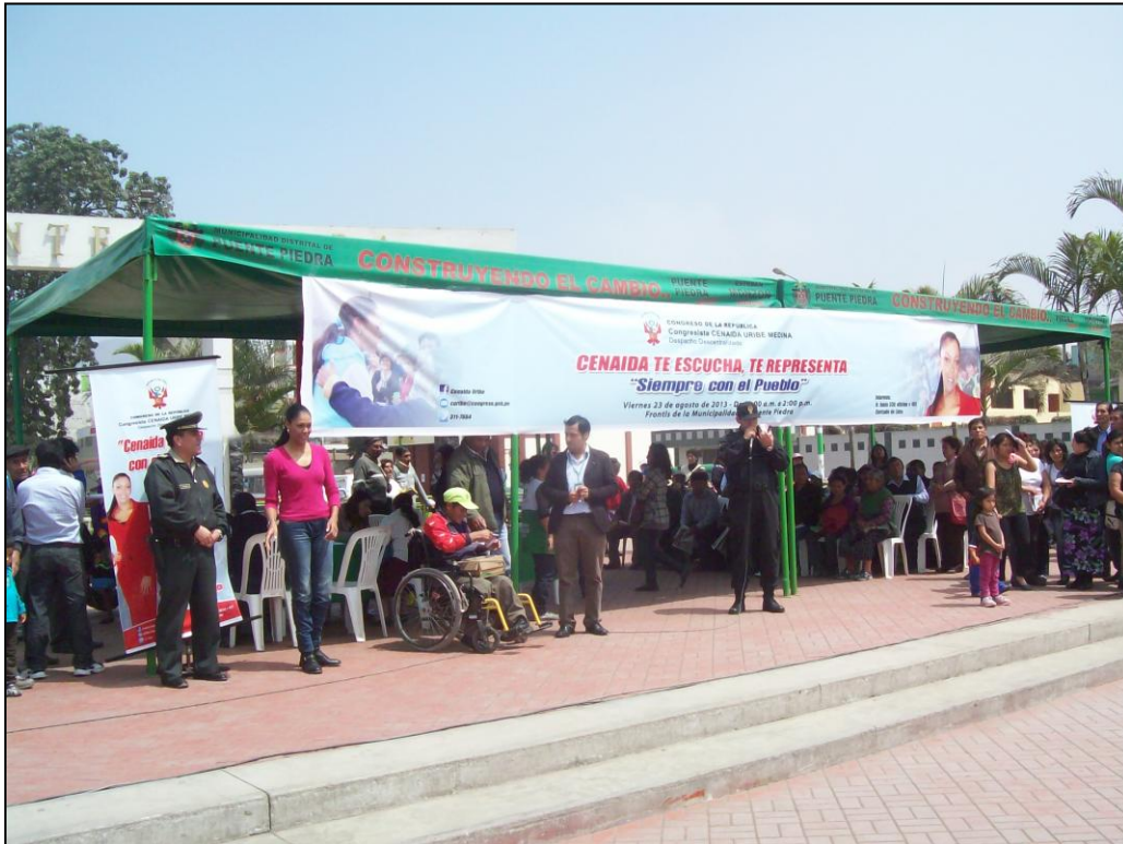
La Congresista Cenaida Uribe saluda a los vecinos del distrito de Puente Piedra que han asistido al Despacho Descentralizado.