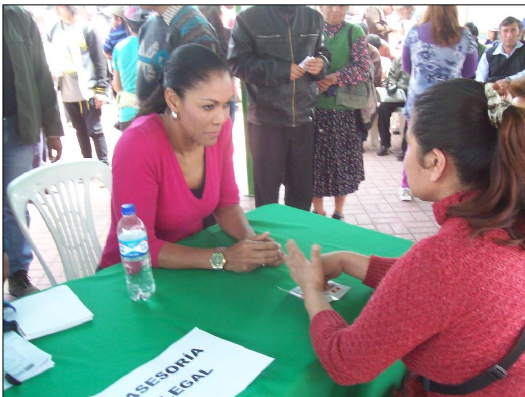
La Congressista Cenaida Uribe atendiendo a un ciudadana y orientándolo en temas de pensión de alimentos para sus niños.