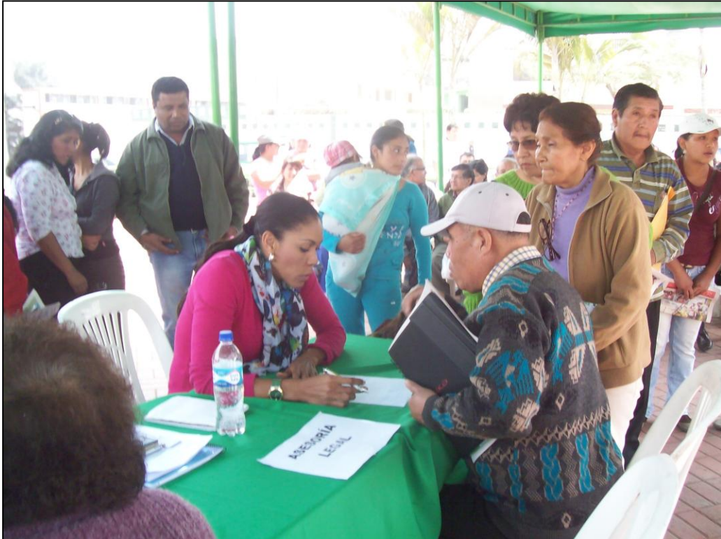
La Congresista Cenaída Uribe atendiendo a un ciudadano y orientándolo en temas de gestión de proyectos de agua para su comunidad.