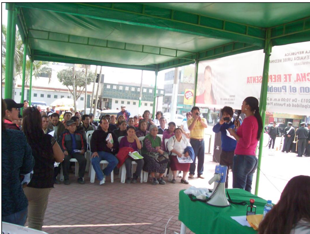
La Congressista Cenaida Uribe escuchando las demandas de los pobladores.