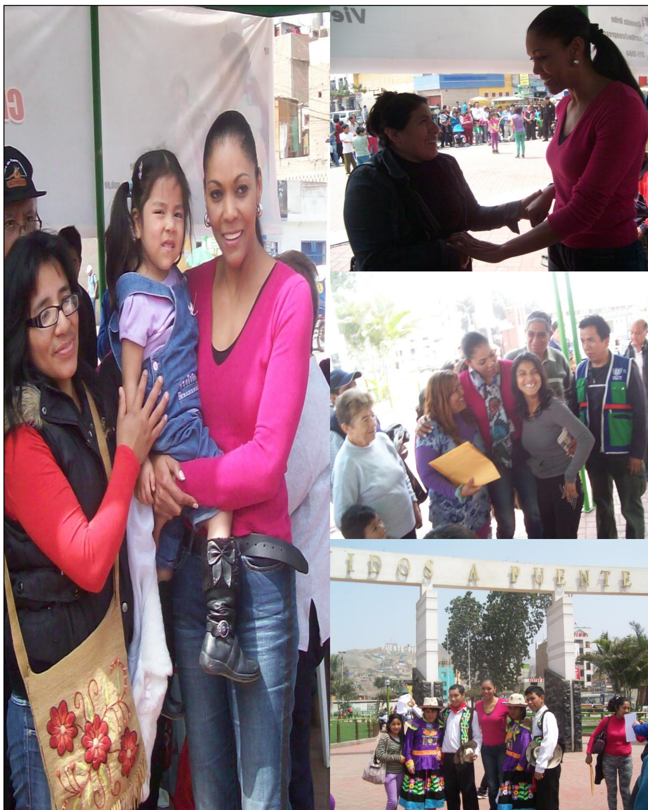
La Congresista Cenaida Uribe compartiendo gratos momentos con los pobladores del distrito de Puente Piedra.