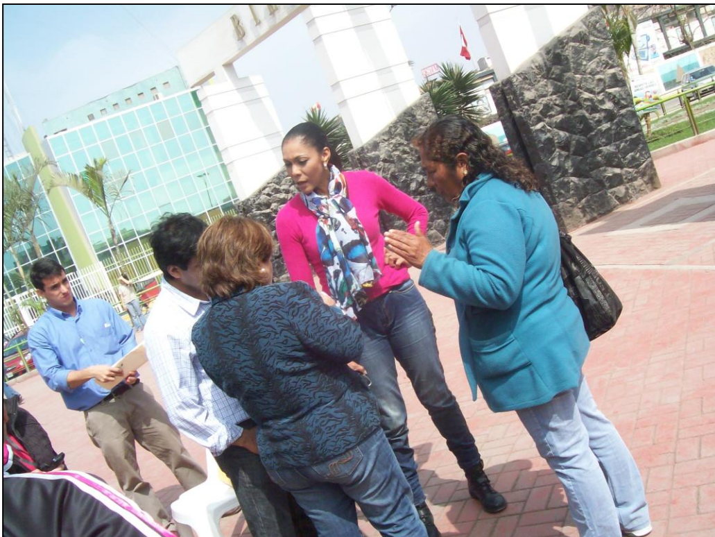
Atendiendo a dirigentes de comedores populares y vaso de leche.