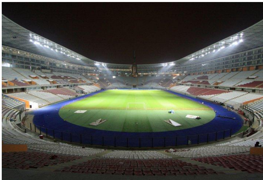
Proyecto de Inversión Publica en Ejecución por el IPD Estadio Nacional Habilitacion de explanas deportivas – En proceso. Habilitación piscina tribuna sur – En proceso.