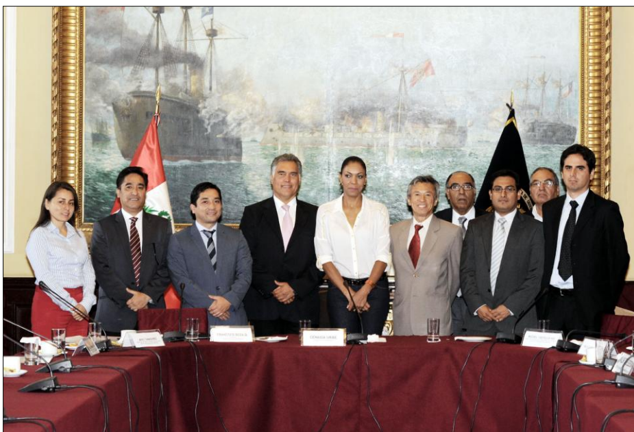
La Congresista Cenaida Uribe junto al presidente y los altos funcionarios del Instituto Peruano del Deporte.

Jr. Junin N° 330 – Oficina N° 401 Lima Cercado Teléfonos: 3117664