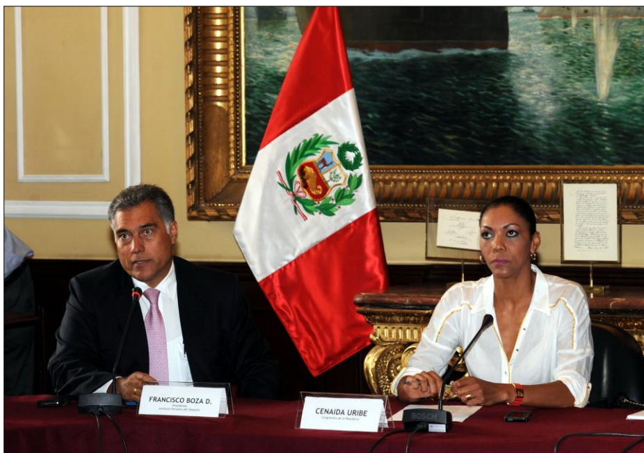
El Presidente del Instituto Peruano del Deporte, Francisco Boza explica los avances de los programas, proyectos de inversión pública y actividades a favor del deporte.