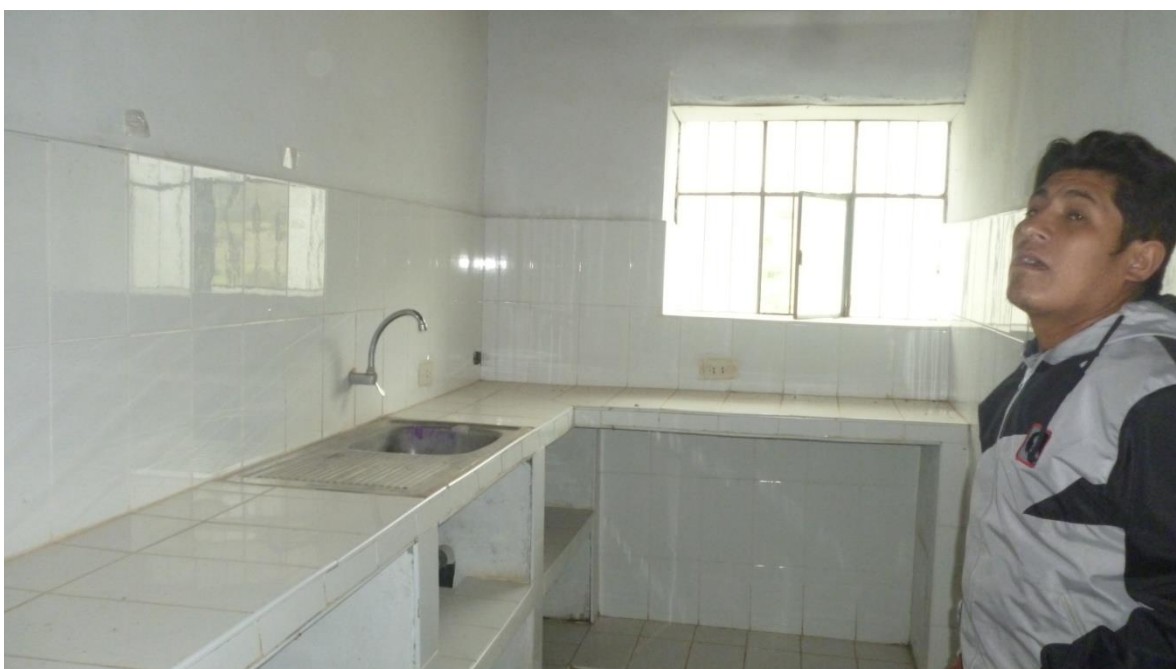
En esta foto se aprecia el are de cocina y laandera.