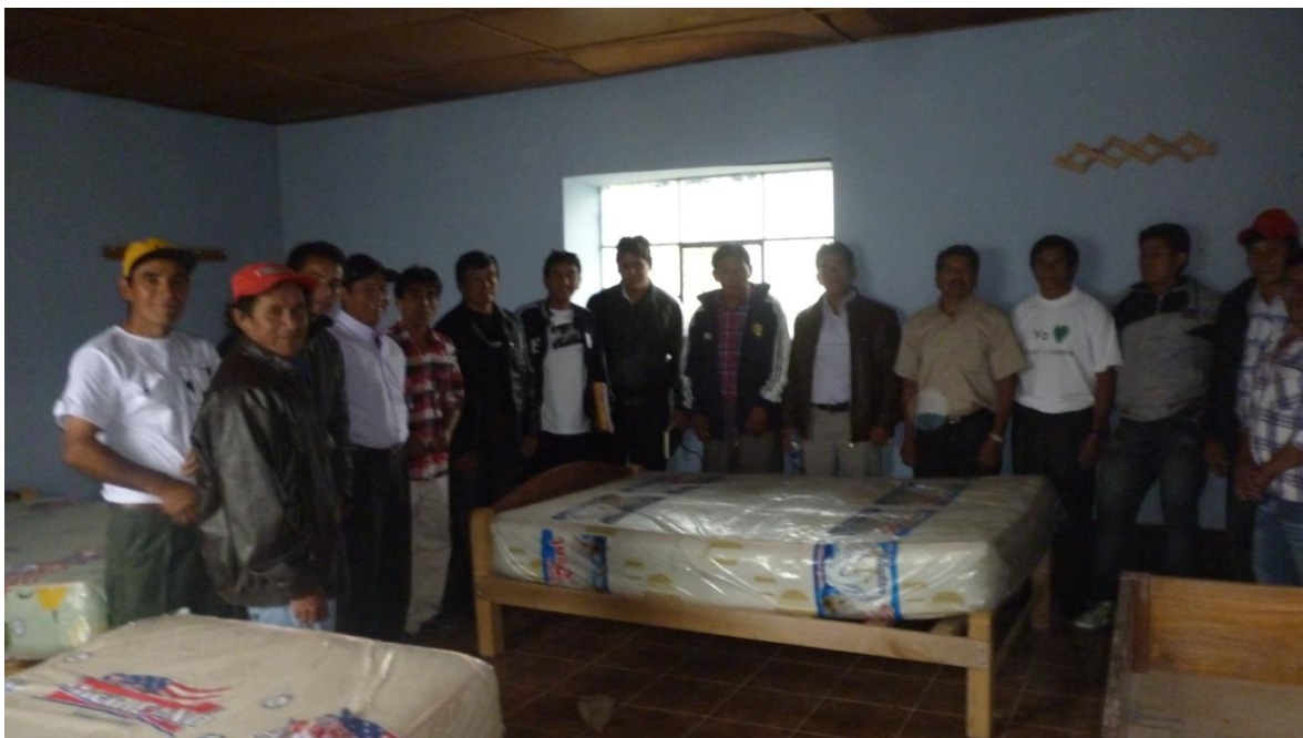
Los servicios higienicos, como se aprecian en buen estado y sobre todo los acabados.