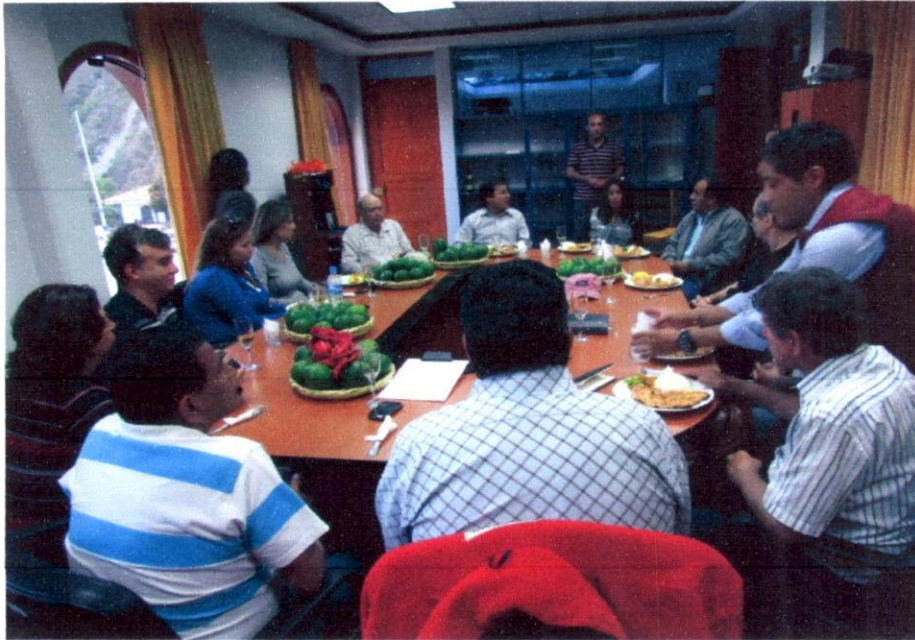
Imagen N° 3: Pequeño refrigerio que compartimos con el Alcalde de la Municipalidad Distrital, los regidores y la ONG Asociación de Salgalú.