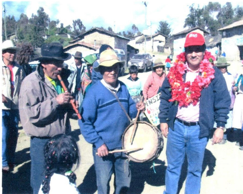
Imagen N° 19: Con los músicos de Uratari que esperaron a sus autoridades con música y danzas con los instrumentos típicos del lugar.