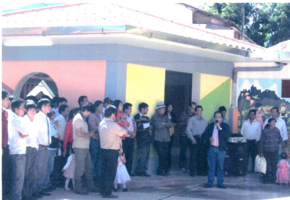
Imagen N° 10: En la ceremonia, también me dirigí a la población para darles mi agradecimiento por la invitación y fortalecer el compromiso del Gobierno.