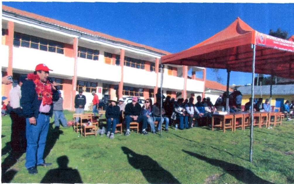
Imagen N° 23: Palabras dirigidas a los pobladores de esta Comunidad de Uratari y a los visitantes en general. Dando a conocer los trabajos que viene realizando el Gobierno con el propósito de beneficiar pueblos más alejados y olvidados.