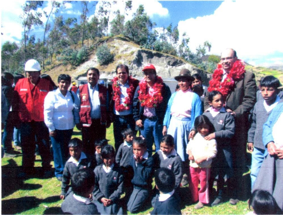
Imagen N° 17: Foto de recuerdo con los pobladores de la amable Comunidad de Choquemarca.