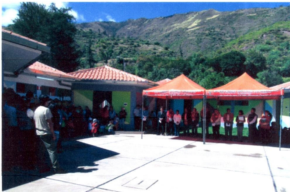
Imagen N°9: Como es debido, el sr. Alcalde de Limatambo, se dirige a la población que se animó a ser parte de la inauguración de este programa.

En esta inauguración estuvo presente el Vice Ministro de Gestión Pedagógica, José Martín Vegas Torres, así como las autoridades locales del distrito encabezadas por su alcalde, regidores, gobernador, los planteles educativos, profesores y alumnos.