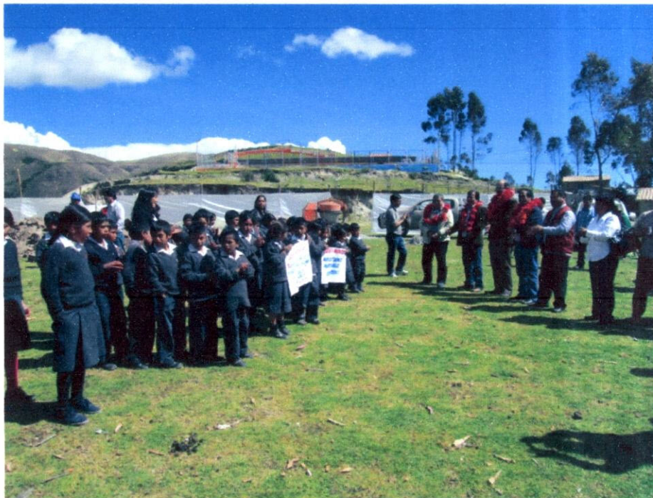
Imagen N° 16: En la visita con el Alcalde, el Vice Ministro de Gestión Pedagógica y autoridades del Distrito de Limatambo, a la Comunidad de Choquemarca.