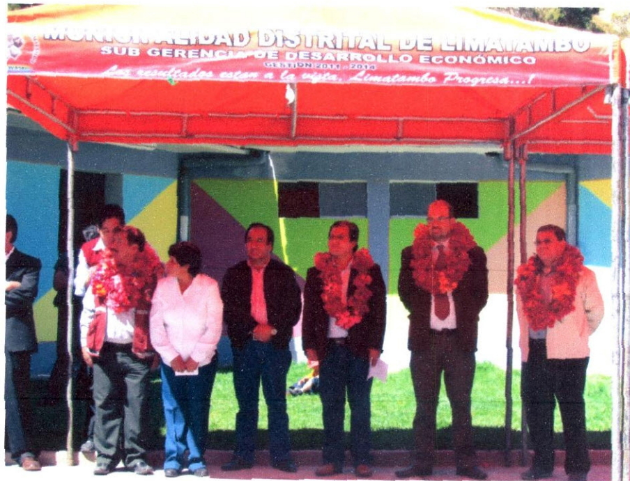
Imagen N° 12: Palabras en el nuevo local de Kusi Wawa.