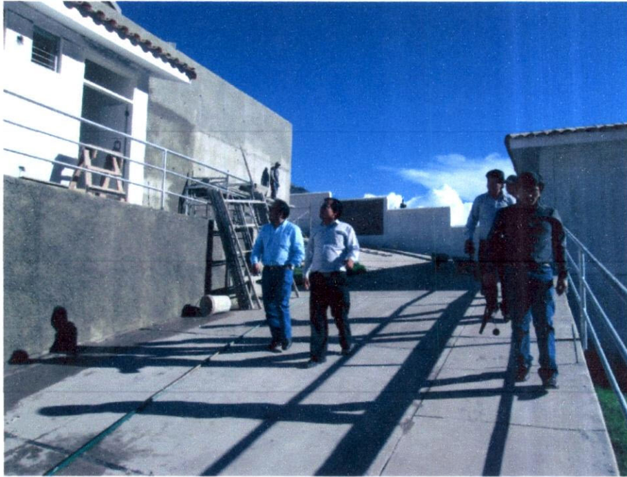
Imagen N° 6: En la zona de construcción, apreciando lo que vendría a ser el futuro Hospital de Limatambo.