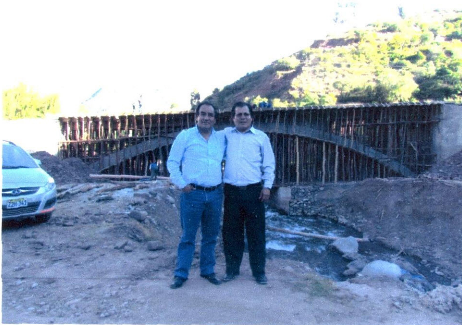
Imagen N° 8: Junto con el Alcalde de Limatambo, podemos apreciar el puente que pronto será culminado para beneficio de todos los pobladores y turistas en general.