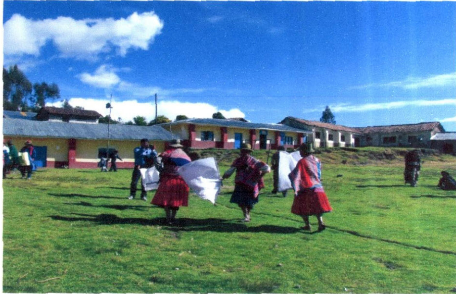
Imagen N° 18: Los pobladores de la Comunidad de Uratari nos recibieron demostrando su característico baile de la zona.