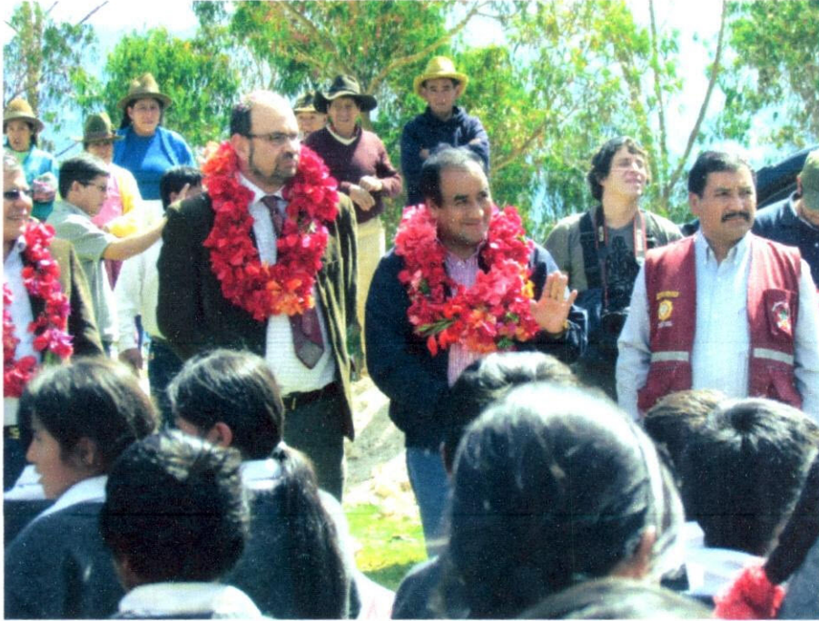
Imagen N° 15: En la Comunidad de Choquemarca, junto al Vice Ministro de Gestión Pedagógica y el Alcalde de Limatambo.