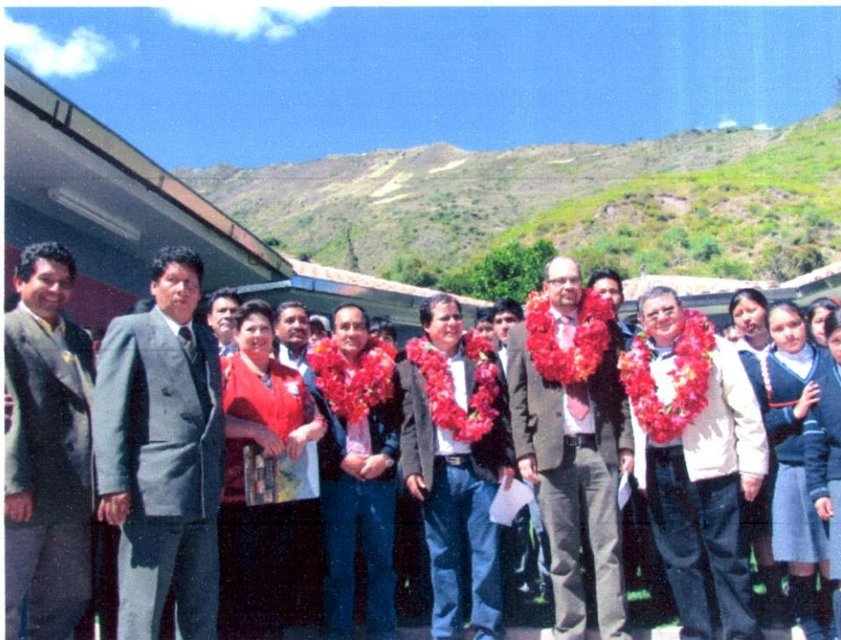
Imagen N° 14: Foto con las autoridades del Distrito de Limatambo.