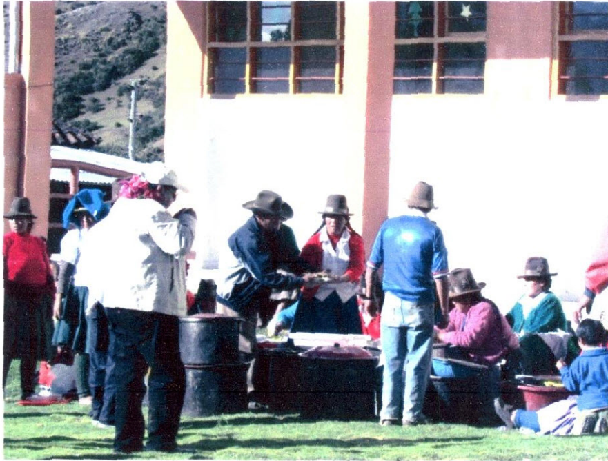
Imagen N° 20: Los amables pobladores de Uratari, nos sorprendieron con un refrigerio hecho a base de los productos de la zona.