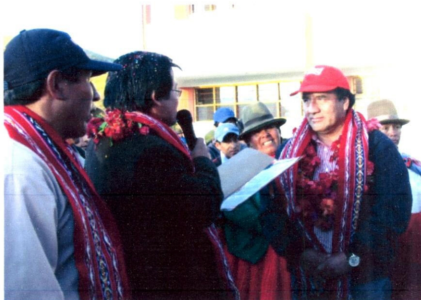
Imagen N° 23: El Alcalde de Limatambo, muy agradecido con mi visita y preocupación, me hace entrega de la Resolución de Reconocimiento de los pobladores de la zona.