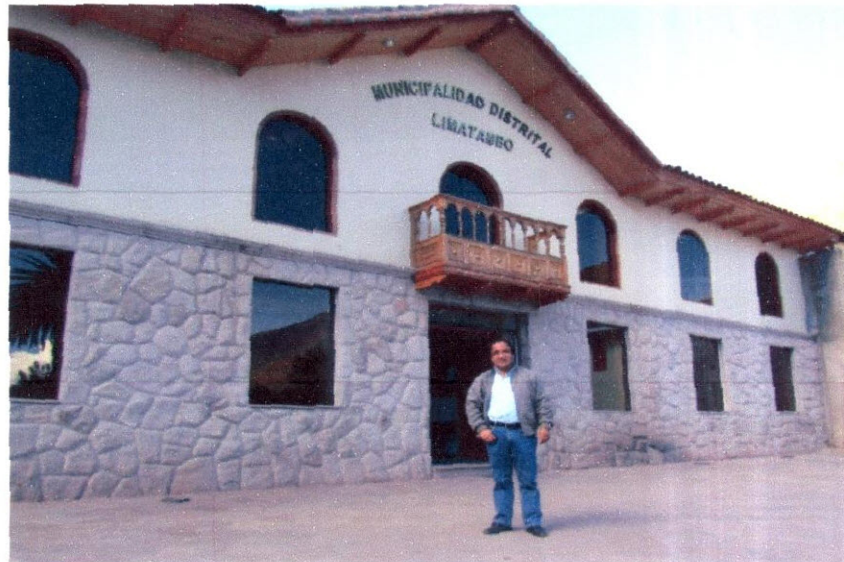
Imagen N° 1: En las afueras de la Municipalidad de Limatambo, donde estamos listos para tener la reunión.