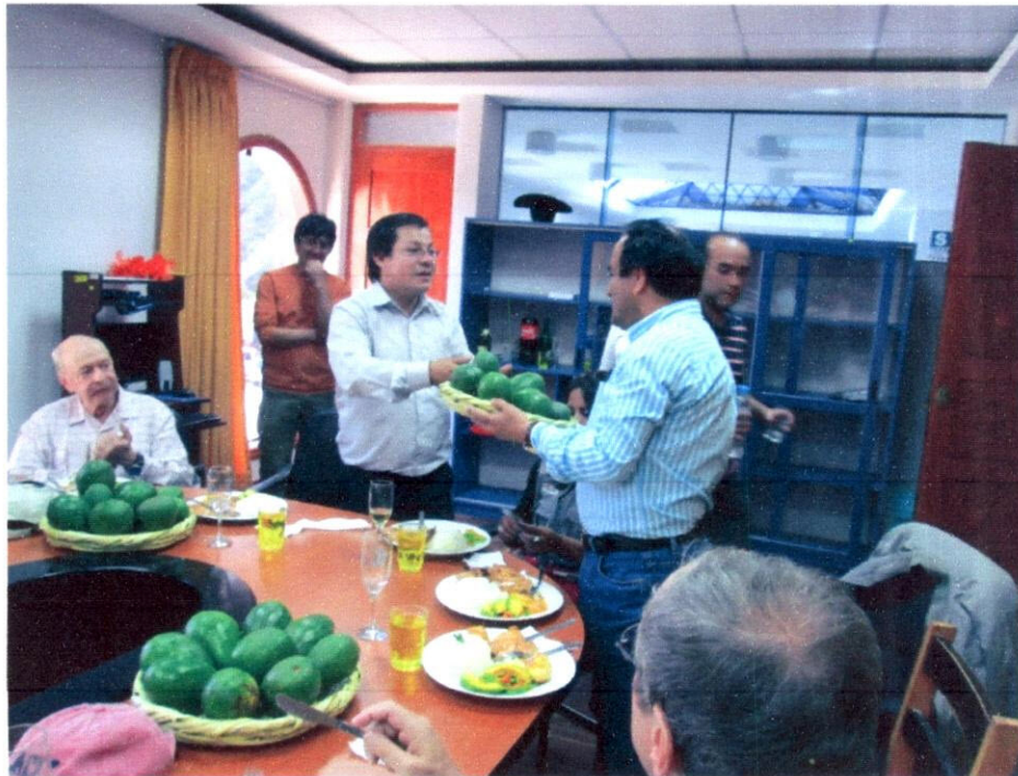
Imagen N° 4: Antes de despedirme, el Alcalde de Limatambo me conmovió obsequiándome el fruto característico de la zona, la palta.