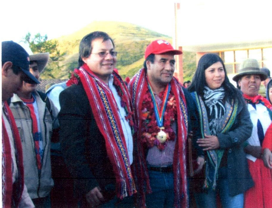
Imagen N° 24: Una foto con el Alcalde de Limatambo y sus regidores, después de recibir el reconocimiento.