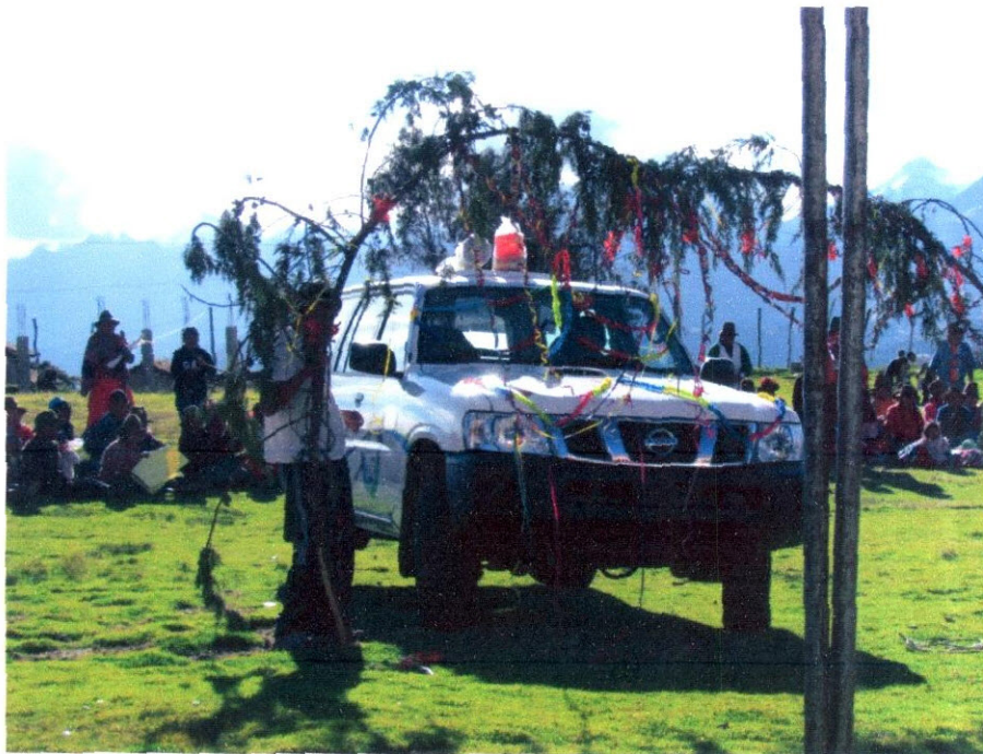
Imagen N° 21: Podemos apreciar la camioneta donada por la ONG Asociación Salgalú que será utilizada como ambulancia para las emergencias de los pobladores.