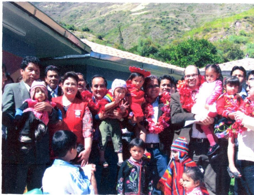
Imagen N° 13: Una foto de recuerdo junto a la infancia que será beneficiada con el nuevo programa de Kusi Wawa.