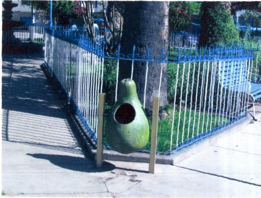
Imagen N° 5: En la Plaza Mayor de Limatambo, se exhibe un creativo tacho de basura con motivo al fruto que es representativo del lugar, como la palta.