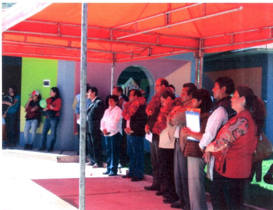
Imagen N° 11: En la inauguración junto al alcalde, al Vice Ministro y autoridades.