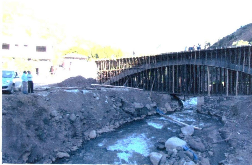
Imagen N° 7: En la zona de construcción, nos encontramos en el proceso de desarrollo de lo que vendría a ser el puente en la zona de Huerta Huaycco.