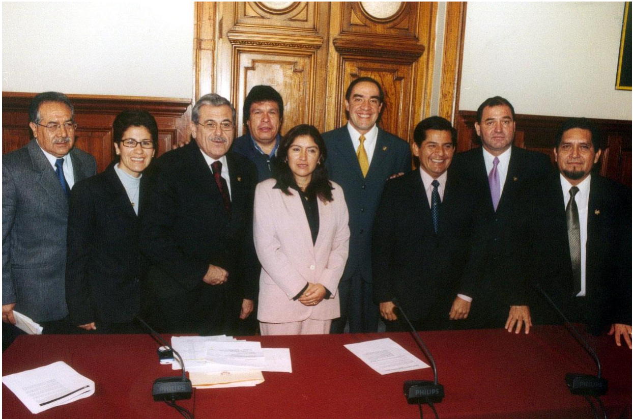
Miembros de la Comisión de Defensa al Consumidor y Organismos Reguladores de los Servicios Públicos Periodo Legislativo 2004 - 2005

Instalado el grupo de trabajo y elegida la Mesa Directiva de la Comisión, el Congresista Yonhy Lescano Ancieta, en calidad de Presidente de la comisión, agradeció la confianza depositada en su persona y se comprometió a desarrollar un eficiente trabajo en la presente legislatura. Asimismo, anunció la convocatoria de todas las Asociaciones de Consumidores y Usuarios, instituciones, medios de comunicación y personas naturales comprometidos con la defensa de los derechos de los consumidores, invocándoles a realizar un trabajo conjunto y coordinado.