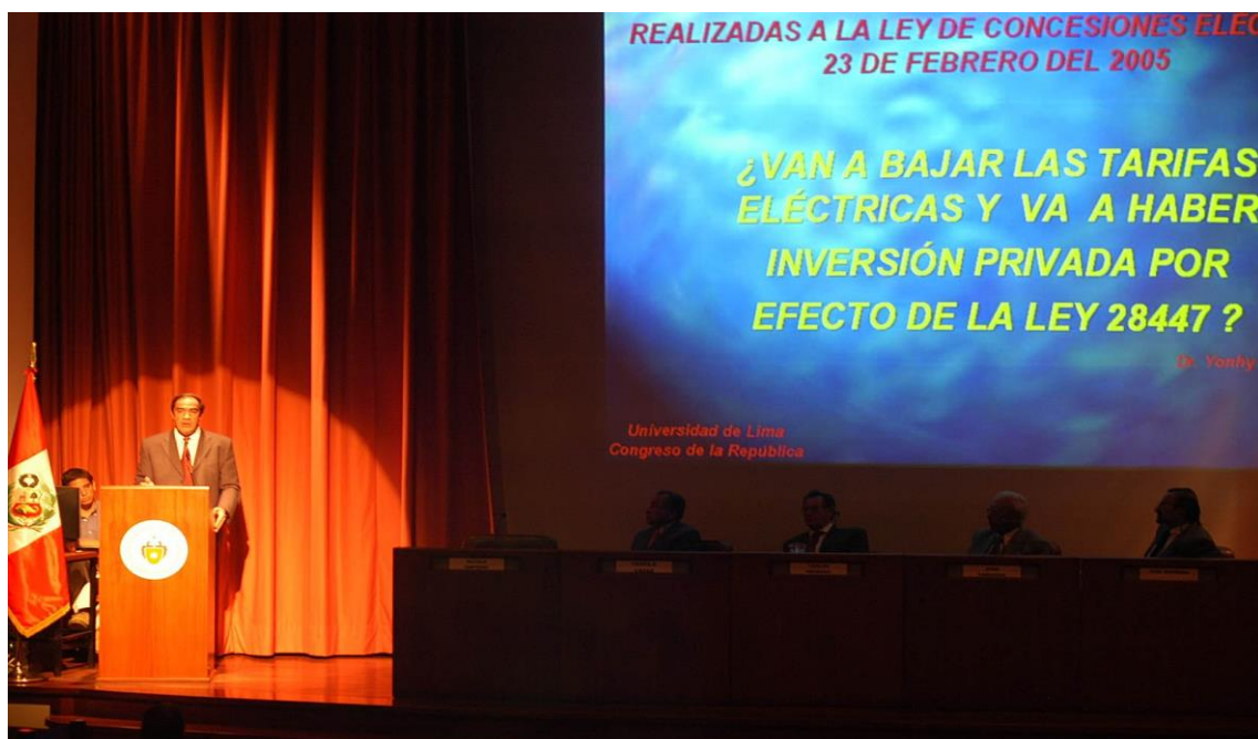
Presentación del Congresista Yonhy Lescano ene el Auditorio Central de la prestigiosa Universidad de Lima

La ponencia de fondo estuvo a cargo del Dr. Yonhy Lescano Ancieta, Presidente de la Comisión de Defensa del Consumidor y Organismos Reguladores de Servicios Públicos del Congreso con el tema “¿Van a Bajar las Tarifas Eléctricas y va a haber Inversión Privada por efecto de la Ley 28447?”