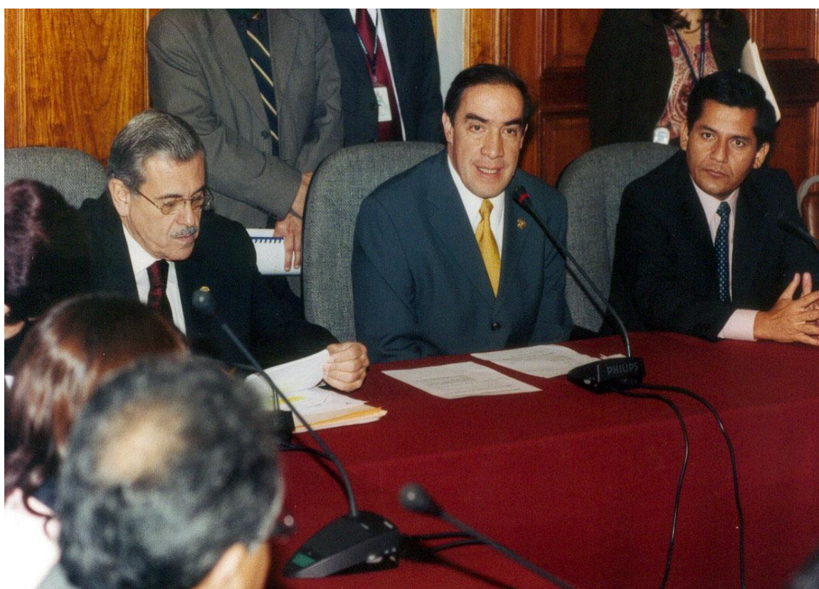
Mesa Directiva de la Comisión de Defensa al Consumidor y Organismos Reguladores de los Servicios Públicos Periodo Legislativo 2004-2005

En sesión de fecha 19 de agosto de 2004, luego de instalada la Comisión Defensa del Consumidor y Organismos Reguladores de los Servicios Públicos y asumida la Presidencia por el señor congresista Dr. Yonhy Lescano Ancieta y designados también los señores parlamentarios Jorge Mufarech Nemy y Jhony Peralta Cruz como Vicepresidente y Secretario respectivamente, inició sus actividades este Grupo de Trabajo.