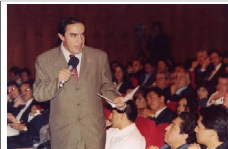
Congresista Lescano, sustentando la posición de miles de usuarios en los servicios de telefonía, en la Audiencia Pública convocada por OSIPTEL

“Factor de productividad otro engaño a los usuarios, telefónica chantajea al gobierno, amenazando con reducir en 60 % su inversión en el país”