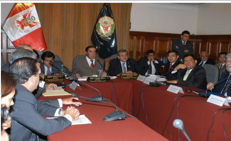
Sesión de la Comisión de Defensa del Consumidor en la cual se convocó a la SBS, Ministerio del Interior, BCR, INDECOPI, Asociación de Bancos del Perú y Representantes de Casas de Cambios formales

EL PRESIDENTE DE LA COMISIÓN YONHY LESCANO CONFORMÓ GRUPO DE TRABAJO QUE ESTABLECIÓ LOS MECANISMOS DE SOLUCIÓN DE CORTO PLAZO AL TEMA DE LOS BILLETES CB-2001 DE US $ 100 Y DE OTRAS POSIBLES SERIES