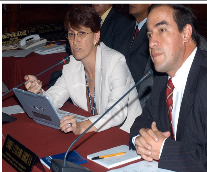
Presentación de la Dra. Pilar Mazzetti Ministra de Salud ante la Comisión de Defensa del Consumidor

La Comisión bajo la Presidencia del Congresista Yonhy Lescano Ancieta, realizó cinco sesiones para tratar el problema de los altos costos de este seguro obligatorio y su incidencia en los paros y marchas que realizaron los transportistas en varias ciudades del Perú. Dado el problema social que el costo de este seguro estaba provocando, la Comisión reunió a todos los actores involucrados, consiguiendo que el Ministerio de Salud bajará su tarifario MINSA-SOAT en un promedio del 10% y que la principal empresa aseguradora congelara sus tarifas mientras duraran las negociaciones con los transportistas que implementaron medidas de fuerza.