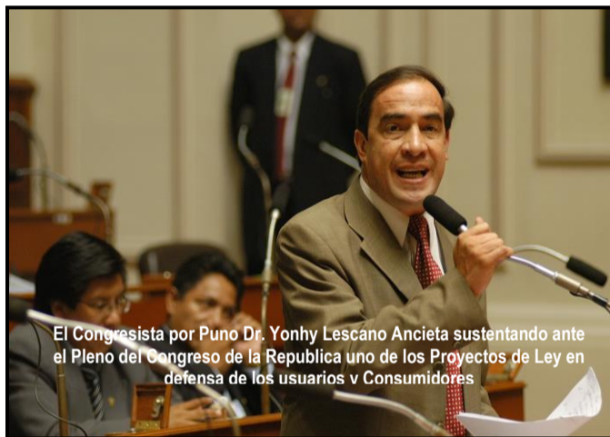
El Congresista por Puno Dr. Yonhy Lescano Ancieta sustentando ante el Pleno del Congreso de la República uno de los Proyectos de Ley en defensa de los usuarios y Consumidores

El Congresista Yonhy Lescano Ancieta al iniciar su labor en la Comisión de Defensa del Consumidor, siempre buscó la solución a corto plazo a los problemas que afectan a los millones de consumidores y usuarios peruanos, tales como los altos precios de las tarifas de servicios públicos, particularmente el costo de la electricidad y del servicio de telefonía tanto fija como celular; los altos costos de los servicios bancarios y financieros (las llamadas comisiones) que perjudican especialmente a los usuarios de menores ingresos; los elevados precios de los servicios del Estado en forma de tasas indiscriminadas por derechos de tramitación, SOAT, arbitrios municipales, etc.