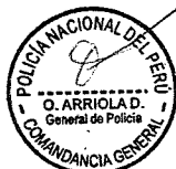
VICENTE TIBURCIO ORBEZO Ministro del Interior